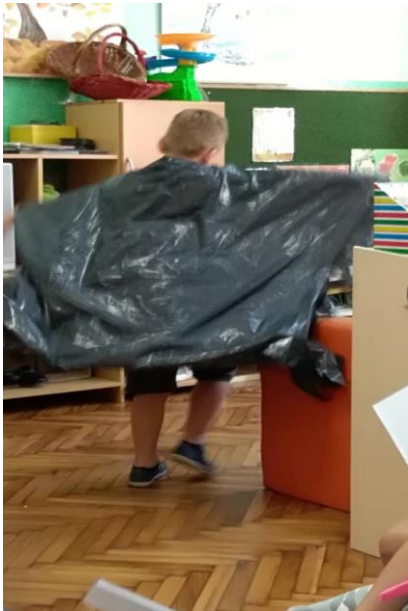
Slika 25. Prikaz rekvizita koje ima jastreb tijekom uloge u igrokazu „Nikad nisi sam“.