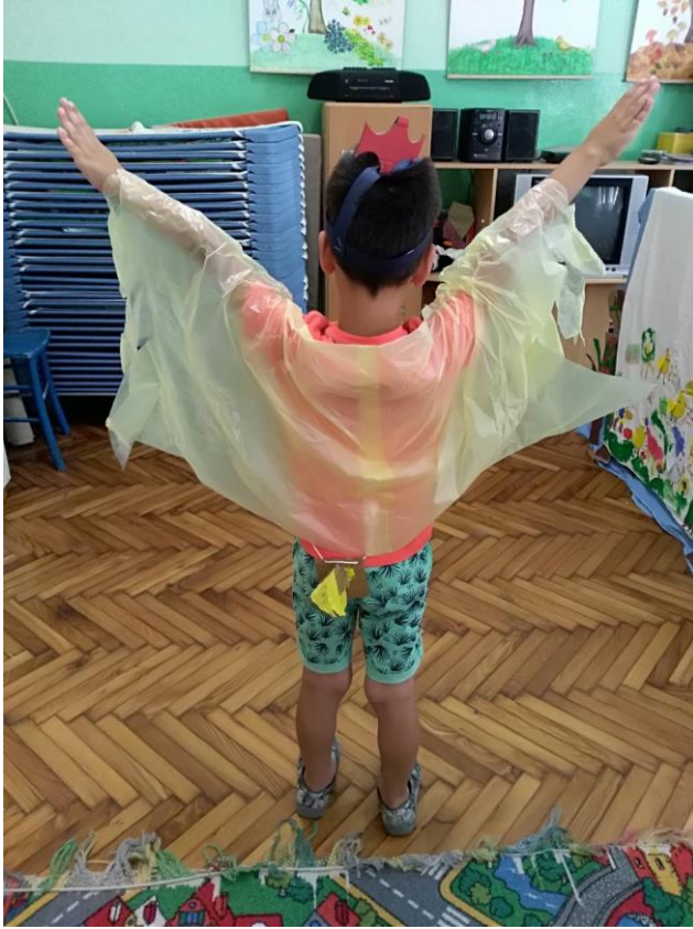
Slika 24. Prikaz rekvizita koji su izrađeni za ulogu pilića u igrokazu „Nikad nisi sam“.