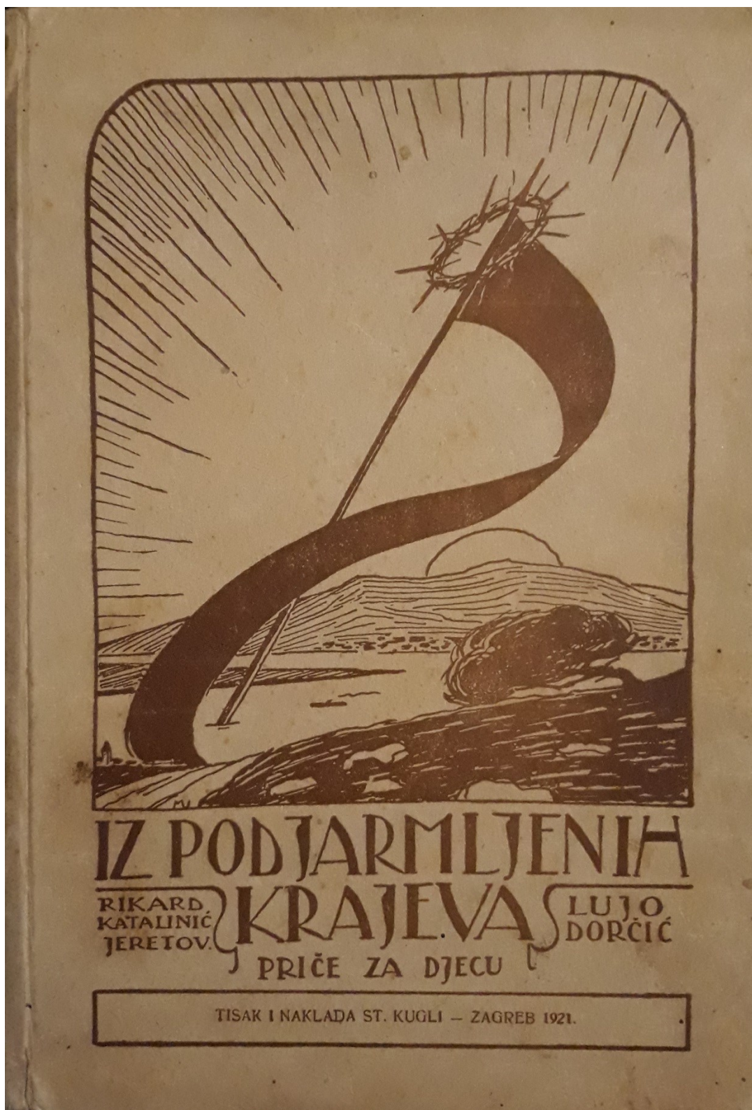
Prilog br. 4: Naslovnica knjige Iz podjarmljenih krajeva