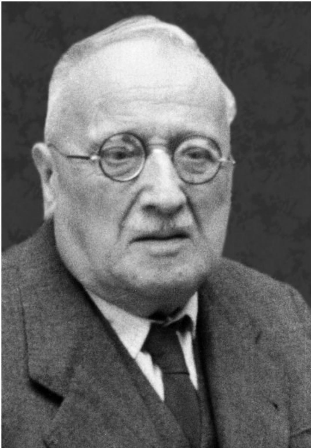
Prilog br. 1: Viktor Car Emin