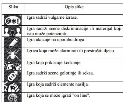
Tablica 1. Opis PEGI sličice 63