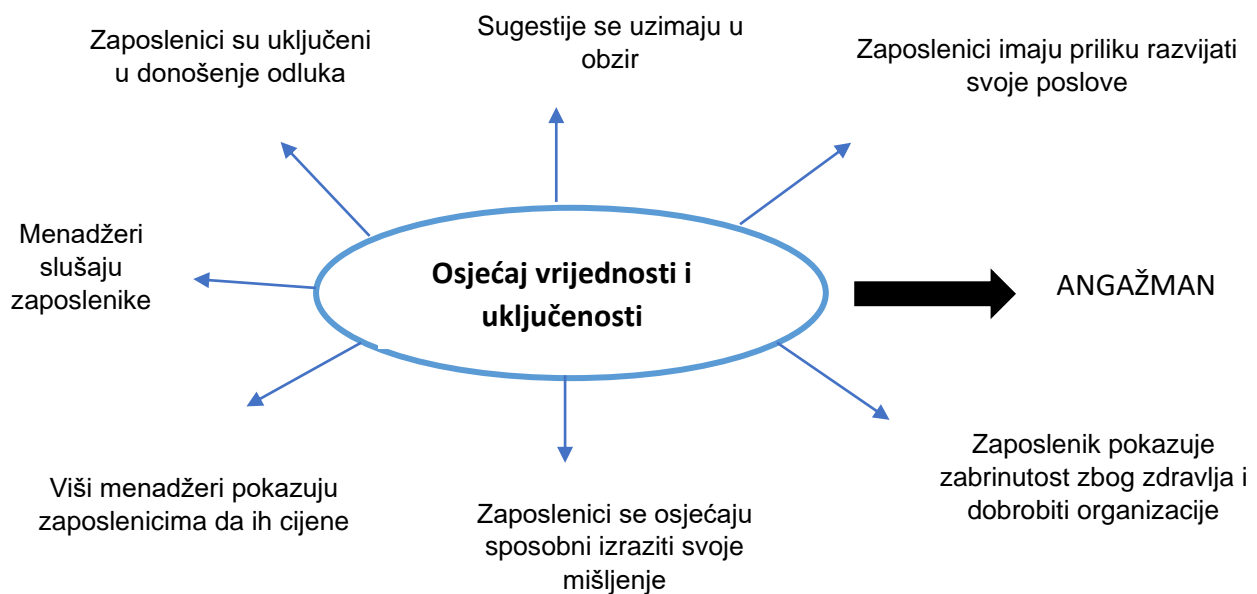
Slika 2. Model angažmana zaposlenika i menadžera