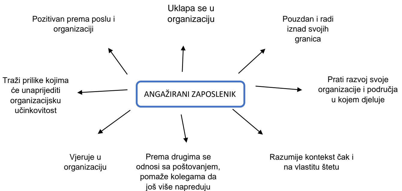
Slika 1. Karakteristike angažiranog zaposlenika

Izvor: D. Robinson, S. Perryman, S. Hayday(2004.): The Drivers of Employee Engagement, str. 6 https://www.employment-studies.co.uk/system/files/resources/files/408.pdf