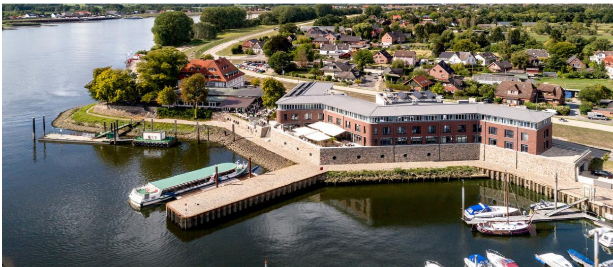
Slika 6. Hotel Zollenspieker Fahrhaus