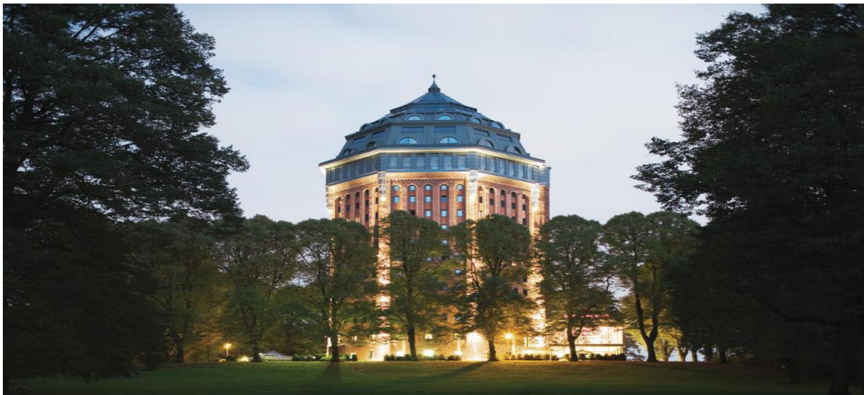
Slika 5. Movenpick Hotel Hamburg