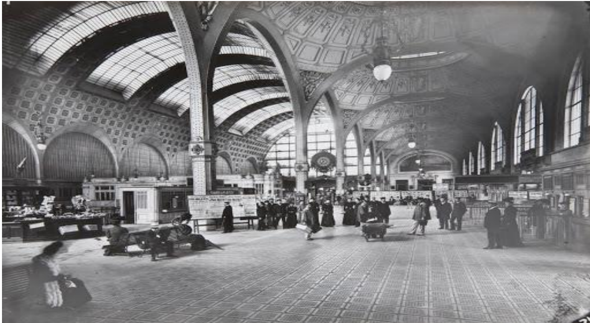
Slika 2. Interijer željezničke postaje Orsay (Pariz 1900.)