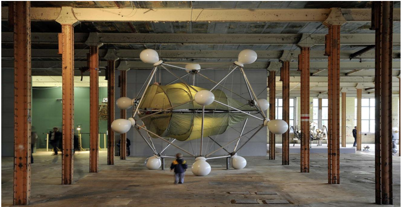
Slika 3. Interijer umjetničkog centra HALLE 14