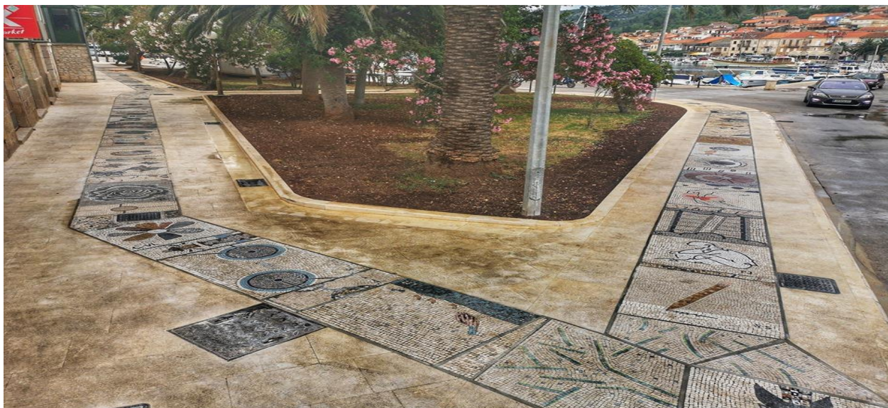
Slika 4. Mozaična šetnica u centru Vele Luke