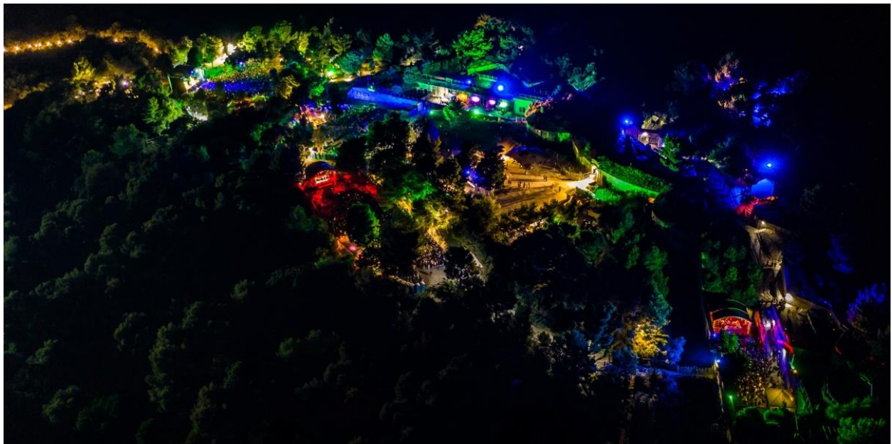
Slika 5. Fort Punta Christo, Outlook Festival 2019. 22

‘underground’ svijeta dub, dubstep, drum’n’bass, reggae, garage i hip-hop glazbe. Iste godine na ‘UK Festival Awards’ Outlook je proglašen najboljim inozemnim festivalom što je dodatno populariziralo samu destinaciju, Punta Christo, Pulu ali i Istru i Hrvatsku. 2012. godine organizacijski tim festivala susreo se s “problemom” popularnosti, a kako su htjeli zadržati izvornu filozofiju i ne širiti glazbeni spektar, odnosno narušiti koncept, kapacitet i atmosferu festivala, odlučeno je pokrenuti Dimensions Festival, o čemu će više riječi biti u sljedećem potpoglavlju, kako se dvije glazbene subkulture ne bi međusobno sudarale i dovele do organizacijskog kolapsa ideje festivala. 2013. Outlook festival od strane Turističke zajednice Pula dobiva poziv za organizacijom koncerta otvorenja u rimskom amfiteatru Arena u centru Pule, a da bi doživljaj bio potpun, s vremenom se u jednu od pozornica festivala upisuje i kompleks pulskih podzemnih tunela - Zerostrasse.