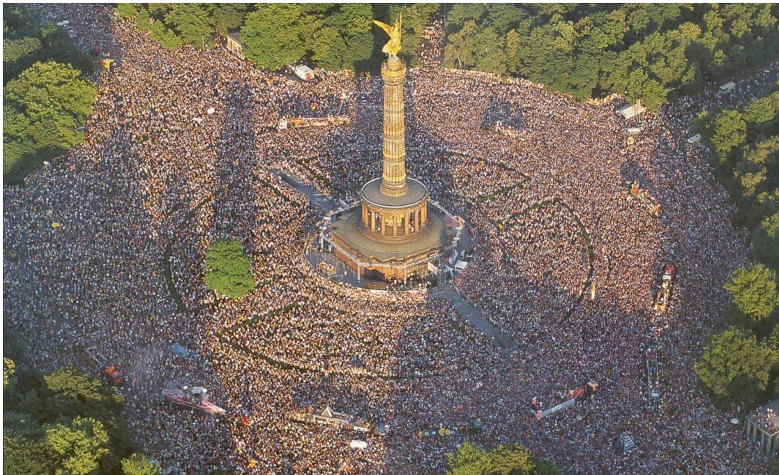
Slika 2. Love Parade Berlin 8

država u Europi, a drugi je “Mir, radost i palačinke”. Upravo tom parolom poslužio se njemački DJ Matthias Roeingh, poznatiji kao Dr. Motte, kada je sa svojom djevojkom Danielle de Picciotto u srpnju 1989. organizirao rođendansku zabavu za 150 ljudi na ulicama Zapadnog Berlina kao političku demonstraciju i poziv na međunarodno razumijevanje i toleranciju kroz ljubav i glazbu. Već sljedeće izdanje Parade Ljubavi okupilo je 2.000 posjetitelja pod glasnom parolom “Budućnost je naša”, a 1997. manifestacija je na ulice i trgove Berlina privukla preko milijun ljudi koji su u formi goleme karnevalske povorke u ritmovima techno, house i trance glazbe plesali do ranih jutarnjih sati šireći vibracije sve liberaliziranije društvene zajednice, oslobođene okova povijesti, postavljajući trendove i temelje urbane subkulture novim generacijama.