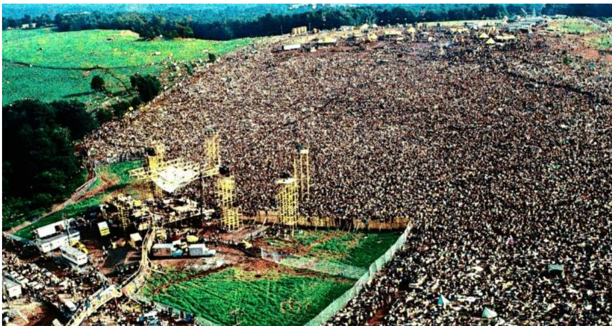
Slika 1. Woodstock 1969. 6

Povijest glazbenih festivala kakve danas poznajemo seže u pedesete godine prošlog stoljeća. Prije svega valja spomenuti Newport Folk Festival iz 1959. godine, festival na kojem je Bob Dylan održao povijesni koncert predstavivši rock'n'roll glazbu publici koja je štovala folk. Dylan je uz pomoć svoje Fender Stratocaster gitare izveo sada već kultnu pjesmu Like a Rolling Stone i električnu verziju pjesme Maggie's Farm. Monterey Pop festival osnovan 1967. godine u Kaliforniji možda je i prvi festival koji najviše podsjeća na današnje glazbene festivale. Festival je to na kojem su besplatno svirali Janis Joplin, Otis Redding i Jimi Hendrix koji je izvedbom pjesme 'Wild Thing' i 'zapaljivim' nastupom obilježio jedan od važnijih trenutaka u povijesti glazbenih festivala. Važno je napomenuti i kako je sav prihod od prodaje ulaznica i pića na spomenutom događaju doniran u dobrotvorne svrhe te je kao takav ujedno poprimio i humanitarni karakter. Dvije godine kasnije, 1969. pamti se kao godina čuvenog Woodstocka, trodnevnog festivala mira, ljubavi i glazbe koji je postao jedan od događaja koji su promijenili svijet rock'n'rolla i svijet uopće. Festivali u modernoj Zapadnjačkoj kulturi su uglavnom bili usko povezani s kontrakturnim pokretima, a Woodstock je vjerojatno najbolji primjer toga.