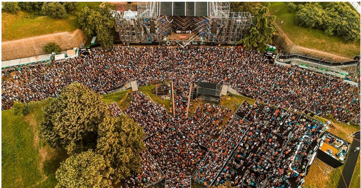
Slika 3. Exit Festival 2019. 9

Priču o povijesti glazbenih festivala zaključujem regionalnim primjerom ljetnog glazbenog festivala EXIT. 2000. godine skupina novosadskih studenata pod palicom Dušana Kovačevića oformila je pokret mladih za demokraciju Srbije i otpor političkom režimu Slobodana Miloševića te odlučila organizirati glazbeni festival na novosadskoj plaži Štrand, da bi se već sljedeće godine manifestacija preselila na danas kulturnu Petrovaradinsku tvrđavu. Festival je nastao na kulturološkim temeljima i idejama prethodno opisanih socio-angažiranih manifestacija pa ne treba čuditi privrženost publike i konstantno vraćanje iskustvu festivala iz godine u godinu. Nekoliko je puta proglašavan za najbolji europski festival u raznim izborima, organizira podružnice po Hrvatskoj (Sea Star Festival), Rumunjskoj (Revolution Festival), Crnoj Gori (Sea Dance Festival) i BiH (Festival 84), a 2019. godine novosadski EXIT posjetilo je više od 200.000 ljudi raspoređenih na 40 pozornica kroz 4 dana.