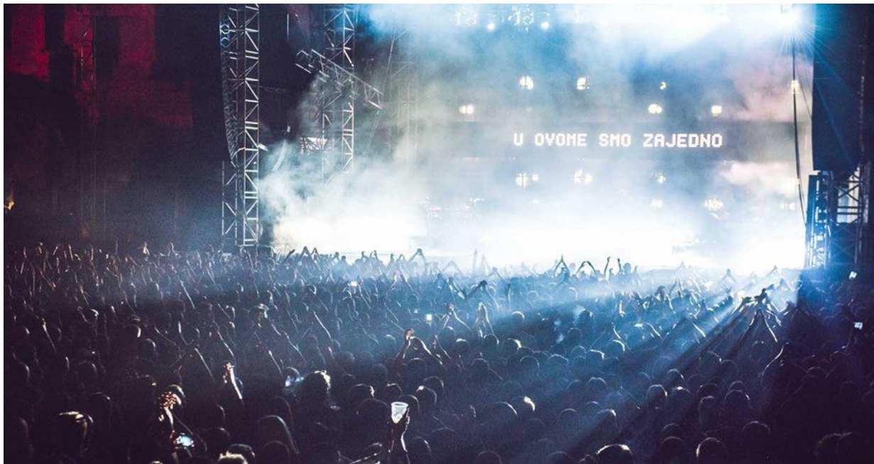
Slika 6. Dimensions Festival 2016. 23

manifestacije teško dostupne logistici današnje festivalske industrije. Zahvaljujući toj okolnosti festival je uspio stvoriti konkurentsku prednost, ali i prestižan imidž pred festivalima sličnog glazbenog izričaja.