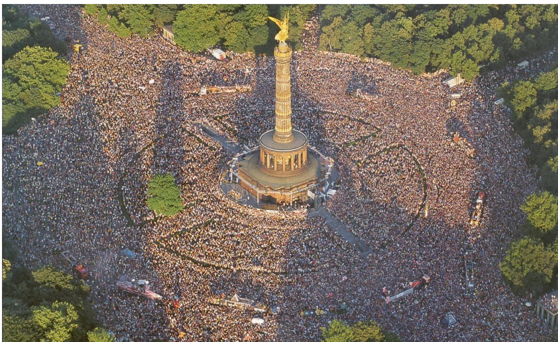
Slika 2. Love Parade Berlin 8

država u Europi, a drugi je “Mir, radost i palačinke”. Upravo tom parolom poslužio se njemački DJ Matthias Roeingh, poznatiji kao Dr. Motte, kada je sa svojom djevojkom Danielle de Picciotto u srpnju 1989. organizirao rođendansku zabavu za 150 ljudi na ulicama Zapadnog Berlina kao političku demonstraciju i poziv na međunarodno razumijevanje i toleranciju kroz ljubav i glazbu. Već sljedeće izdanje Parade Ljubavi okupilo je 2.000 posjetitelja pod glasnom parolom “Budućnost je naša”, a 1997. manifestacija je na ulice i trgove Berlina privukla preko milijun ljudi koji su u formi goleme karnevalske povorke u ritmovima techno, house i trance glazbe plesali do ranih jutarnjih sati šireći vibracije sve liberaliziranije društvene zajednice, oslobođene okova povijesti, postavljajući trendove i temelje urbane subkulture novim generacijama.