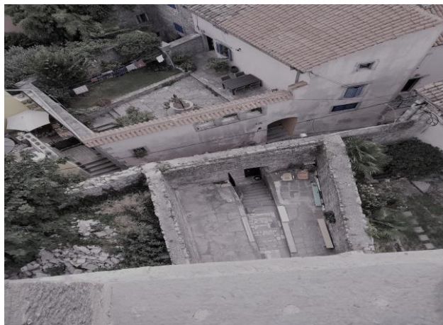
Ostaci crkve svetog Justa (pogled sa zvonika)