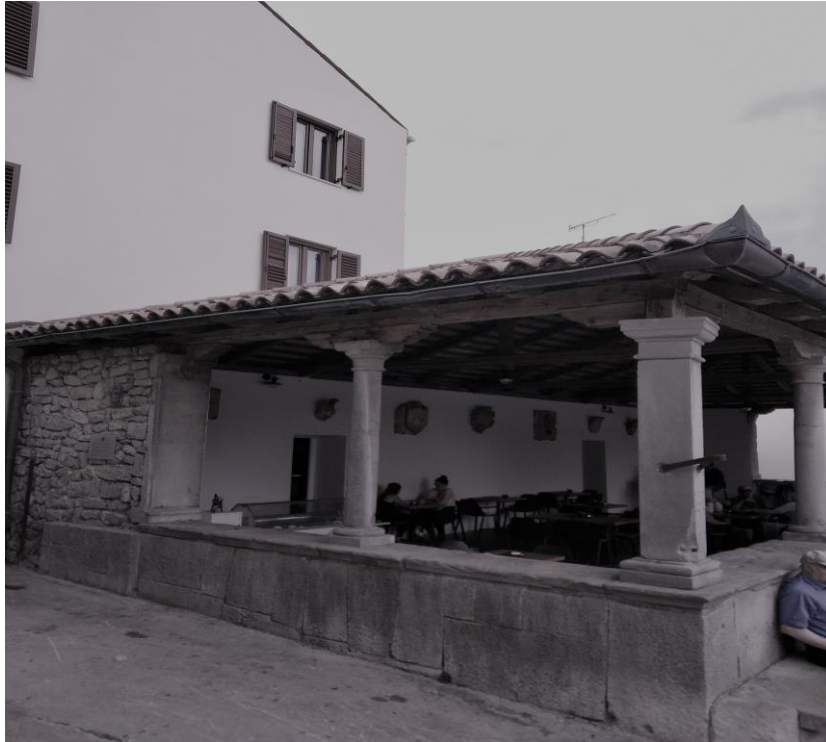
Izvor: vlastiti izvor (06. rujan, 2019.)