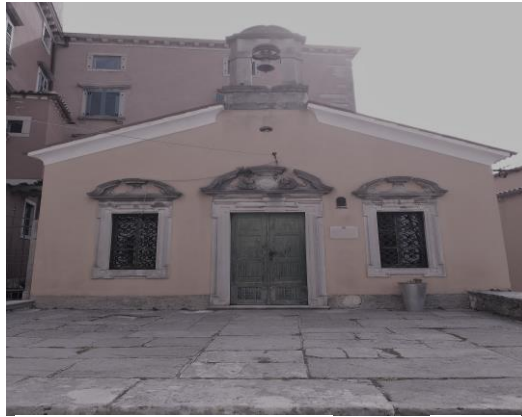
Izvor: vlastiti izvor (06. rujan, 2019.)