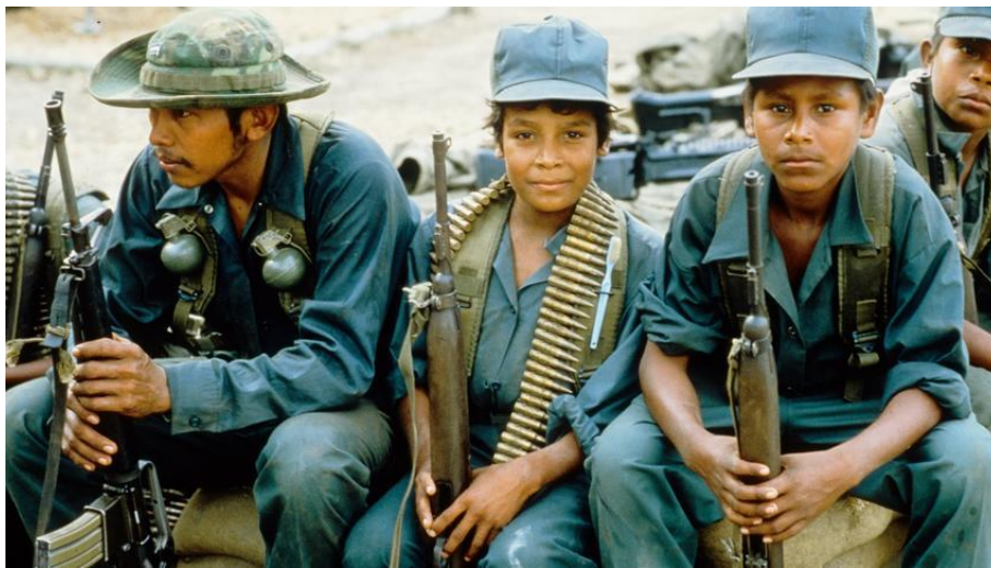
Slika 1. Isječak iz "Balade o malom vojniku"

indijanaca u pokušaju da pokrenu svoj program znanstvenog socijalizma. Film je bio okarakteriziran kao anti-sandinistička propaganda, usprkos Herzogovoj tvrdnji da se u Baladi o malome vojniku ne radi o politički intoniranom filmu. Herzog akcent stavlja na tragediju koja bi se mogla dogoditi u bilo kojoj zemlji: tragediju dječaka koji idu u rat s oružjem stavljenim u njihove ruke i bez njihova shvaćanja u čemu zapravo sudjeluju. U njegovim dokumentarcima je, kao što je ranije navedeno u radu, autorski glas toliko snažan da je postalo vrlo teško razaznati "činjenice" date situacije, što je rezultiralo mnogim kritikama zbog zabrinutosti za povijesnu točnost i politički sadržaj.