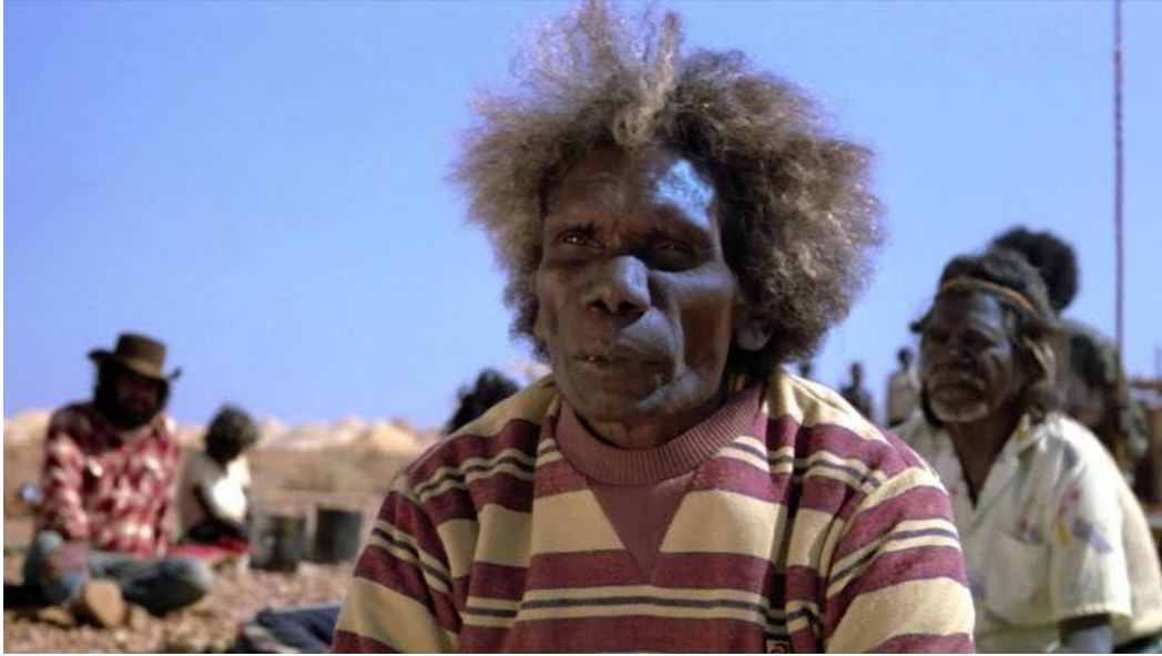
Slika 7. Insert iz filma Gdje sanjaju zeleni mravi