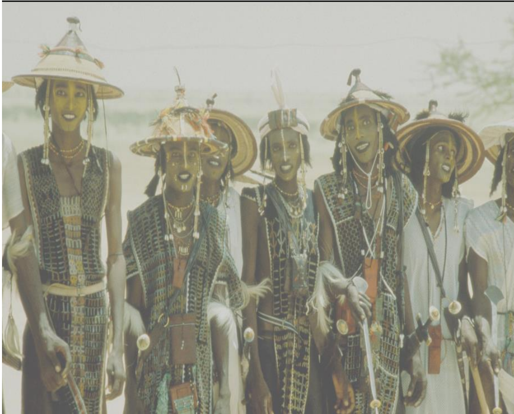
Slika 4. Wodaabe