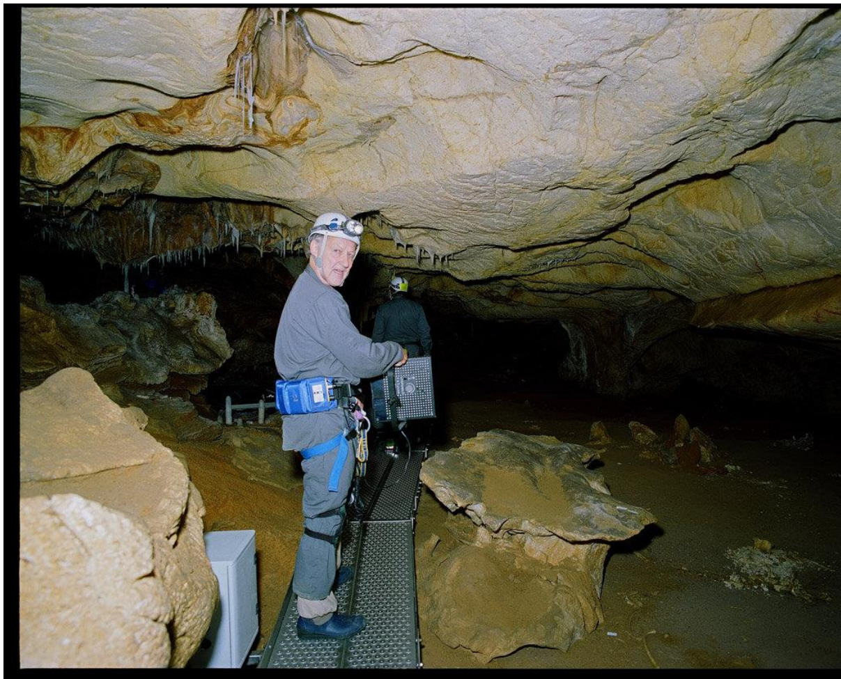
Slika 6. Herzog u spilji Chauvet za vrijeme snimanja Spilje zaboravljenih snova