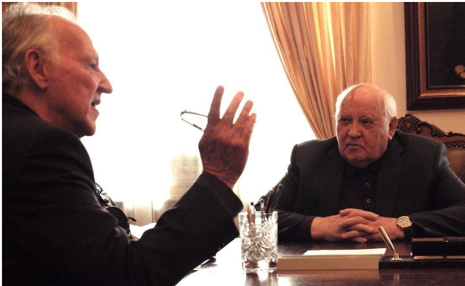
Slika 8. Herzog "danas" s posljednjim predsjednikom SSSR-a, Mihailom Gorbačovim