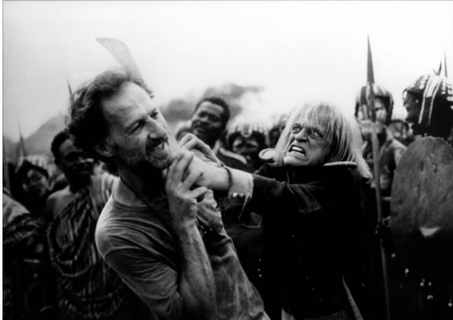
Slika 2. Werner Herzog i Klaus Kinski