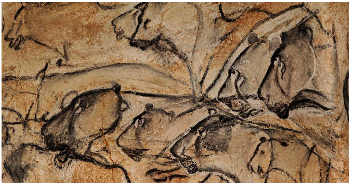
Slika 5. Crteži is spilje Chauvet Pont d'Arc