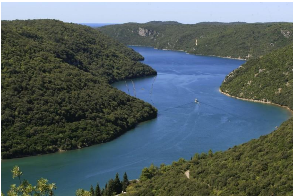
Slika 11. Limski zaljev