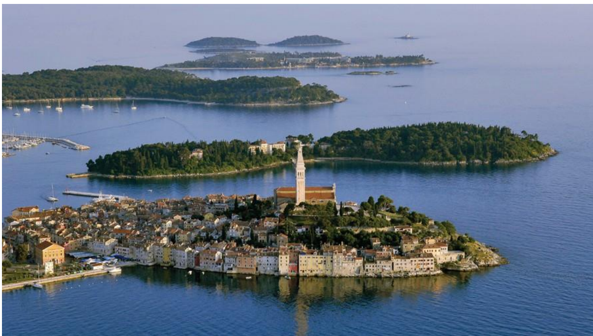
Slika 12. Rovinjski otoci