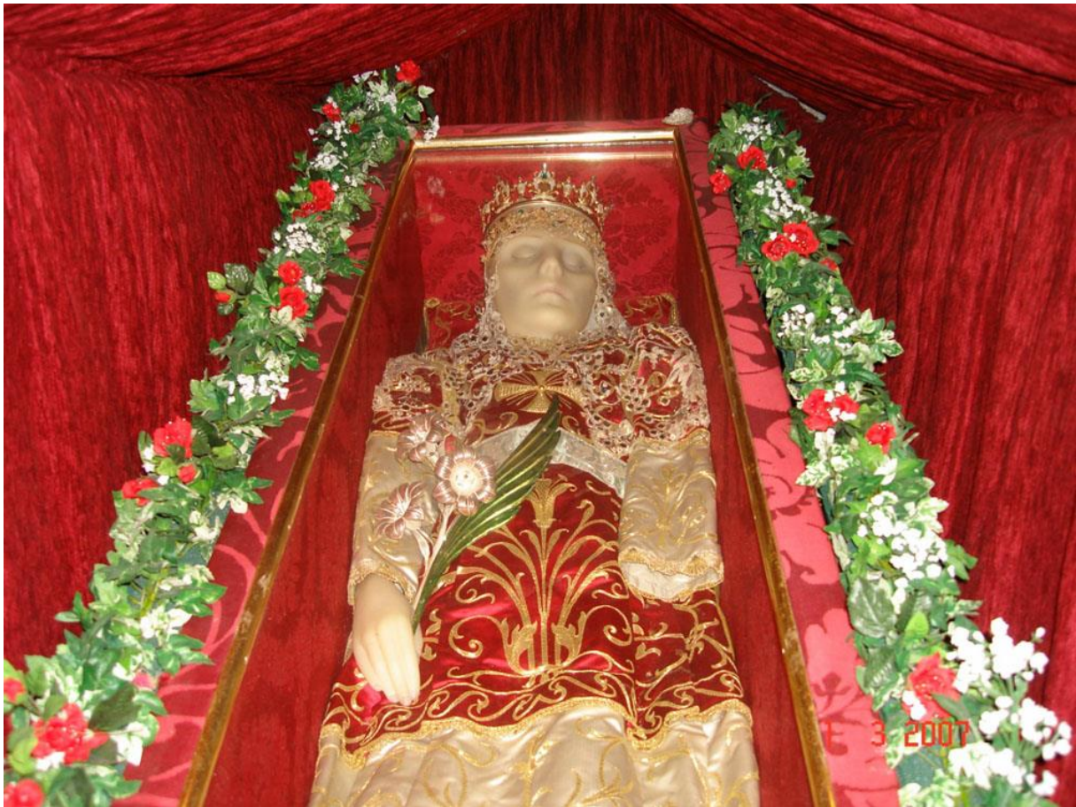
Slika 7. Liturgijsko ruho iz crkve sv. Jurja i sv. Eufemije