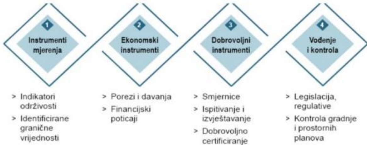
Slika 2. Instrumenti za implementaciju održivog razvoja turizma