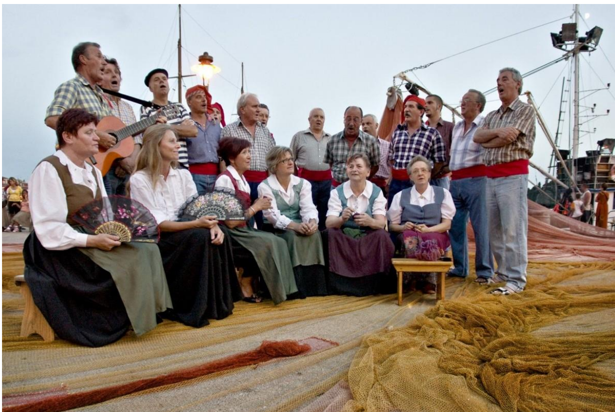
Slika 9. Rovinjska bitinada

Izvor: https://www.rovinj-tourism.com/hr/explore-discover/obicaji-i-tradicija/batane-i-bitinade# , 15.8.2019.