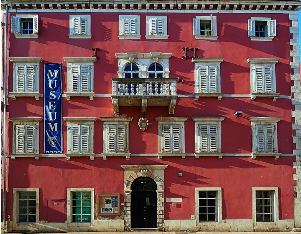
Slika 4. Zavičajni muzej Rovinj

U ovome potpoglavlju ilustracijama će biti prikazana materijalna kulturna baština Rovinja i ispod svake ilustracije bit će rečene posebnosti određene kulturne baštine.