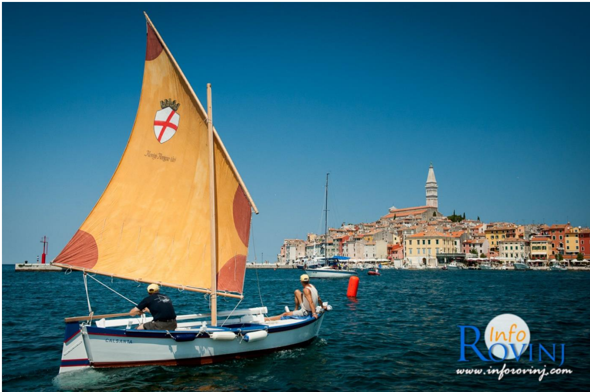
Slika 8. Umijeće izgradnje rovinjske batane