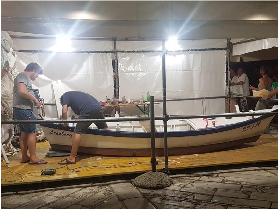
Slika 13. Izgradnja rovinjske batane

otvoren je spacio, riječ je o večerama na koje idu ribari i poljoprivrednici sa svojim batanama. Na večerama se jede riba koja se ulovi s batanama, te se kuša ostala rovinjska gastronomija, koriste jezik i dijalekt ali i svira narodna glazba. Spacio se održava nekoliko puta tjedno, ovisi o potražnji. U ljetnim mjesecima također se održava i regata glavnog jedra, događaj na kojemu se okupe sve brodice slične batanama s istom tipologijom jedra koje turisti mogu razgledati. Osim toga, za upoznavanje s tradicijom batane se animiraju, prave se mnoge radionice s djecom u vrtiću i školama, te se izrađuju makete.