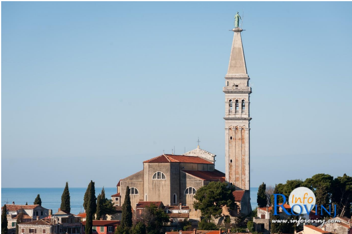
Slika 6. Crkva sv. Eufemije