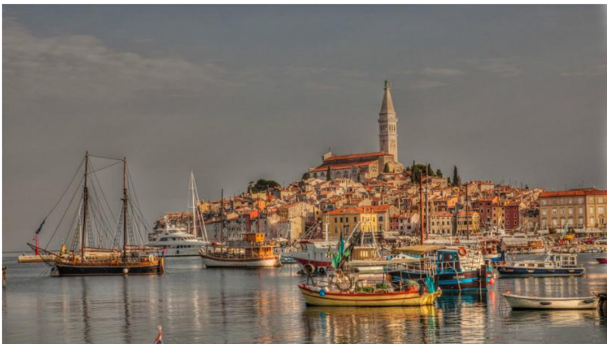
Slika 5. Starogradska jezgra Rovinja