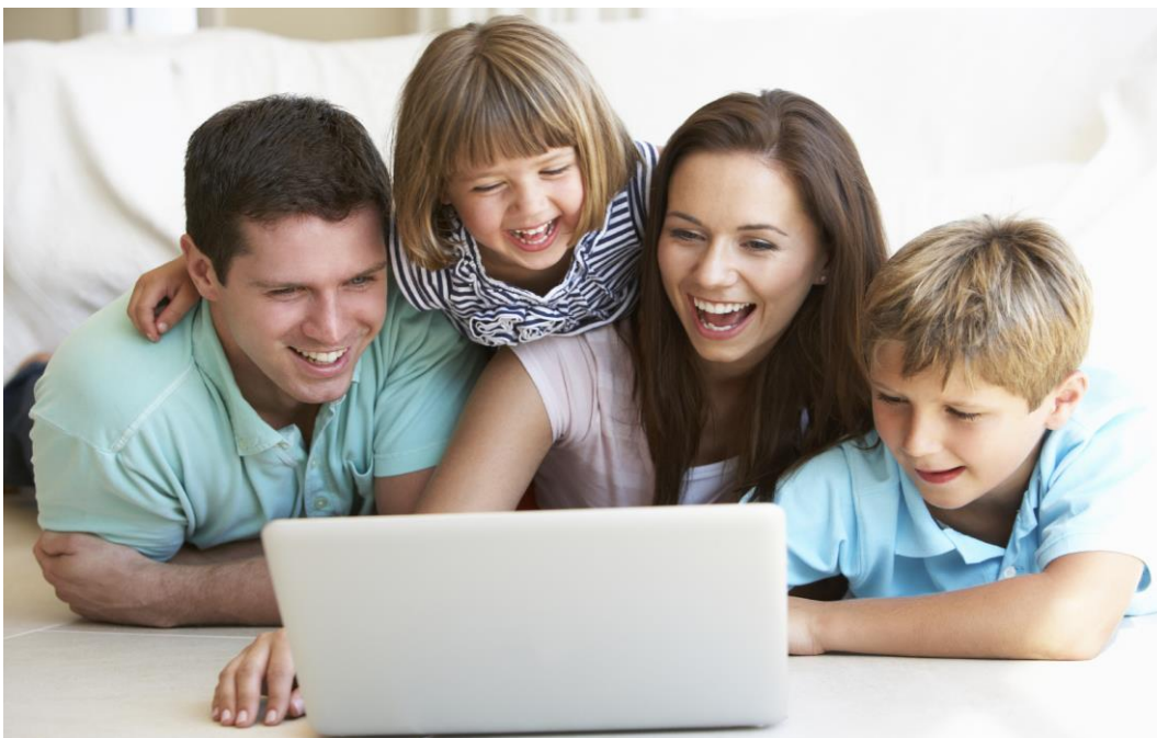
Slika 5: Roditelji moraju aktivno sudjelovati u djetetovom upoznavanju sa računalom