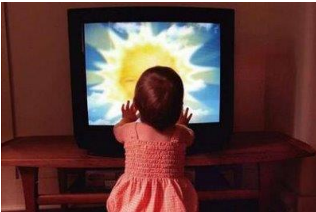
Slika 4: Dijete pred televizorom