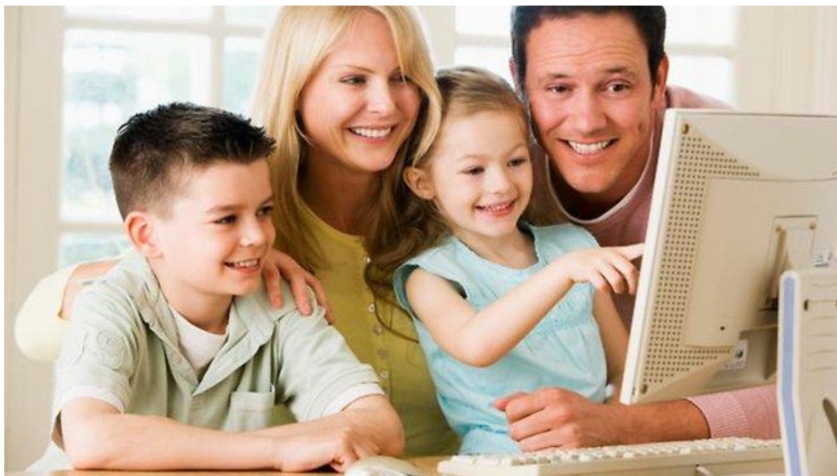
Slika 1: Djeca i roditelji u zajedničkoj igri na računalu