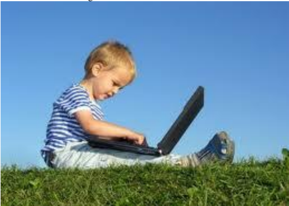
Slika 3: Prema postojećim podacima djeca se najčešće zainteresiraju za rad na računalu u dobi od 3-6 godina