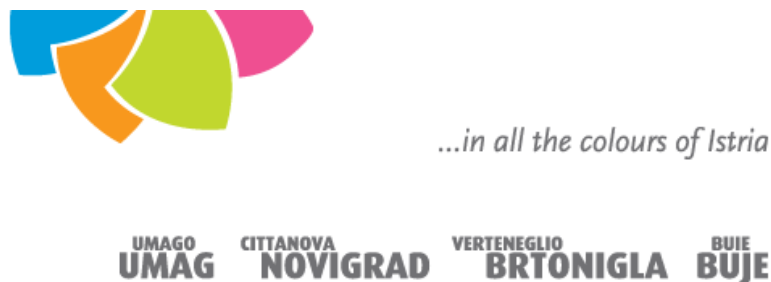
Slika 1. Brend klastera sjeverozapadne Istre