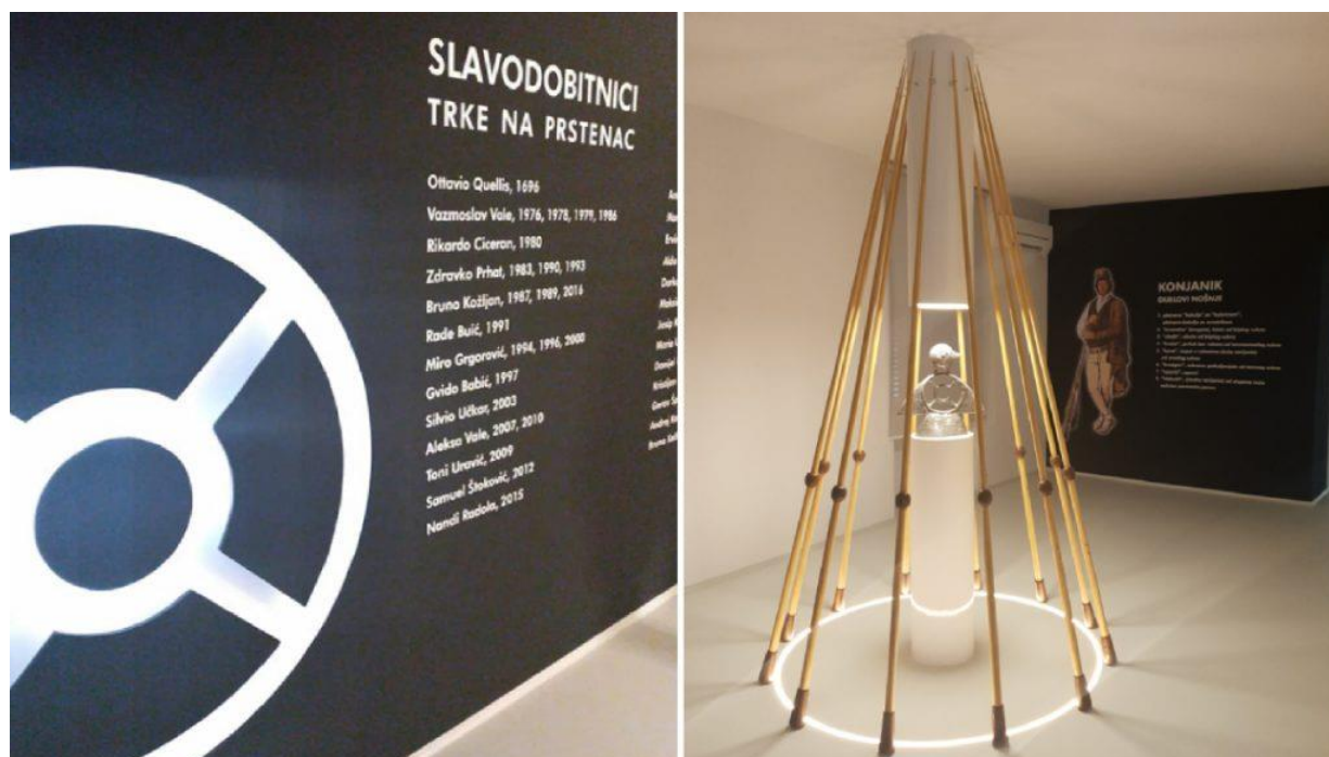
Slika 10. Mala dvorana Centra trke na prstenac