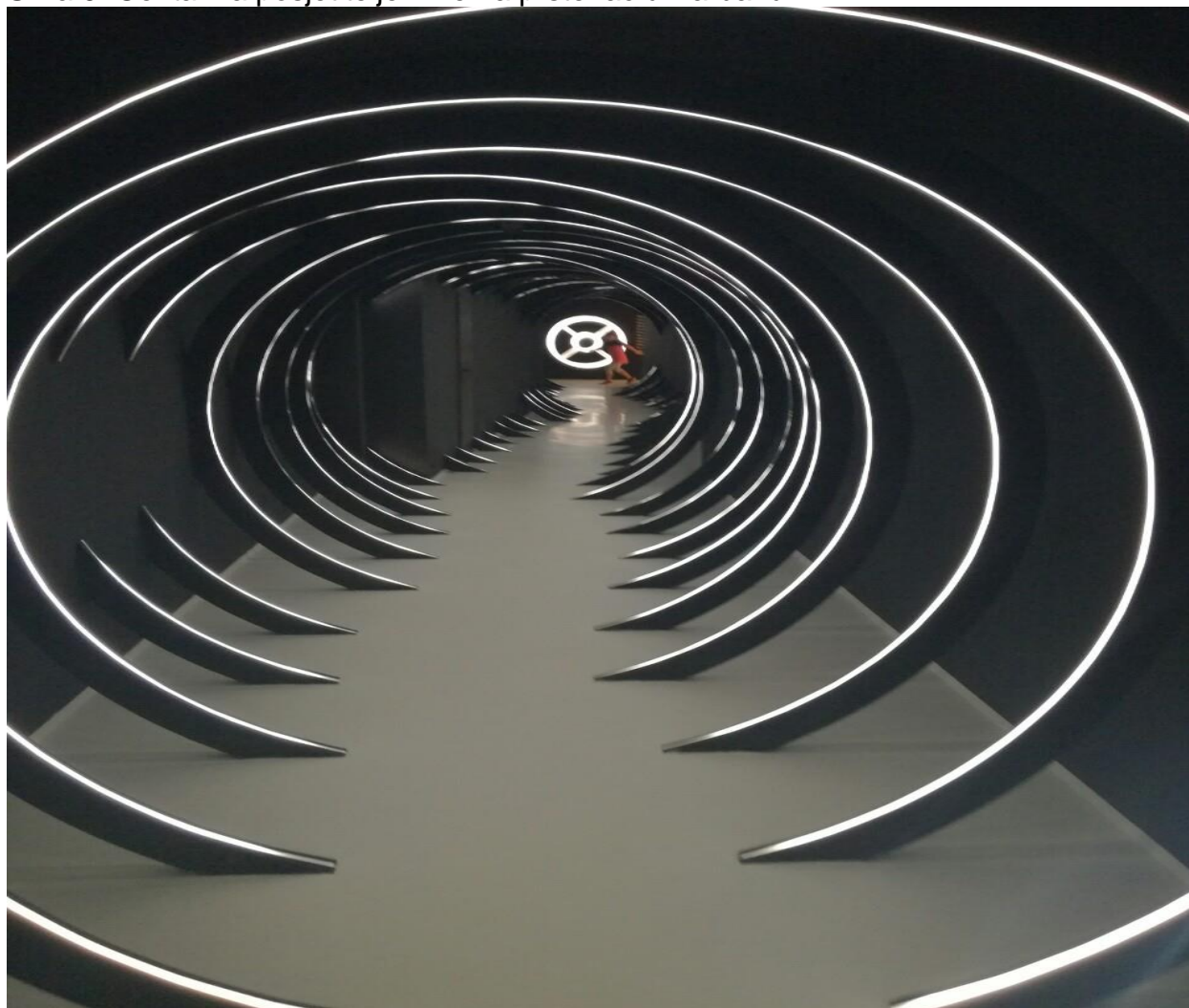
Slika 9. Centar za posjetitelje Trke na prstenac u Barbanu