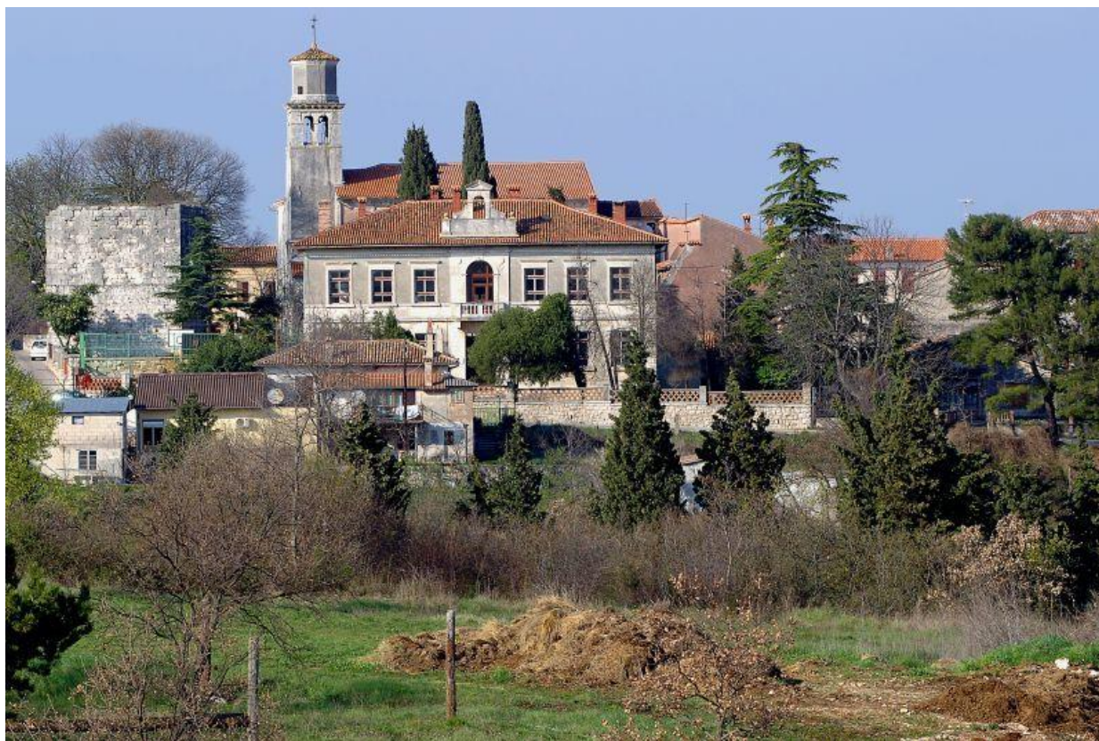
Slika 3. Barban

Barban (slika 3.) naselje je akropolskog tipa u Istri i istoimena općina 28 km sjeveroistočno od grada Pule. Smješten je iznad doline rijeke Raše, na cesti Pula – Labin – Rijeka, a u naselju živi oko 250 stanovnika. „Prema nekim dokumentarnim izvorima, spisima čiju je pouzdanost teško posve objektivno procijeniti, Barban se prvi put spominje 740. godine u jednoj crkvenoj ispravi napisanoj u povodu osnutka župe Barban“ (Buršić – Matijašić i Matijašić, 2006., str. 23.).