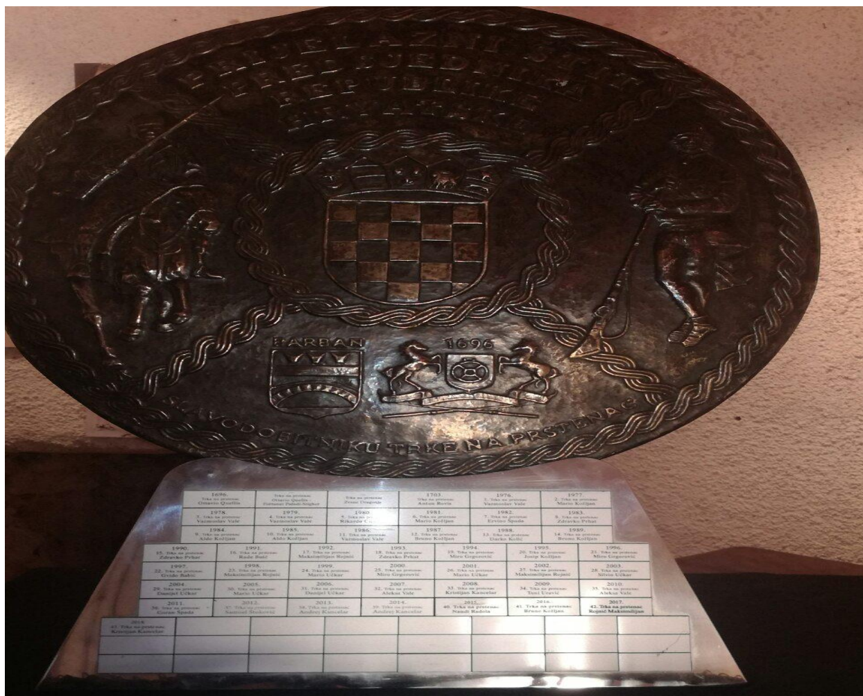
Slika 5. Štit Trke na prstenac

Izvor: Deniza Šverko, slikano u Žminjskoj kuli, izložba posvećena ovogodišnjem slavodobitniku Petru Benčiću, 2019.