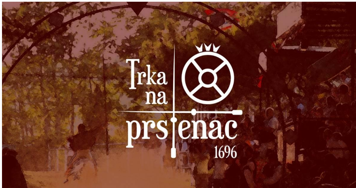
Slika 1. Trka na prstenac 1696.