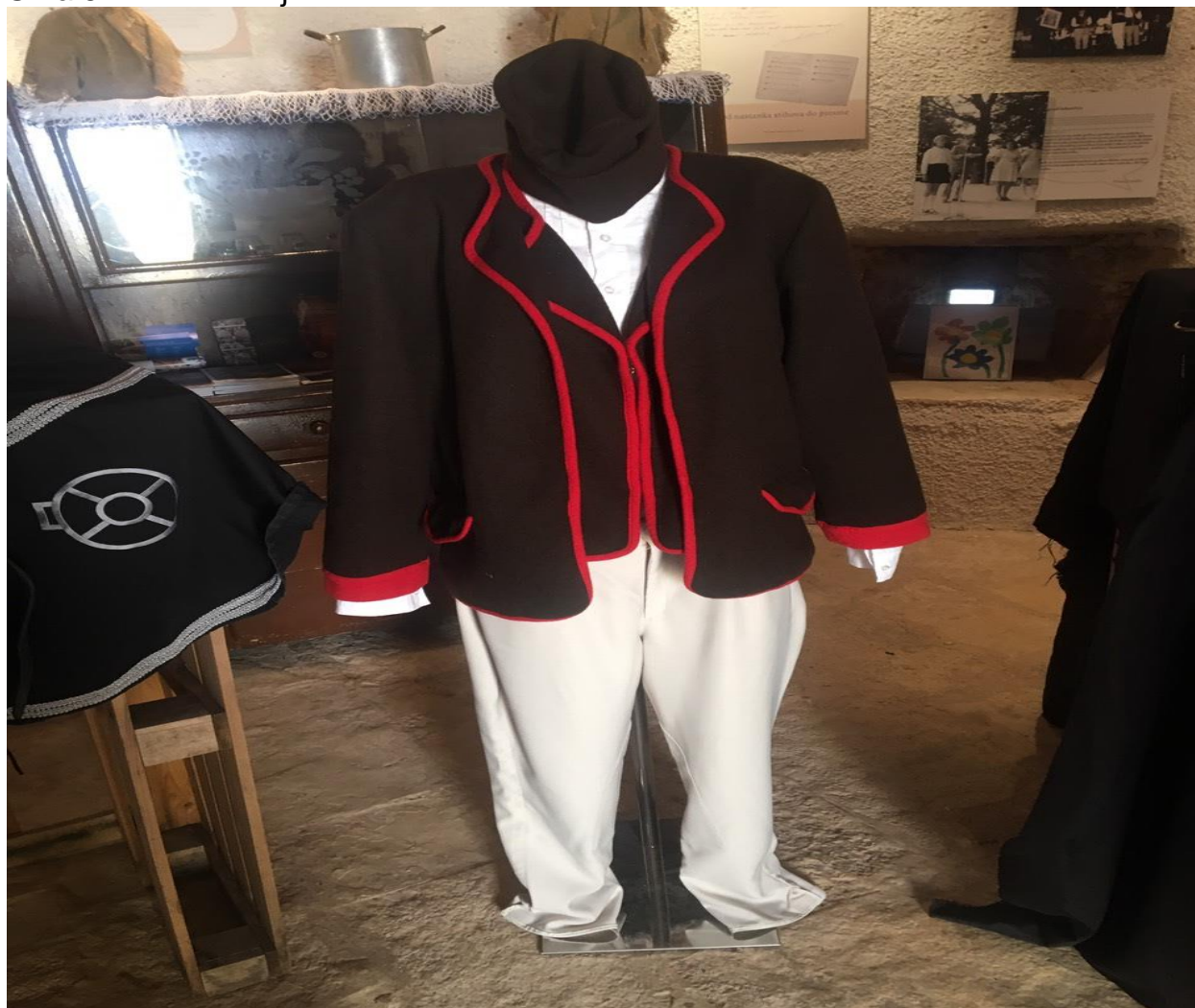
Slika 8. Muška nošnja