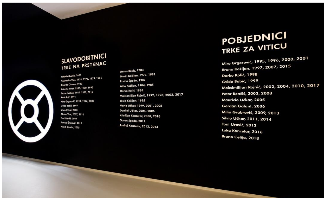
Slika 4. Slavodobitnici Trke na prstenac i Trke za viticu