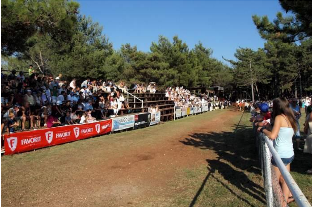
Slika 6. Pogled na trkalište

gledatelje. S jedne strane se nalazi svečana loža za visoke dužnosnike i tribine za ostale uzvanike, dok je s druge strane slobodni prostor za gledatelje (slika 6.).