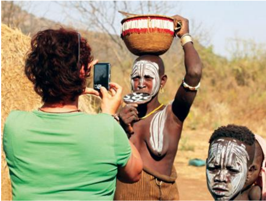
Slika 1. Isječak iz filma – fotografiranje domorotkinje