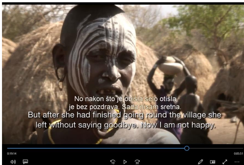
Slika 3. Percepcija interakcije od strane turista