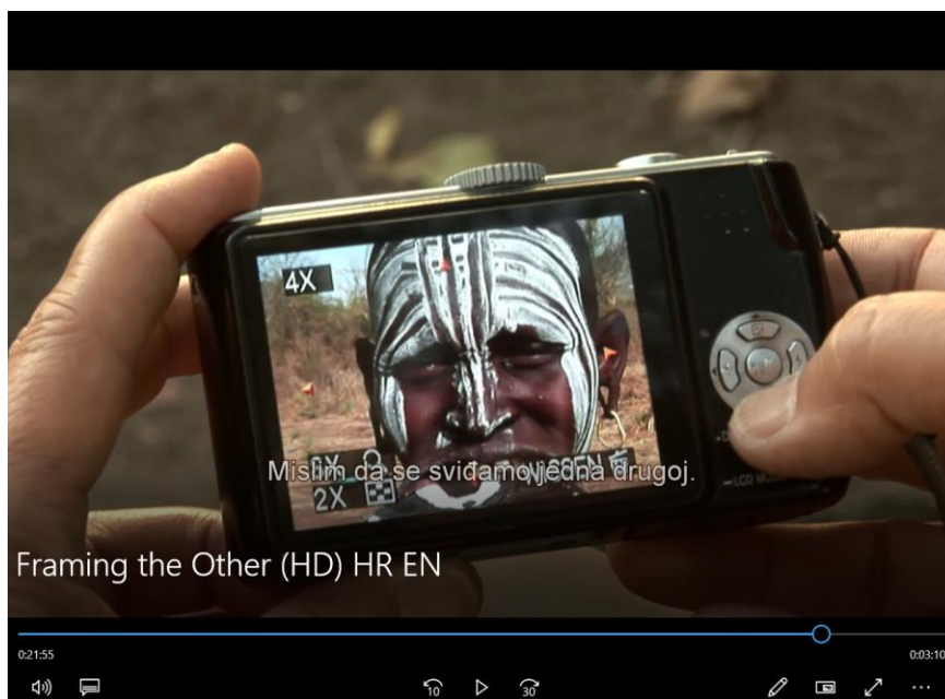
Slika 4. Percepcija interakcije od strane domorotkinje

Iz Slike 3 i Slike 4 vidimo kako rezultati interakcije podijeljeni i suprotni s obje strane.