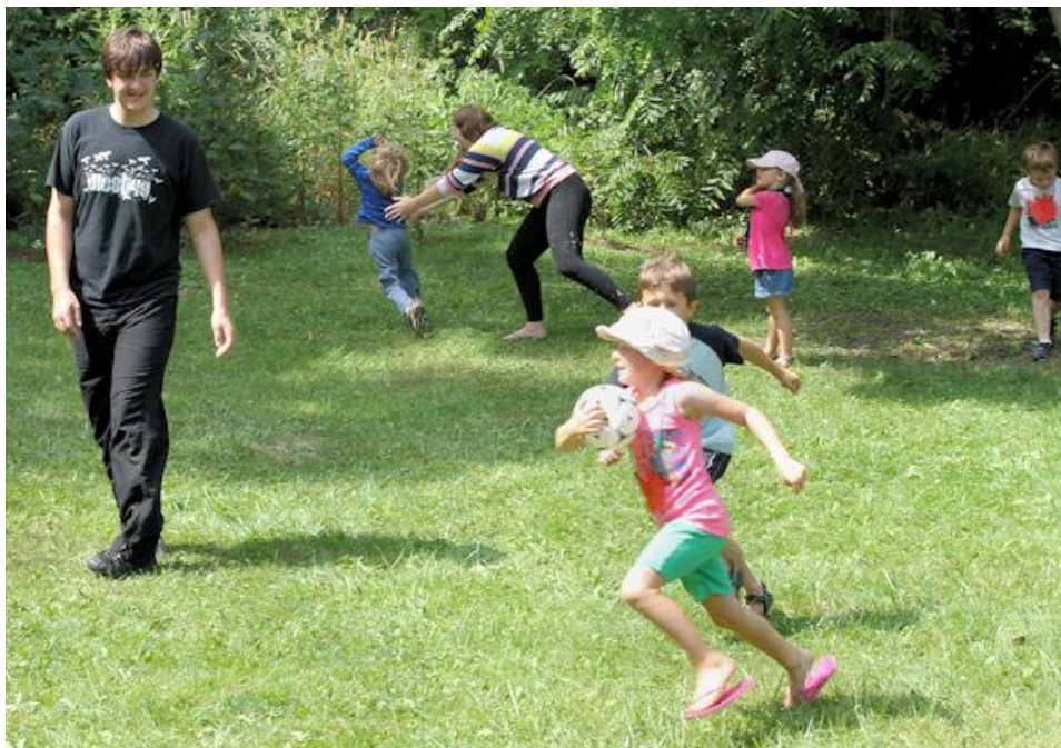
Slika 15. Uvodni dio sata tjelesne i zdravstvene kulture

Sadržaji uvodnog dijela sata moraju omogućiti jednostavno i adekvatno ostvarivanje zadataka toga dijela sata te moraju biti zanimljivi i primjereni. Sadržaji mogu biti: različiti oblici trčanja, elementarne igre ili jednostavnije momčadske igre. Motorička gibanja u ovom dijelu sata moraju biti jednostavna i djeci razumljiva. Voditelj treba paziti da fiziološki napor poveća samo onoliko koliko je potrebno da se organizam pripremi za drugi dio sata. Sat započinje okupljanjem djece ispred odgojitelja. Najbolje je sat započeti prikladnim pozdravom.