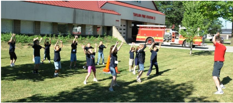
Slika 6. Jutarnje vježbanje djece predškolske dobi