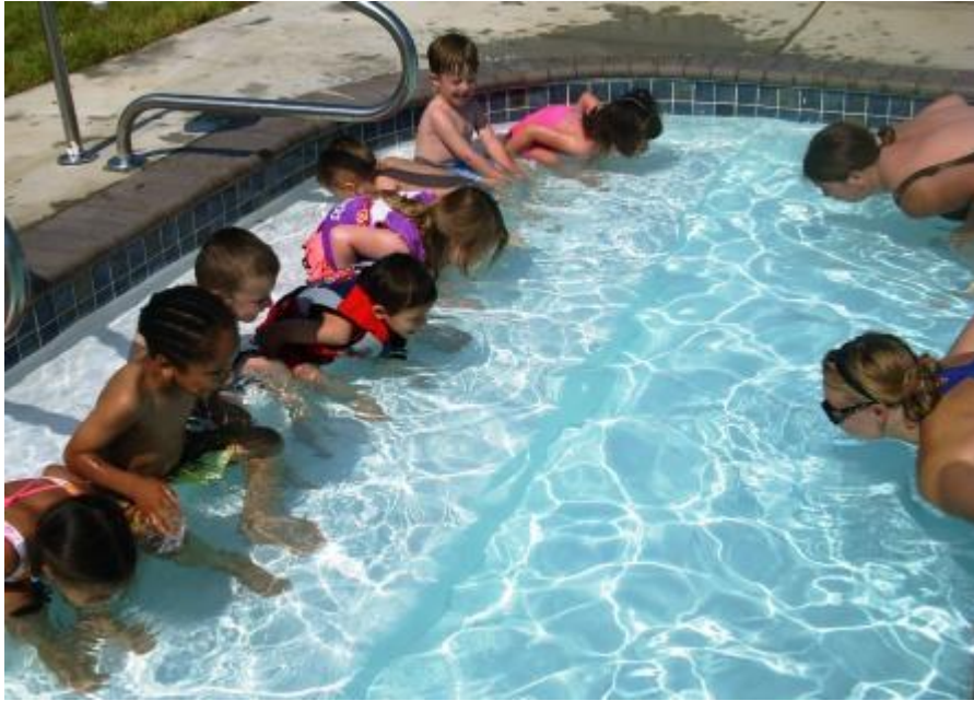
Slika 14. Ljetovanje

Sadržaji na ljetovanju odvijaju se u prirodi, uz vodu ili u vodi. Sadržaji na otvorenim površinama te u prirodi mogu biti prirodni oblici kretanja, igre, rekreativne aktivnosti, različita natjecanja, šetnje, izleti. Sadržaje koje možemo provoditi u vodi i uz vodu su sljedeći: prirodni oblici kretanja, igre u vodi te obuka neplivača. Obuka neplivača vrlo je važna te se sastoji od sljedećih dijelova: vježbe za navikavanje na vodu, vježbe disanja, vježbe ronjenja, vježbe gledanja u vodi, vježbe plutanja, vježbe klizanja, vježbe kretanja u vodi, vježbe za usavršavanje plivanja, plivanje.