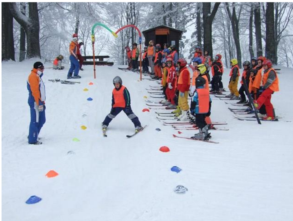
Slika 13. Zimovanje