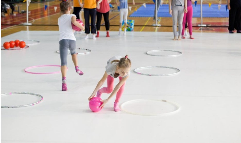
Slika 18. Glavni B dio sata tjelesne i zdravstvene kulture: štafetna igra