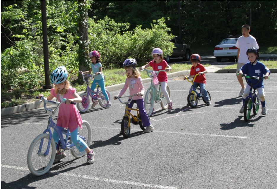
Slika 5. Tematsko vježbanje djece predškolske dobi

dječja zainteresiranost i mogućnost provedbe zadatka određuju koliko će aktivnost trajati. U mlađoj dobnoj skupini tematsko vježbanje traje 5 – 7 minuta, dok u starijoj dobnoj skupini može trajati i 20 – 30 minuta. Ukoliko u mlađoj dobnoj skupini spojimo nekoliko tematskih zadataka djecu postepeno uvodimo u „sat“ igre.