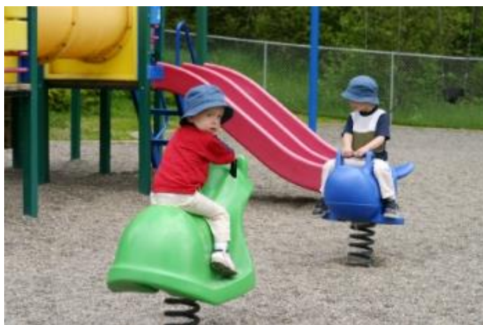
Slika 4. Spontano vježbanje djece predškolske dobi

Spontano vježbanje podrazumijeva neplanirane tjelovježbene aktivnosti djece koje djeca provode samoinicijativno i bez organizacije voditelja. Djeca bez pitanja započinju s nekom aktivnošću i isto tako nakon što im ta aktivnost dosadi ili iz nekog drugog razloga prestanu s njom, djeca opet bez pitanja prestaju s aktivnošću i započinju raditi nešto drugo. Tijekom spontanog vježbanja voditelj prati djecu s ciljem čuvanja. Ukoliko je moguće, djeci je potrebno omogućiti provođenje spontanih tjelovježbenih aktivnosti više puta dnevno jer na taj način djeca usavršavaju biotička motorička znanja i motoričke sposobnosti.