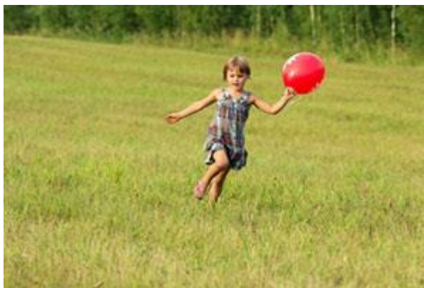
Slika 7. Nekonvencionalna aktivnost: trčanje za balonom