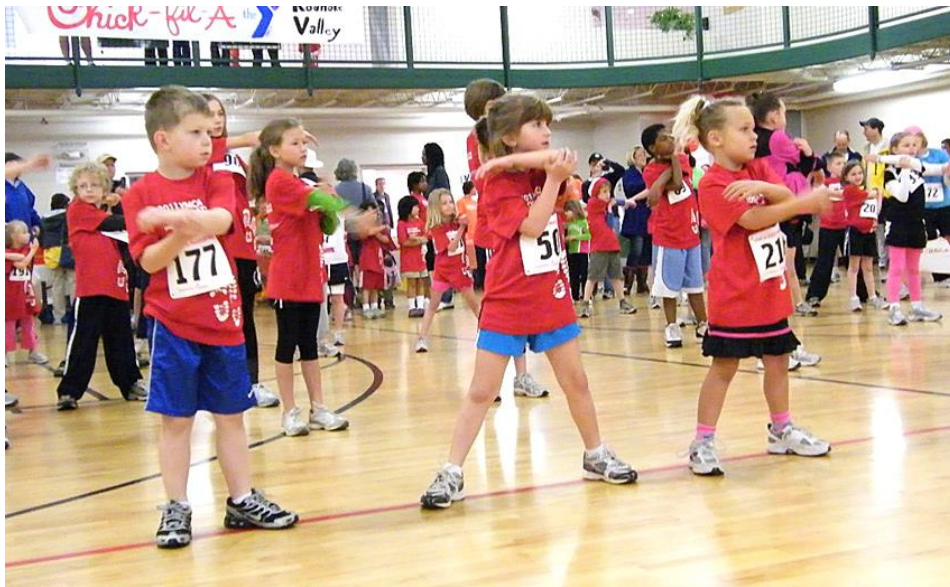
Slika 16. Pripremni dio sata tjelesne i zdravstvene kulture: opće pripremne vježbe