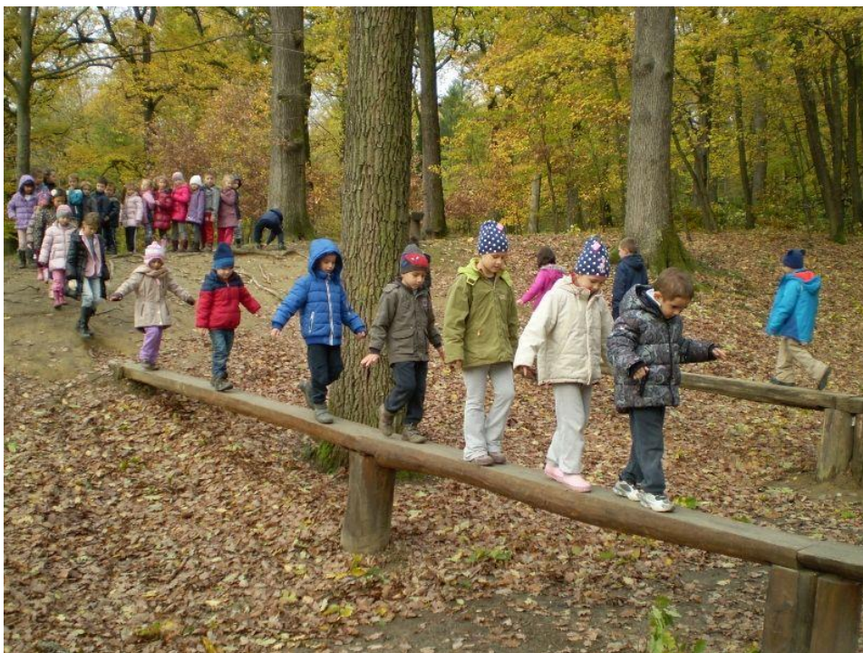
Slika 10. Šetnja šumom s djecom predškolske dobi

Šetnja je vrijeme koje dijete provede hodajući na zraku. Preporučljivo je šetati s djecom svaki dan, tj. kad god to atmosferske prilike dopuštaju. Nakon što odgojitelji definiraju cilj šetnje, određuju se zadaće šetnje, put, dužina, sadržaj te trajanje šetnje. Djecu je potrebno pripremiti za šetnju, a prije polaska odgojitelj još jednom mora pregledati odjeću i obuću djece. Što su djeca mlađa, put i trajanje šetnje moraju biti kraći. Ukoliko s djecom šćemo po naseljenom mjestu, najbolje je da djeca idu u paru. Izuzetno je važno da tijekom cijele šetnje odgojitelj ima svu djecu u vidnom polju. Također, odgojitelj cijelo vrijeme mora održavati kontakt s djecom te usmjeravati njihovu pažnju na cilj promatranja. Ako je moguće, dobro je da se djeca u vrtić vraćaju drugim putem. U šetnju se ide prijedodne, a u vrtić se vraća neposredno prije ručka. Po povratku u vrtić potrebno je očistiti obuću i odjeću, oprati ruke te se pripremiti za daljnje aktivnosti. Djeca mlađe dobne skupine mogu hodati do 15 minuta bez pauze, djeca srednje dobne skupine do 20 minuta, a djeca starije dobne skupine mogu hodati 30 minuta. To su orijentacijske vrijednosti, a odgojitelj mora sam odlučiti o trajanju pješaćenja, odmoru te samom putu šetnje (Findak, 1995).