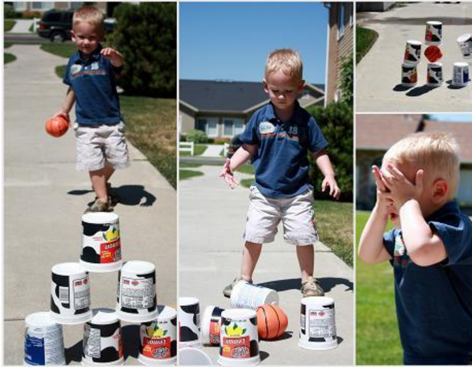
Slika 3. Kineziološka igra djeteta predškolske dobi