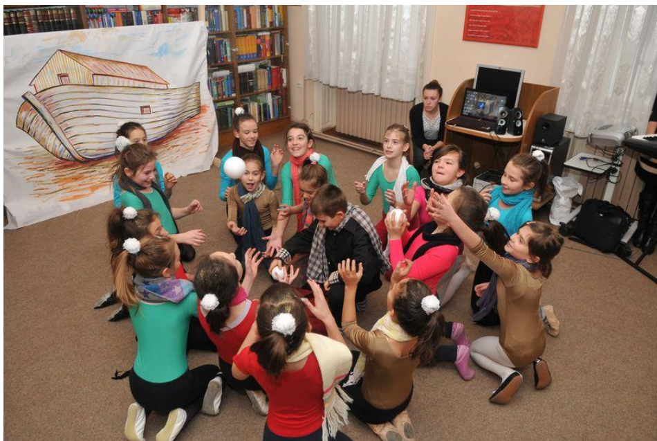
Slika 11. Priredba

Da bi djeca bila sigurnija u sebe dobro je prije samog nastupa „igrati se“ priredbe na način da dio djece bude u ulozi publike, a drugi dio djece u ulozi izvođača.