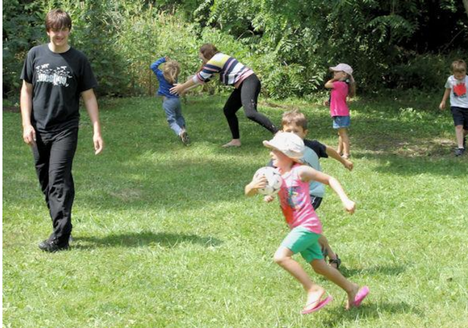
Slika 15. Uvodni dio sata tjelesne i zdravstvene kulture

Sadržaji uvodnog dijela sata moraju omogućiti jednostavno i adekvatno ostvarivanje zadataka toga dijela sata te moraju biti zanimljivi i primjereni. Sadržaji mogu biti: različiti oblici trčanja, elementarne igre ili jednostavnije momčadske igre. Motorička gibanja u ovom dijelu sata moraju biti jednostavna i djeci razumljiva. Voditelj treba paziti da fiziološki napor poveća samo onoliko koliko je potrebno da se organizam pripremi za drugi dio sata. Sat započinje okupljanjem djece ispred odgojitelja. Najbolje je sat započeti prikladnim pozdravom.