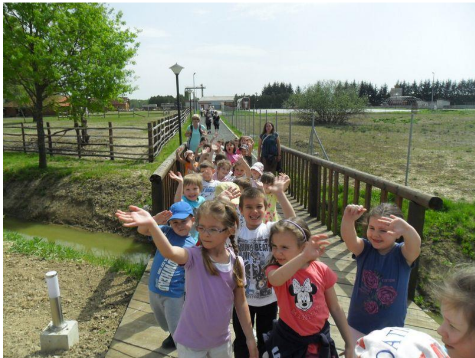
Slika 12. Djeca u prirodi; izlet

Izlet mora biti dobro isplaniran, pripremljen, organiziran i proveden. Da bi izlet bio uspješan, potrebno je odrediti cilj i zadaće izleta, a onda i program izleta. Isto tako, odgojitelji moraju dobiti suglasnost od roditelja te obaviti organizacijsko – tehničke pripreme (odrediti mjesto, pravac kretanja, utvrditi vrijeme i mjesto dolaska i polaska, mjesto okupljanja, način kretanja, program izleta, upute roditeljima vezane za pripremu djece, kontakt s roditeljima, izračunavanje troškova i drugo). Također, odgojitelj mora dogovoriti koliko i koji roditelji će pratiti djecu na izletu. Jedan od najvažnijih uvjeta izleta je da se krene na izlet i vrati s njega u dogovoreno vrijeme.