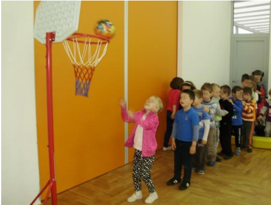
Slika 17. Glavni A dio sata tjelesne i zdravstvene kulture: ubacivanje lopte u koš

Neljak (2010) ističe kako je svrha ovog dijela sata učinkovita provedba programskih sadržaja s ciljem ostvarenja najznačajnijih obrazovnih, kinantropoloških i odgojnih zadaća sata tjelesne i zdravstvene kulture.