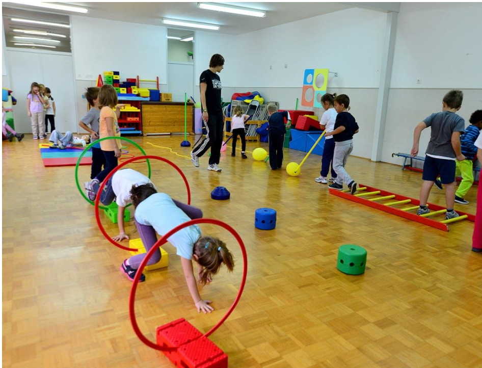
Slika 8. Sat tjelesne i zdravstvene kulture u predškolskoj ustanovi

Bitno je da voditelj pazi na pravilnost i skladnost izvođenja pokreta i to na način da tijekom vježbanja verbalnim uputama pokušava djecu usmjeriti na izvođenje aktivnosti na ispravan način.