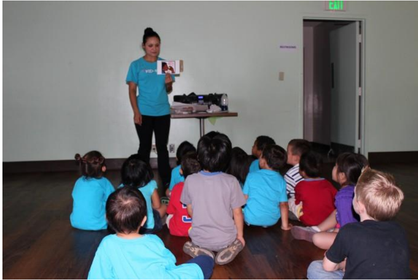
Slika 19. Završni dio sata: razgovor s djecom