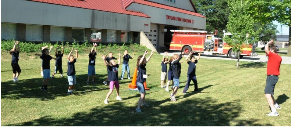
Slika 6. Jutarnje vježbanje djece predškolske dobi