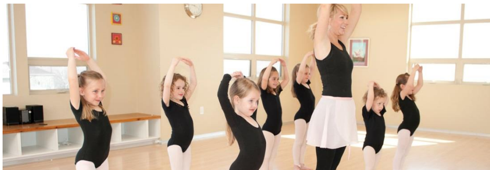
Slika 9. Sat sportskog vježbanja u sportskom klubu s djevojčicama

Sat sportskog vježbanja najčešće traje 60 ili 45 minuta i najčešće se provodi samo s djecom starije dobne skupine.