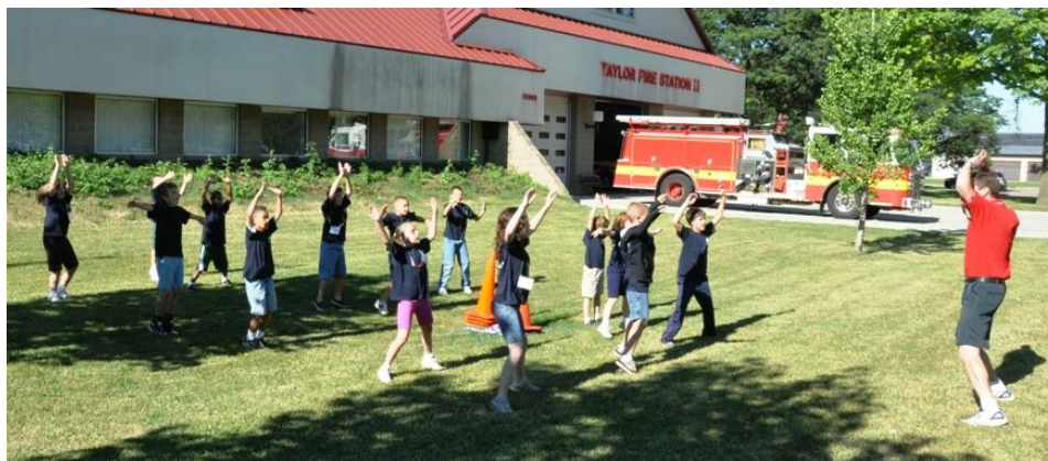
Slika 6. Jutarnje vježbanje djece predškolske dobi