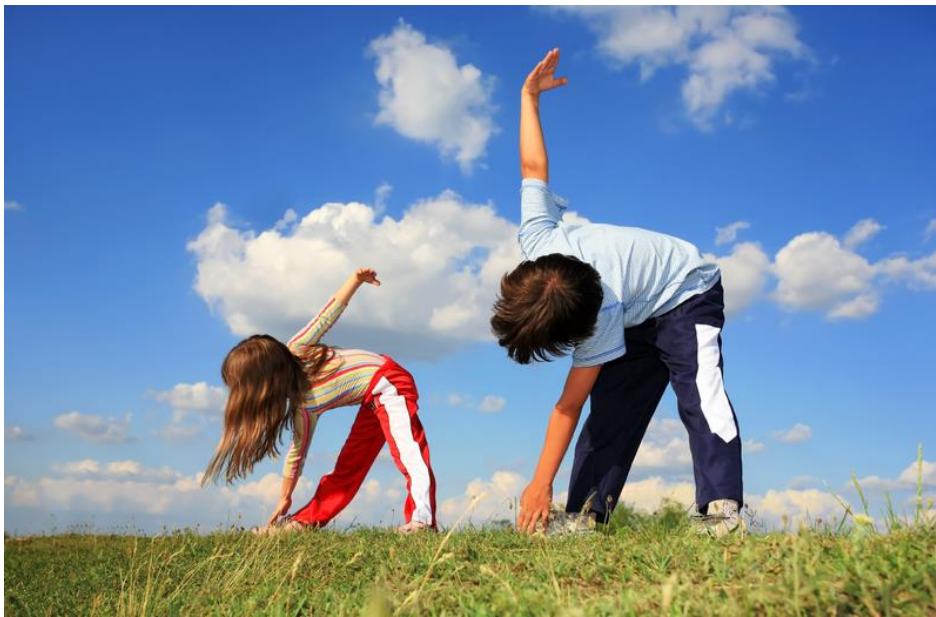
Slika 1. Djeca predškolske dobi vježbaju na otvorenom prostoru

Tjelesno vježbanje u predškolskoj dobi važno je zbog pravilnog rasta i razvoja djece. Pravilno tjelesno vježbanje utječe na poboljšanje te pravilno držanje tijela. Isto tako, tjelesnim vježbanjem moguće je prevenirati i neke kronične bolesti. Sve češći problem u cijelom svijetu je pretilost. Redovitim tjelesnim vježbanjem i ukazivanjem na pravilnu prehranu djecu možemo podučiti kako da se odupru toj bolesti. Mnogi autori ističu kako tjelesnim vježbanjem zadovoljavamo djetetovu potrebu za igrom i kretanjem, ali i učimo djecu upornosti, sportskom ponašanju, stvaramo poželjne navike (Pejčić, 2006). Vježbanjem dijete stječe samopouzdanje, poboljšava svoje sposobnosti te uči procjenjivati svoje mogućnosti i svoj napredak.