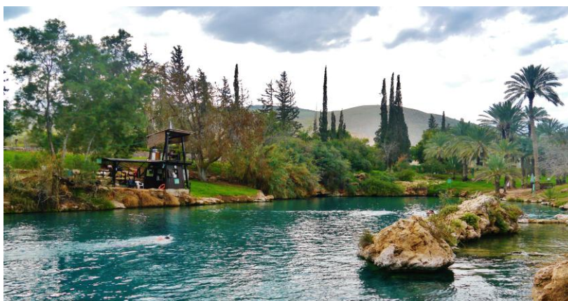
Slika 14. Nacionalni park Gan HaShlosha