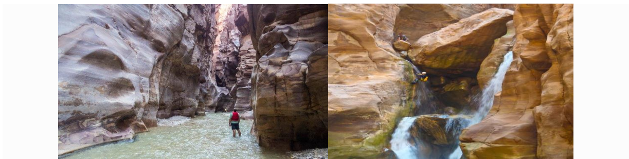
Slika 5. Kanjon Wadi na rijeci Mujib