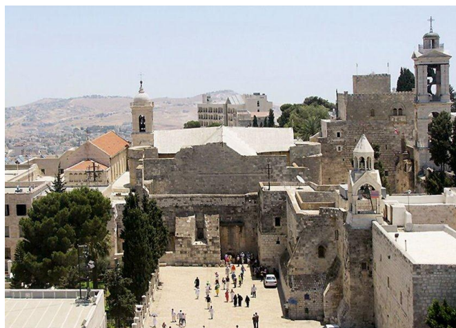
Slika 21. Betlehem