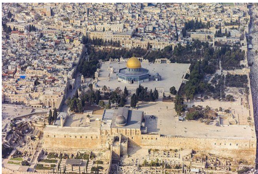
Slika 20. Jeruzalem