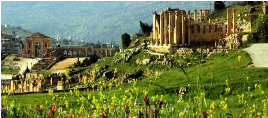
Slika 24. Prikaz rimskih ruševina u Jerashu