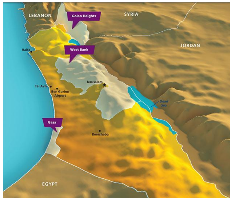
Slika 3. Reljefna karta Izraela