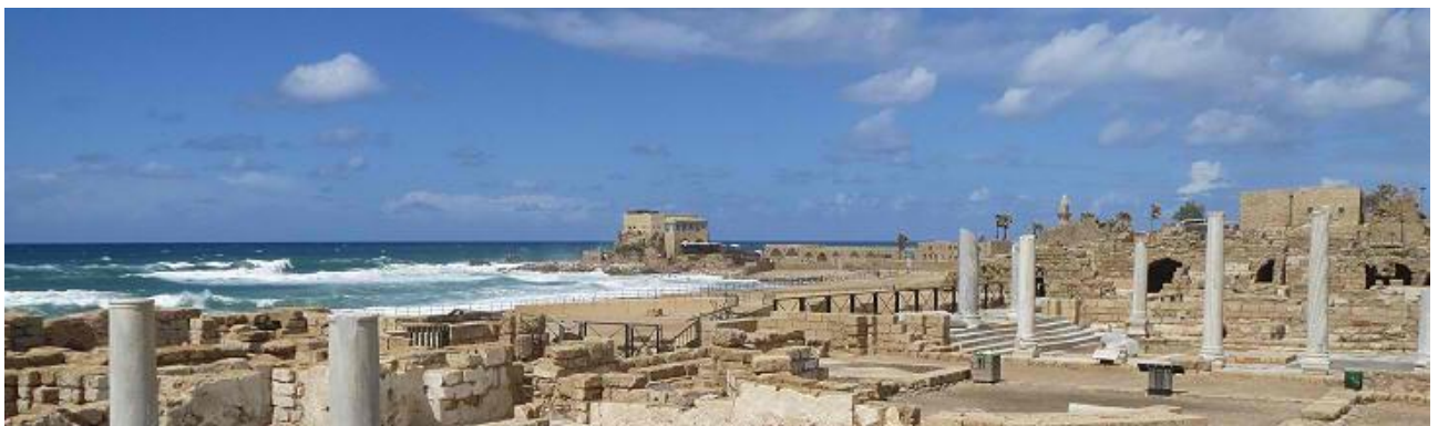
Slika 19. Cezareja