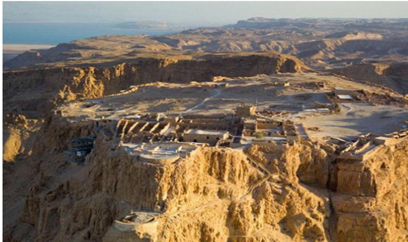
Slika 22. Masada