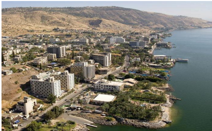
Slika 18. Tiberija