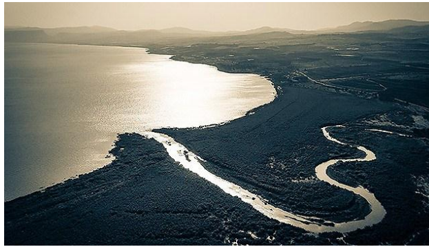
Slika 4. Ušće rijeke Jordan