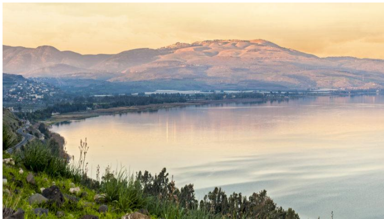
Slika 6. Galilejsko jezero