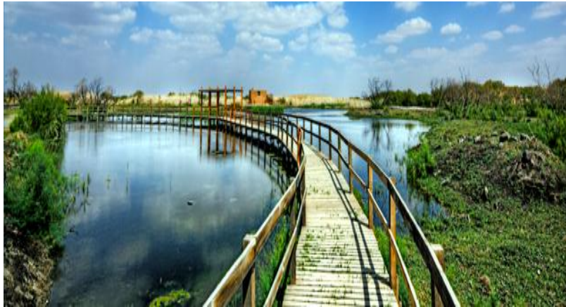
Slika 16. Most u rezervatu Al Azraq za promatranje ptica