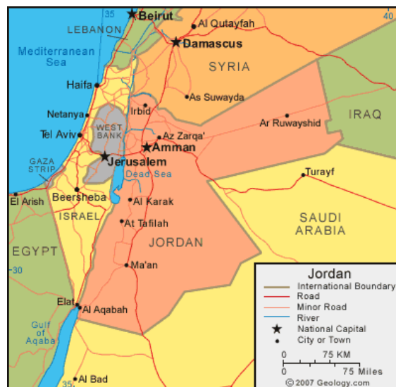
Slika 2. Geografski položaj Jordana