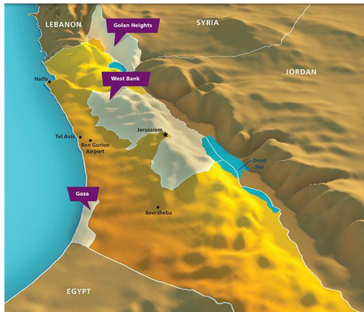
Slika 3. Reljefna karta Izraela