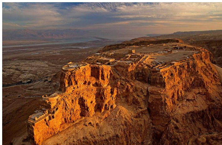
Slika 13. Nacionalni park Masada