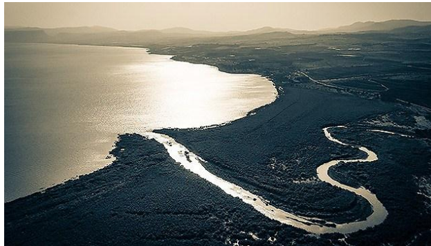
Slika 4. Ušće rijeke Jordan