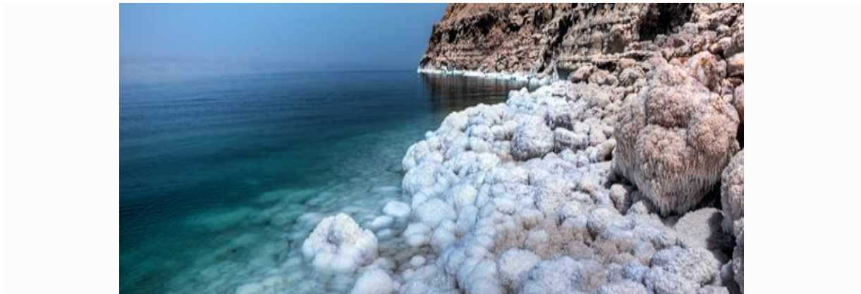
Slika 10. Obala Mrtvog mora