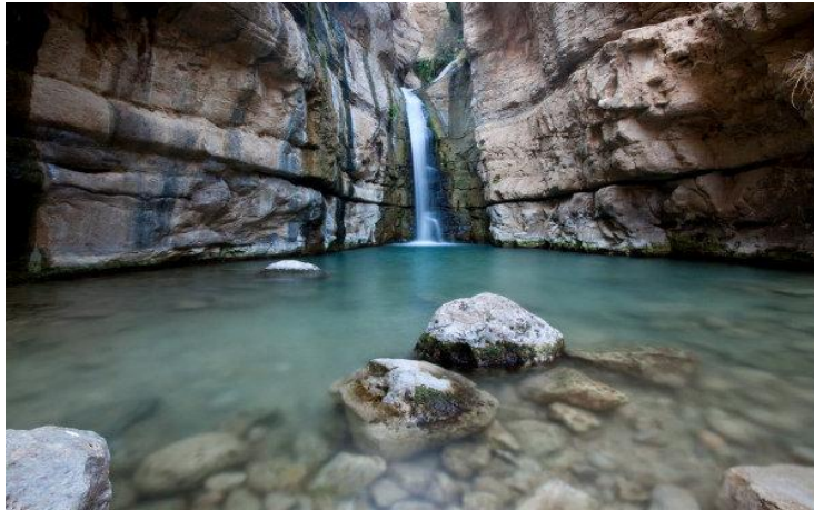
Slika 12. Nacionalni park Ein Gedi, slapovi na rijeci Ein Gedi