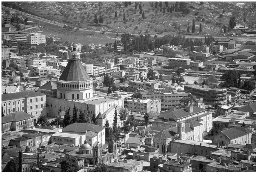
Slika 17. Nazaret