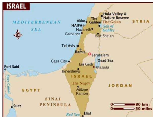
Slika 1. Geografski položaj Izraela i regije u Izraelu