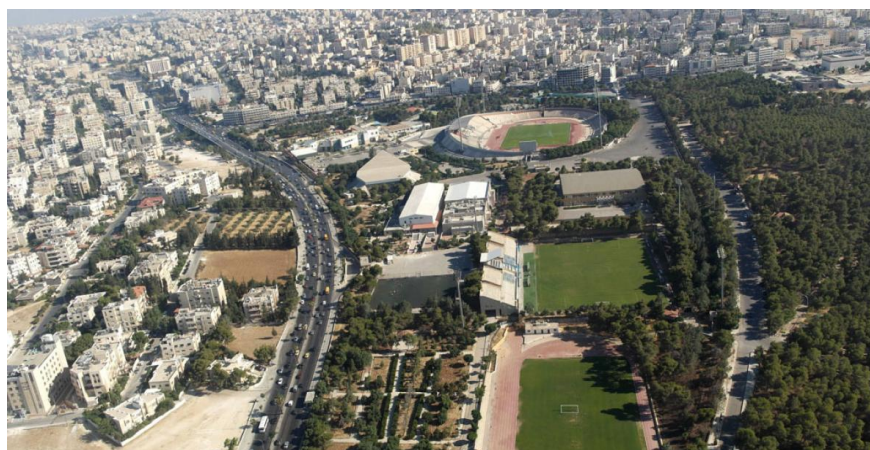
Slika 23. Prikaz glavnog grada Jordana – Amman