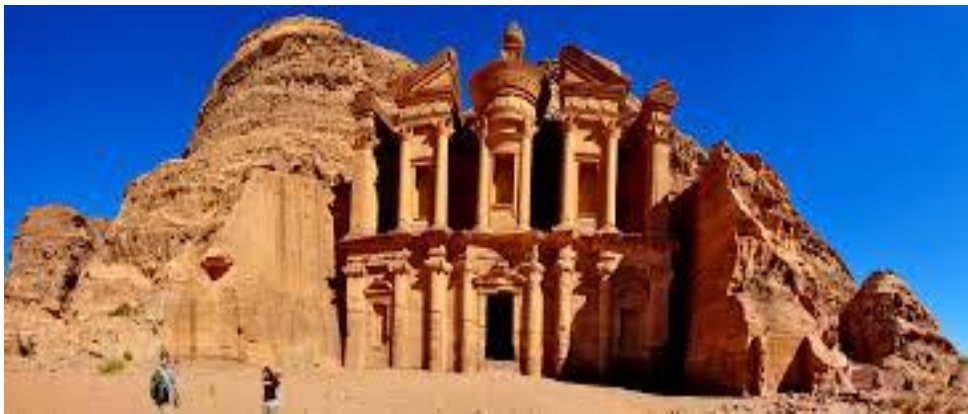
Slika 25. Prikaz Petre