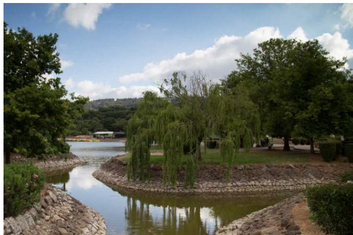
Slika 7. Jezero Agam Montfort