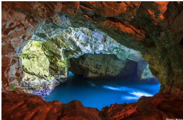
Slika 8. Jezero Rosh Hanikra