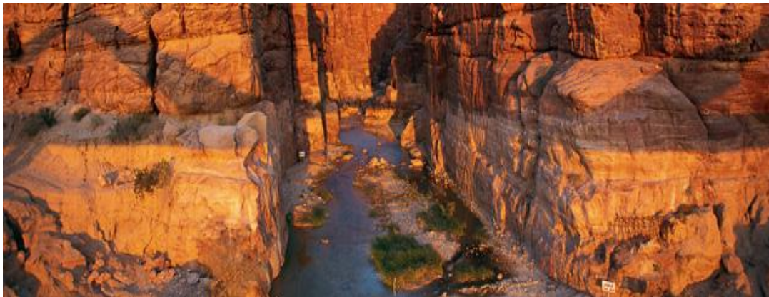
Slika 15. Rezervat biosfere Mujib