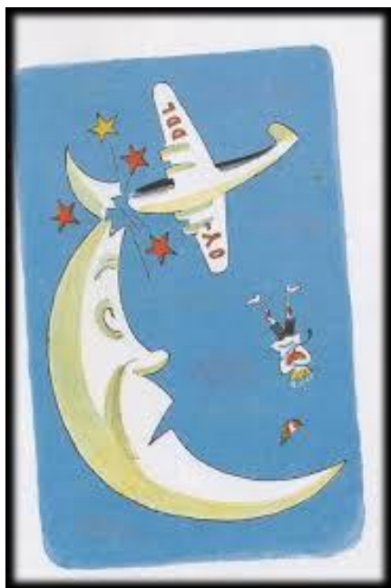
Slika 11: Dječak Pale avionom želi obići cijelu zemlju 41