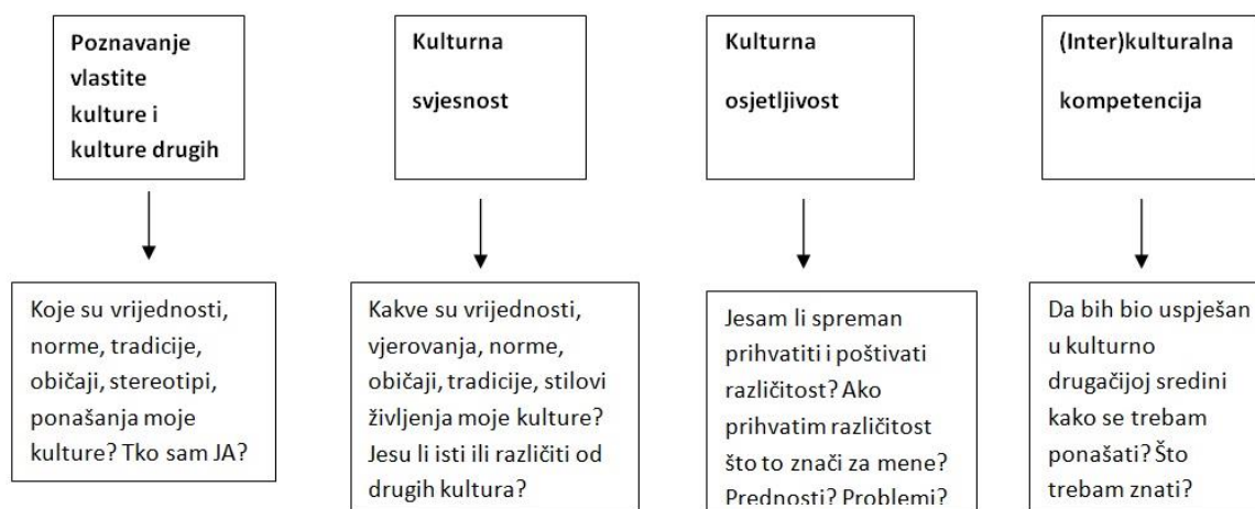
Slika 1. Kako se postiže interkulturalna osjetljivost (prema Piršl, 2012)