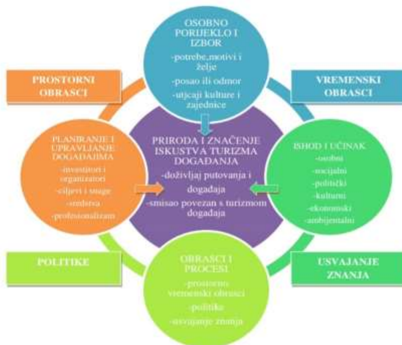
Slika br. 1. Shematski prikaz upravljanja događajima

Kako bi se dobio bolji uvid o percepciji turizma događaja u prilog rada dodana je shema koja prikazuje kako razumjeti znanje o kreiranju događaj, tj. festivala