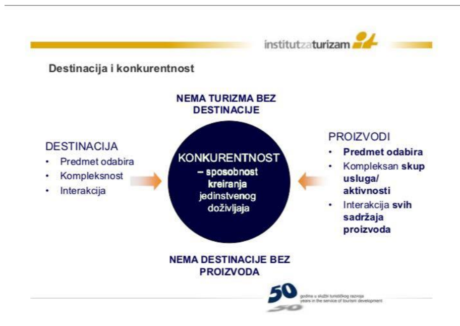
Slika 2. Prikaz sustava konkurentnosti u odnosu na destinaciju