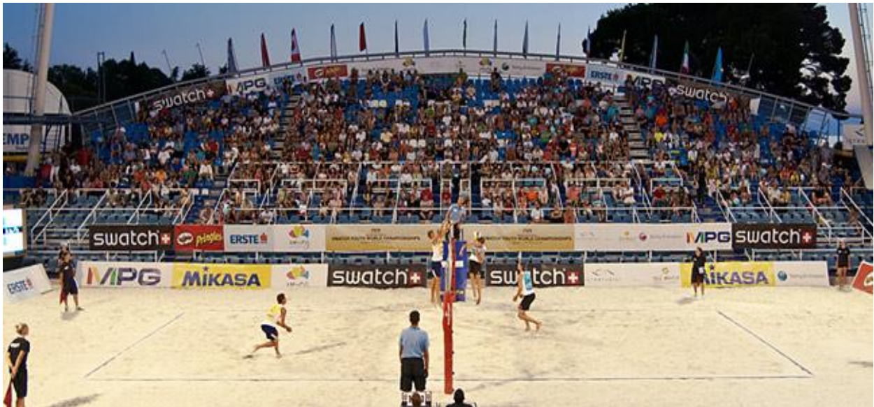
Slika 8. Turnir u Umagu