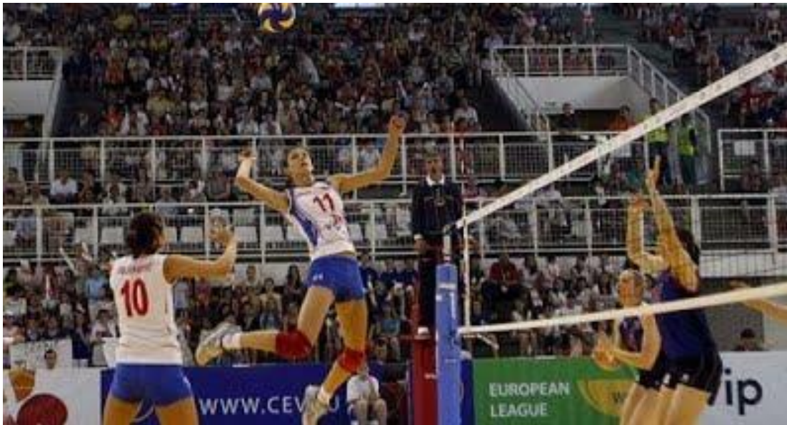
Slika 6. Smeč