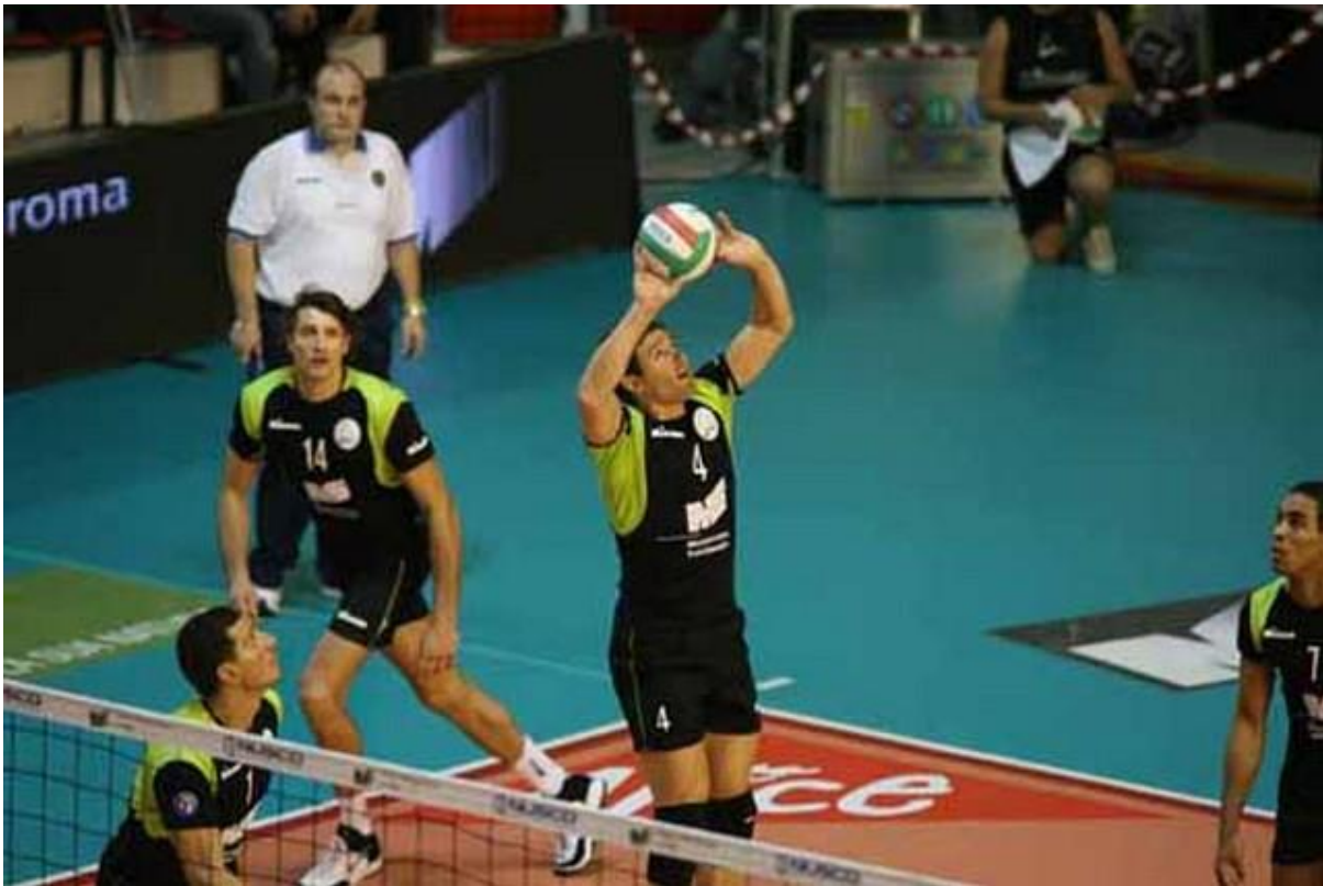
Slika 5. Dizanje u odbojci