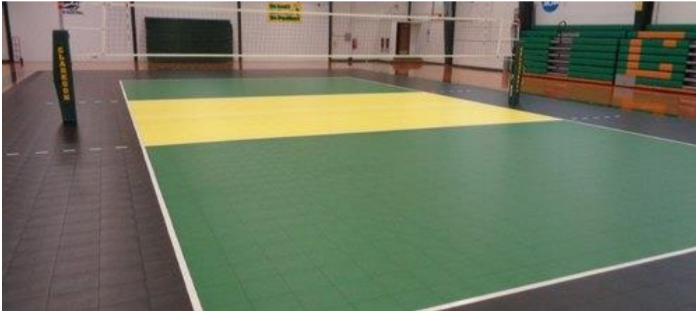
Slika 2. Podloga odbojkaškog terena

Izvor: https://5.imimg.com/data5/QR/YA/EW/SELLER-54500078/volley-ball-court-flooring-500x500.jpg 08.08.2019.