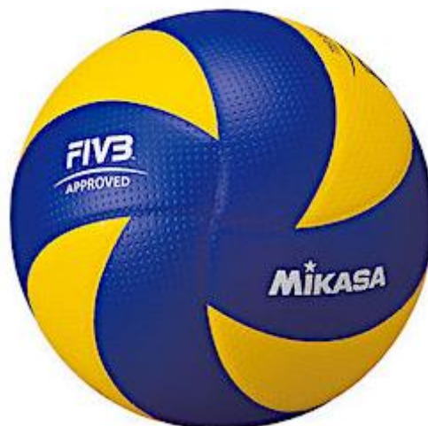
Slika 3. Odbojkaška lopta (MV200)