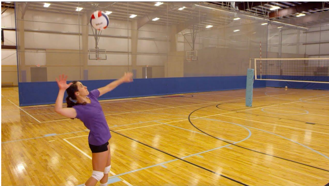
Slika 4. Servis