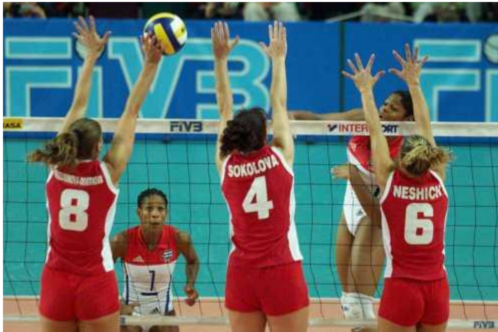
Slika 7. Blok