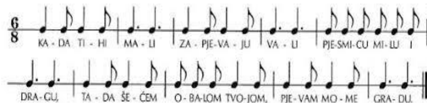
Slika 4. Govorena brojlica (Jurišić, Sam Palmić, 2002:22)

Govorena brojlica (Slika 4) određuje da se jezično-ritmička struktura od njena početka do kraja, odvija na istome (zadanom) tonu ili na istoj visini tona. Kako je ton, uz ritam, temeljni glazbeni element, nizanje, odnosno izgovaranje riječi, iako na jednome (istom) tonu, čini te iste riječi, glazbenim riječima. Tonovi se govorne brojlice razlikuju u trajanju, jačini i boji, ali ne i u visini. Dakle, može se reći da su te riječi oglašbljene iako ne i uglazbljene. Govorena je brojlica snažan intelektualni i glazbeni poticaj.