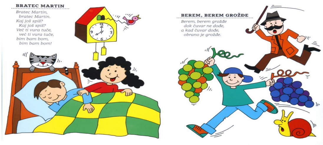
Slika 1. Brojalice Bratec Martin i Berem, berem grožđe

Danas je jako lako doći do brojlica. Osim tiskanog materijala mogu se koristiti i mediji (Slika 1; Slika 2; Slika 3).