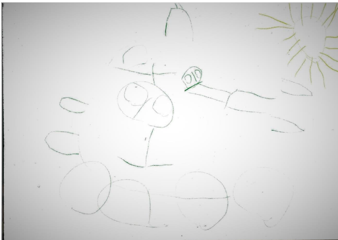
Slika 6.