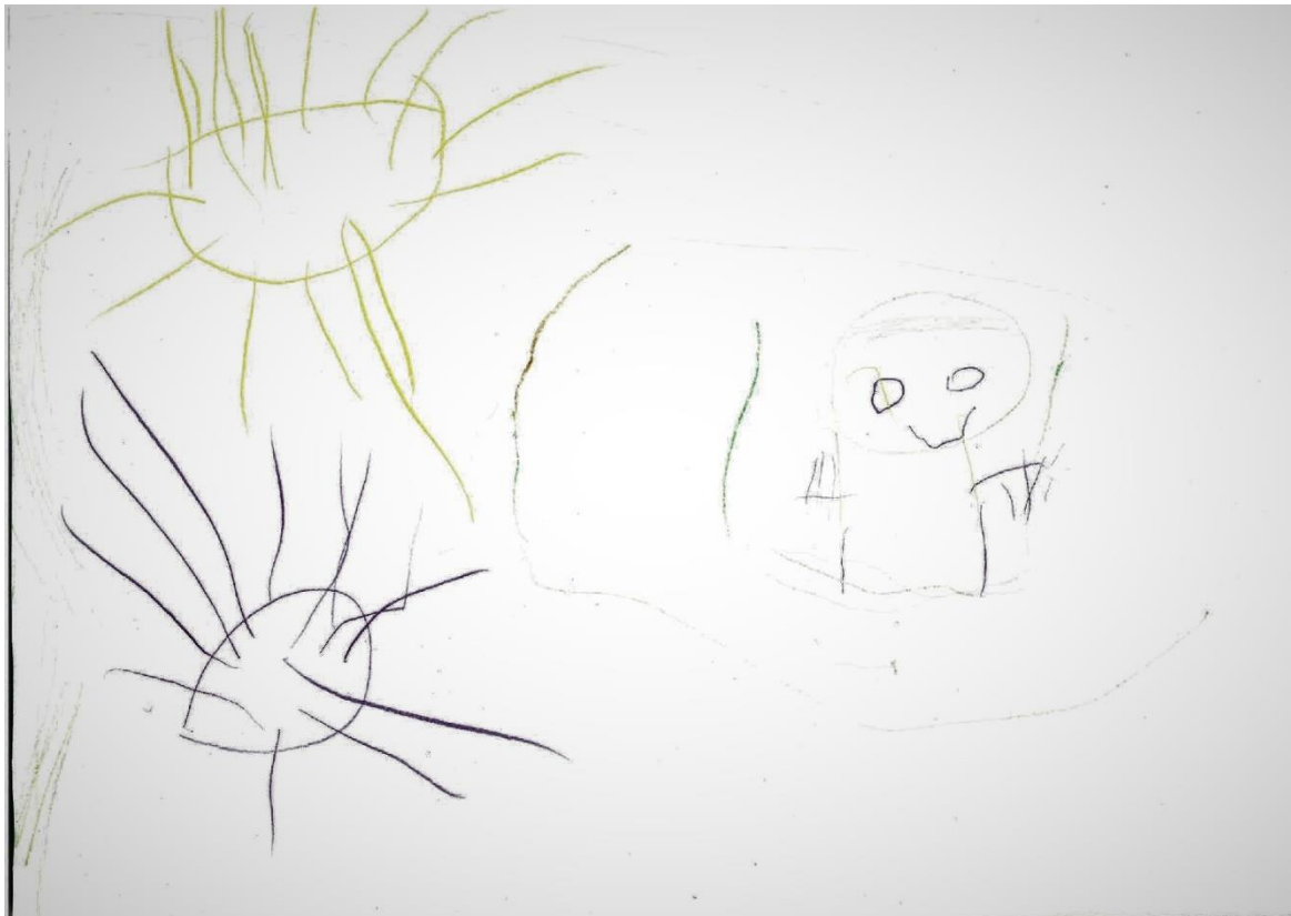
Slika 7.