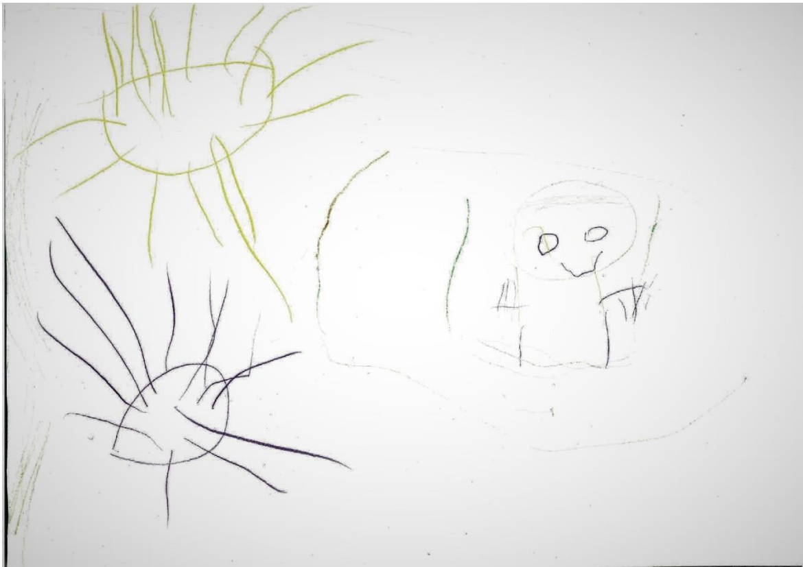
Slika 7.