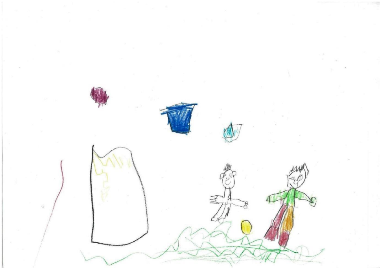
Slika 5.

Nacrtaj što radiš/što najviše voliš raditi u svoje slobodno vrijeme.