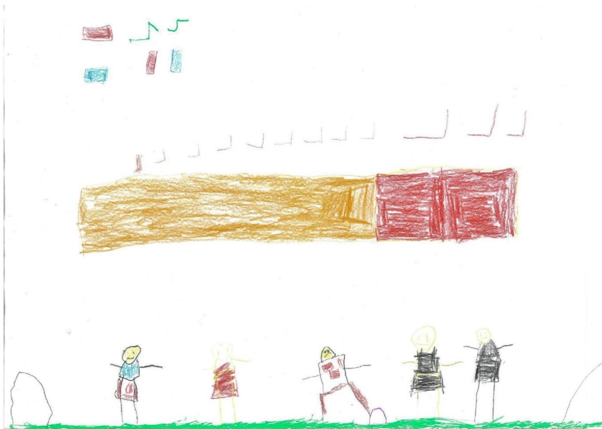
Slika 4.

Nacrtaj što radiš/što najviše voliš raditi i svoje slobodno vrijeme.