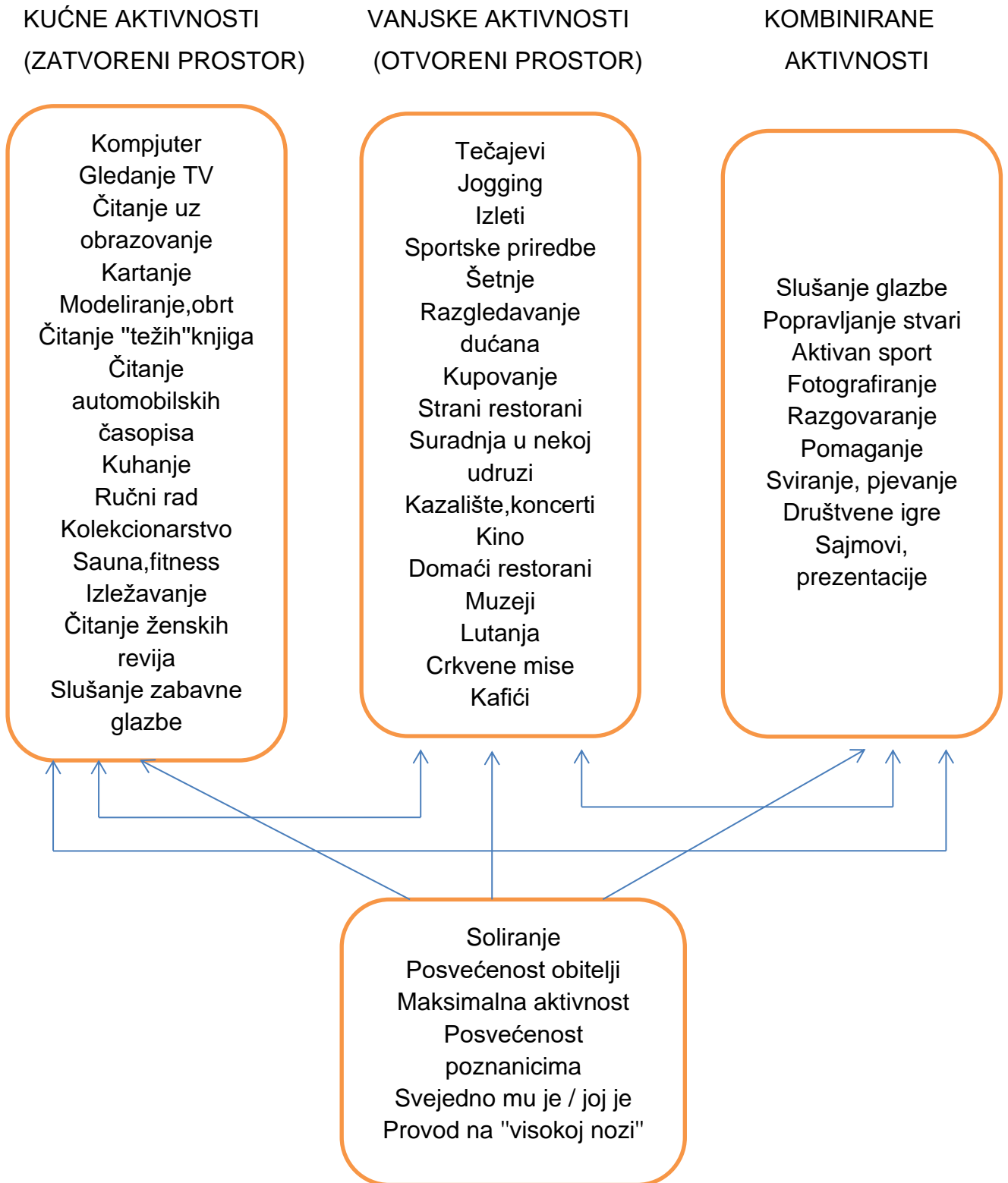
Slika 2. Aktivnosti u slobodno vrijeme (Valjan Vukić; 2013:67; prema: Rosić; 2005)

osmišljene, a motivacijski istinski utemeljene i razvojno usmjerene. Takva percepcija slobodnog vremena pretpostavlja permanentno odgojno djelovanje na pojedinca već od ranog djetinjstva.“ (Valjan Vukić; 2013:68)