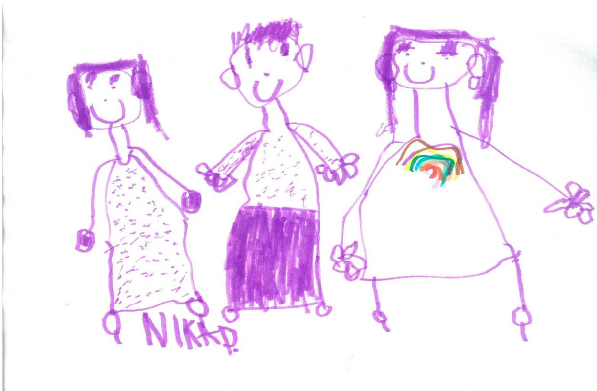
Slika 3.

Nacrtaj što radiš/što najviše voliš raditi u svoje slobodno vrijeme.