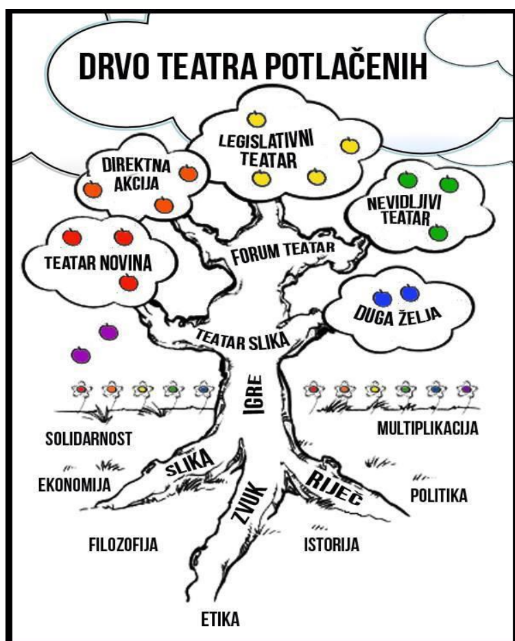
Slika 2 Drvo teatra potlačenih

U radu kazališta potlačenih sudjelovalo je mnogo različitih grupa ljudi, pa su se samim time razvijale različite i njegove tehnike. Te se tehnike mogu prikazati i slikovito u formi stabla gdje su slike, zvukovi i riječi korijenje; igre, Teatar slika i Forum teatar čine deblo, a ostale tehnike – Legislativni teatar, Direktna akcija, Nevidljivi teatar, Teatar novina, Duga želja – predstavljaju grane. ( http://www.okvir.org/forum-teatar-tehnika-teatra-potlacenih/ )