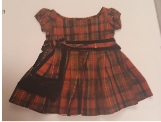
Slika 18. Haljinica za dječake iz 1860.