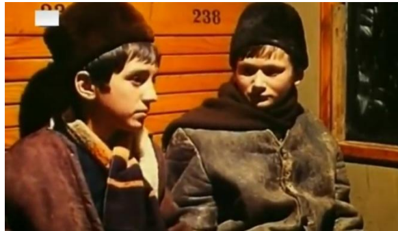
Slika 8. Kapa šubara

U ekranizaciji iz 1976. može se uočiti da djeca iz bogatijih obitelji nose zimske krznene kape, poznate kao šubare (slika 8.), a siromašniji seoske šešire koji nisu prikladni za zimsko godišnje doba (slika 9.). Šubara je u to vrijeme bila karakteristično pokrivalo za glavu, najčešće izrađeno od crnog janječeg krzna. Šeširi koji su poznati i pod nazivom škrljak ili kapa od crnog pusta također su nošeni, a bili su ukrašeni vrpcom ili cvijećem (Blažević i Pribić, 2000:184).