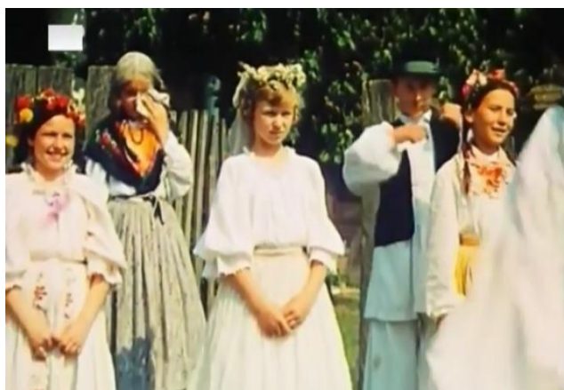
Slika 16. Scena iz filma Vlak u snijegu (1976.)