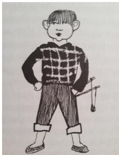
Slika 24. Tikijev izgled