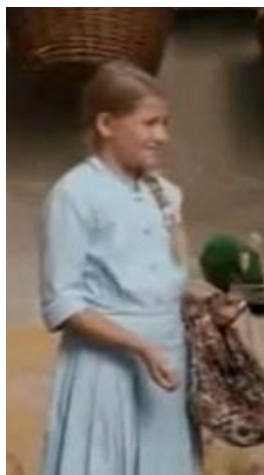
Slika 5. Gita u plavoj haljini