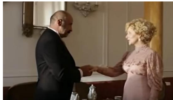
Slika 23. Izgled gospode iz filma Anka