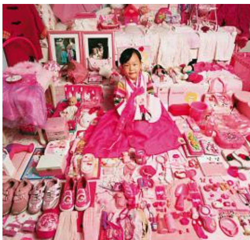
Slika 3. Rodni stereotipi: ružičasta soba za djevojčicu