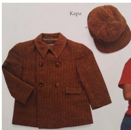
Slika 10. Kaputić za dječake iz 1930-ih