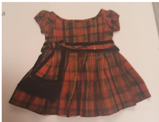
Slika 18. Haljinica za dječake iz 1860.