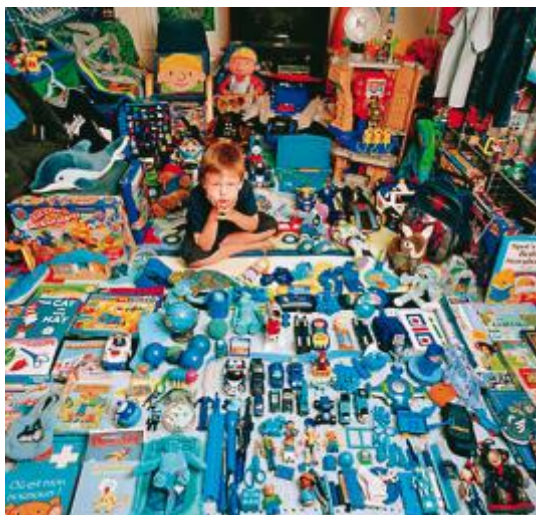
Slika 2. Rodni stereotipi: plava soba za dječaka