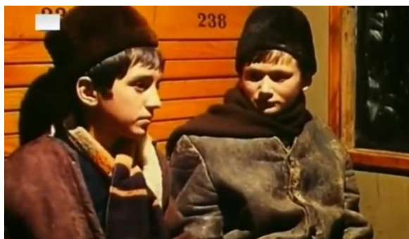
Slika 8. Kapa šubara

U ekranizaciji iz 1976. može se uočiti da djeca iz bogatijih obitelji nose zimske krznene kape, poznate kao šubare (slika 8.), a siromašniji seoske šešire koji nisu prikladni za zimsko godišnje doba (slika 9.). Šubara je u to vrijeme bila karakteristično pokrivalo za glavu, najčešće izrađeno od crnog janječeg krzna. Šeširi koji su poznati i pod nazivom škrljak ili kapa od crnog pusta također su nošeni, a bili su ukrašeni vrpcom ili cvijećem (Blažević i Pribić, 2000:184).