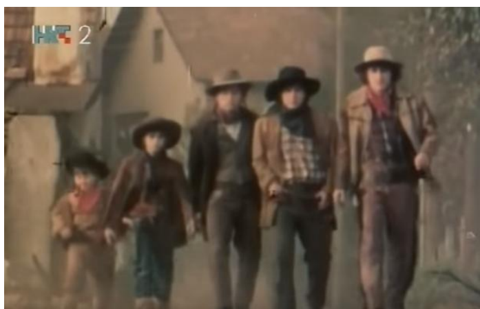
Slika 27. Uvodna scena serije Smogovci

Prikazom načina odijevanja likova u romanu Hitrec je pažnju usmjerio na ambijent, a ne na likove. U seriji je također oslikano jedno drugo vrijeme, a izgled braće Vragec iz uvodnog segmenta mnogim je gledateljima zasigurno ostao u sjećanju i danas. Skupina dječaka odjevena je poput kauboja, po uzoru na glumce iz filma Sedmorica veličanstvenih redatelja Johna Sturgesa (1960.), a sve je popraćeno i melodijom iz spomenutog filma (slika 27.). Kaubojska je odjeća u modnom svijetu zapadne kulture prisutna od 19. stoljeća, a glavne zasluge pripisuju se Divljem zapadu. Narednih je godina postala praktična odjeća, a ovakav stil poznat je pod nazivom western koji mnogi zagovaraju i danas.