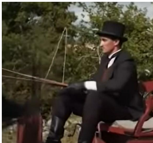
Slika 19. Kočijaš iz filma Anka (2017.)

Anka u igranom filmu iz 2017. godine nosi haljinu s "Petar-Pan" ovratnikom (slika 20.), spuštenim strukom i cvjetnim uzorkom kakve su bile popularne među djevojčicama u godinama nastanka romana (slika 21.) (Rowland-Warne, 1996).