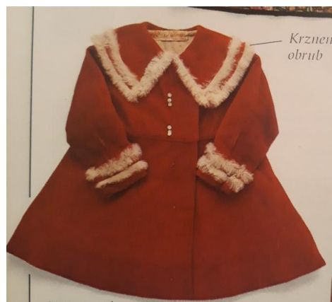
Slika 11. Kaputić za djevojčice iz 1930-ih