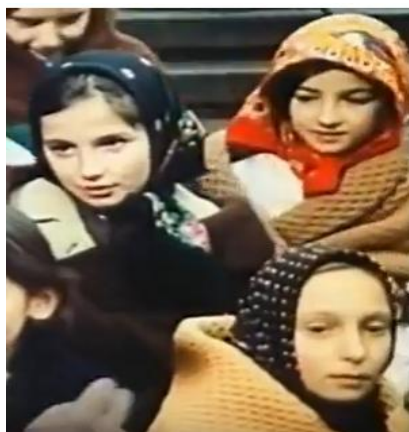
Slika 15. Djevojčice s maramama

tako i kod djevojčica. Marama odnosno rubac nekad je imala značenje. Točno se znalo kakvu maramu nosi neudana djevojka, kakvu udana, a kakvu starica i ona je predstavljala element za raspoznavanja kakvog je bračnog i društvenog statusa osoba koja ju nosi. Marama je na selu bila dio narodne nošnje (slika 11.), kako svečane tako i one koja je služila kao odjeća za svakodnevicu. Iako su se marame nosile i u gradskoj sredini, ondje su imale funkciju štititi od vanjskih uvjeta i nosile su se ovisno o vremenu. Danas su marame rijetke i nose ih samo stariji stanovnici seoske sredine (Pavličić, 2015). Spomenuti su elementi narodne nošnje sačuvani još iz 6. i 7. stoljeća (Blažević i Pribić, 2000).