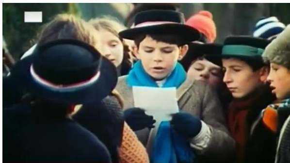
Slika 9. Šešir (škrljak)