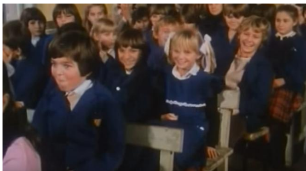
Slika 26. Školske uniforme