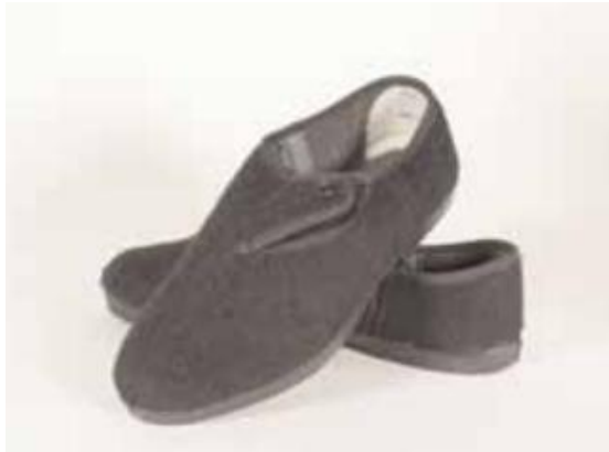
Slika 25. Zepe

među tinejdžerskim uzrastom. Zepe i bijele sportske čarape predstavljale su omiljenu modnu kombinaciju (Brenko, 2006).