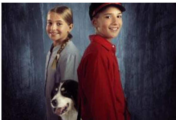
Slika 7. Igrani film Šegrt Hlapić