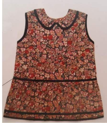
Slika 21. Haljina za djevojčice s "Petar-Pan" ovratnikom