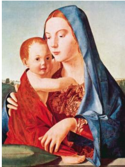
Slika 1. Antonello da Messina, Madona s djetetom , ulje i tempera na drvetu, oko 1475.

djevojkama najbolje odgovaraju svijetloplavi tonovi, a dječacima crveni odjevni predmeti.