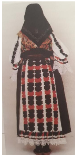
Slika 13. Muška narodna nošnja Slika 14. Ženska narodna nošnja

Izvor: Blažević i Pribić, 2000., str.181. Izvor: Blažević i Pribić, 2000. str. 193.