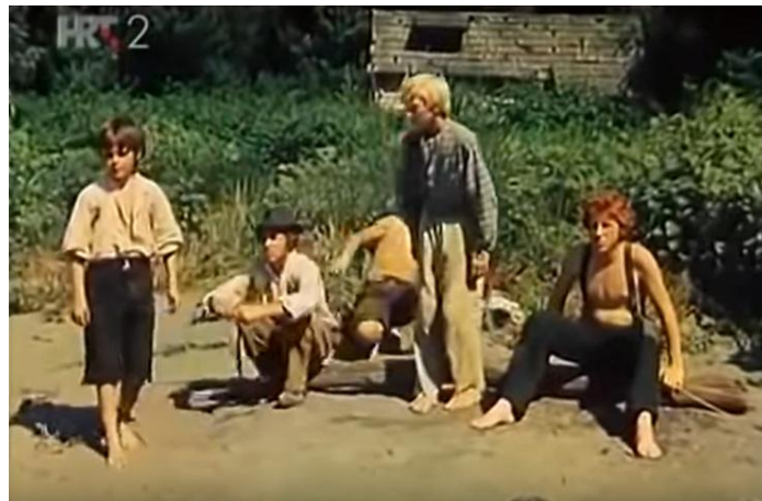
Slika 17. Scena iz filma Družba Pere Kvržice (1970.)

U ekranizaciji iz 1970. godine također su česte scene bosih nogu i oskudno odjevenih glumaca (široke košulje i hlače) (slika 17.).