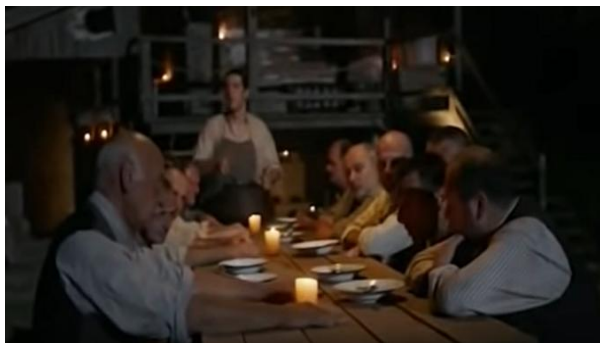
Slika 22. Izgled seljaka iz filma Anka