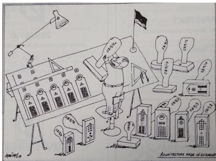
Slika 2. Ironimus: “Architecture made in Germany”