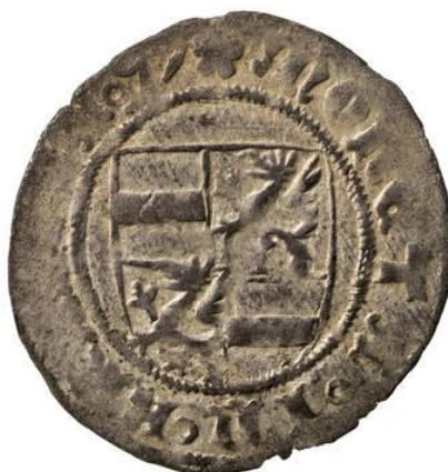
Krajcar bana Jana Vitovca (1459.) 59

Od njemačkog izraza kreuzer (križ). Novčić je nazvan prema dvostrukom križu koji se nalazi na naličju. Sitan novac, mjeden i različite vrijednosti. U XIII. i XIV. stoljeću su se kovnice nalazile u Meranu (Južni Tirol) te u Veroni. Kod nas se krajcar najviše koristio od 1527. godine te isto tako kada je Ferdinand II. bio okrunjen kao hrvatski i slavonski kralj. 58