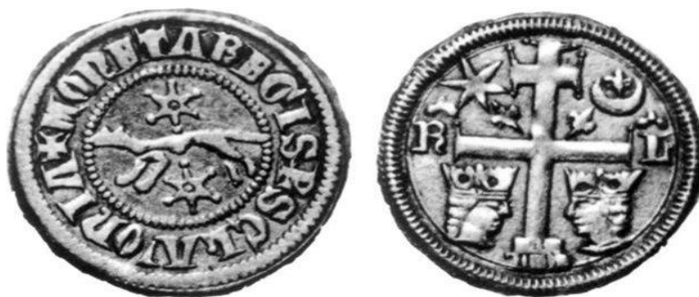
Slavonski banovac kralja Bele IV. 63

Naličje: dvostruki križ, na poprečnoj gredi s lijeve strane nalazio se polumjesec, a s desne strane bila je zvijezda danica. Na donjoj poprečnoj gredi s obje strane nalazile su se okrunjene glave koje su bile okrenute lice jedna prema drugoj. Nad glavama su bila otisnuta početna slova onog kralja, hercega ili bana koji je dao kovati novac.