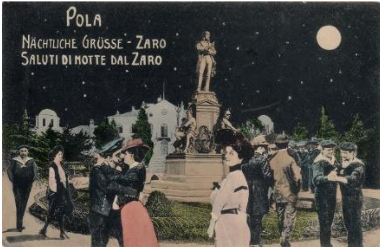
Slika 2. Primjer razglednice s motivom spomenika viceadmiralu.