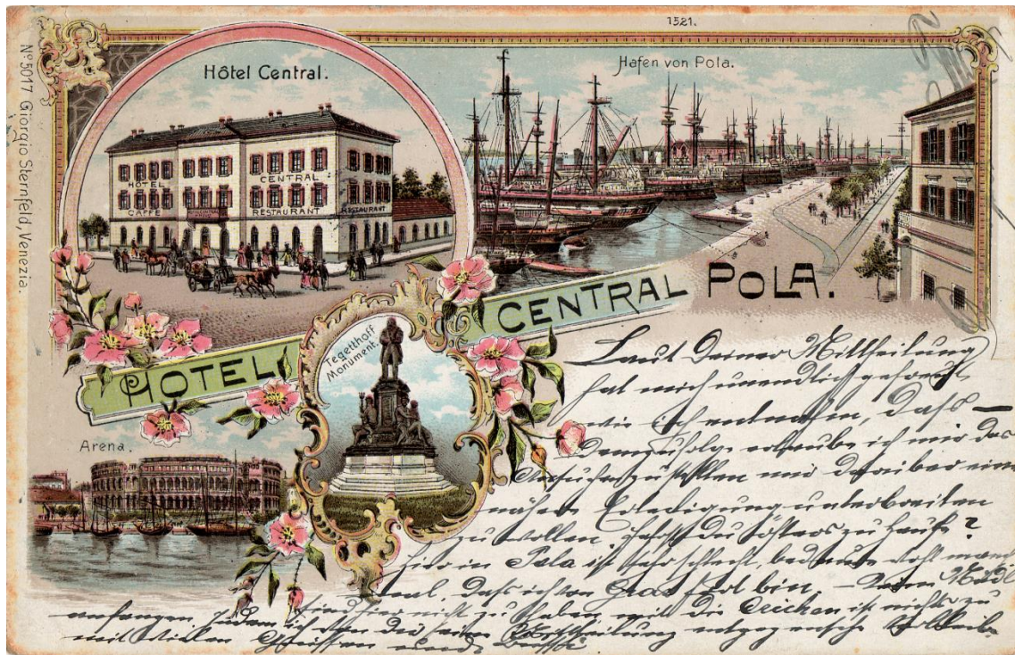
Slika 6. Razglednica s motivima Pule i hotelom Central.