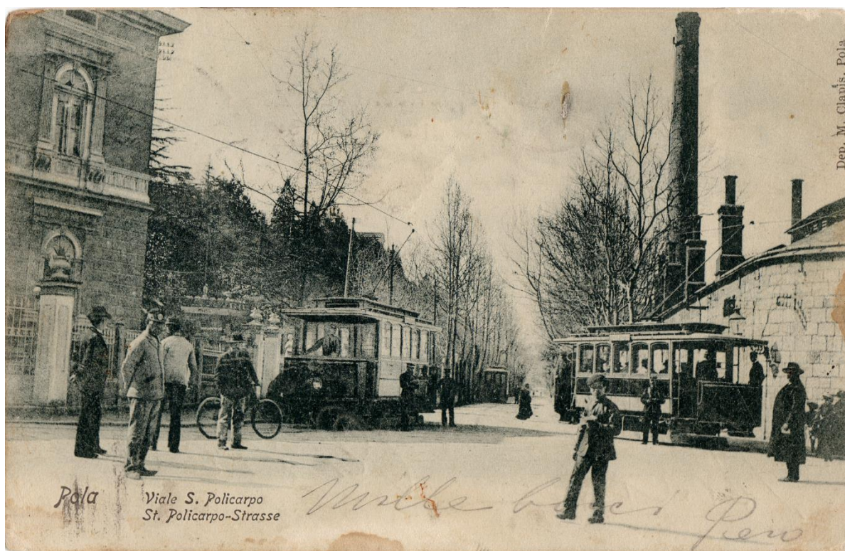
Slika 3. Pulski tramvaj.

otvorenja pruge prevezeno 410.000 putnika, a tramvaji su za to vrijeme prešli 126.000 km. 100 Takvi podaci zasigurno ukazuju na aktivan i bogat društveni život žitelja Pule.