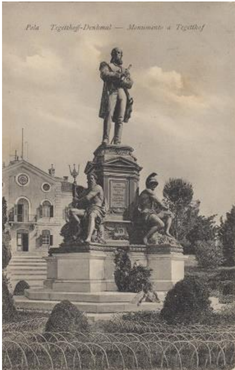
Slika 1. Spomenik viceadmiralu Wilhelmu von Tegetthoffu.