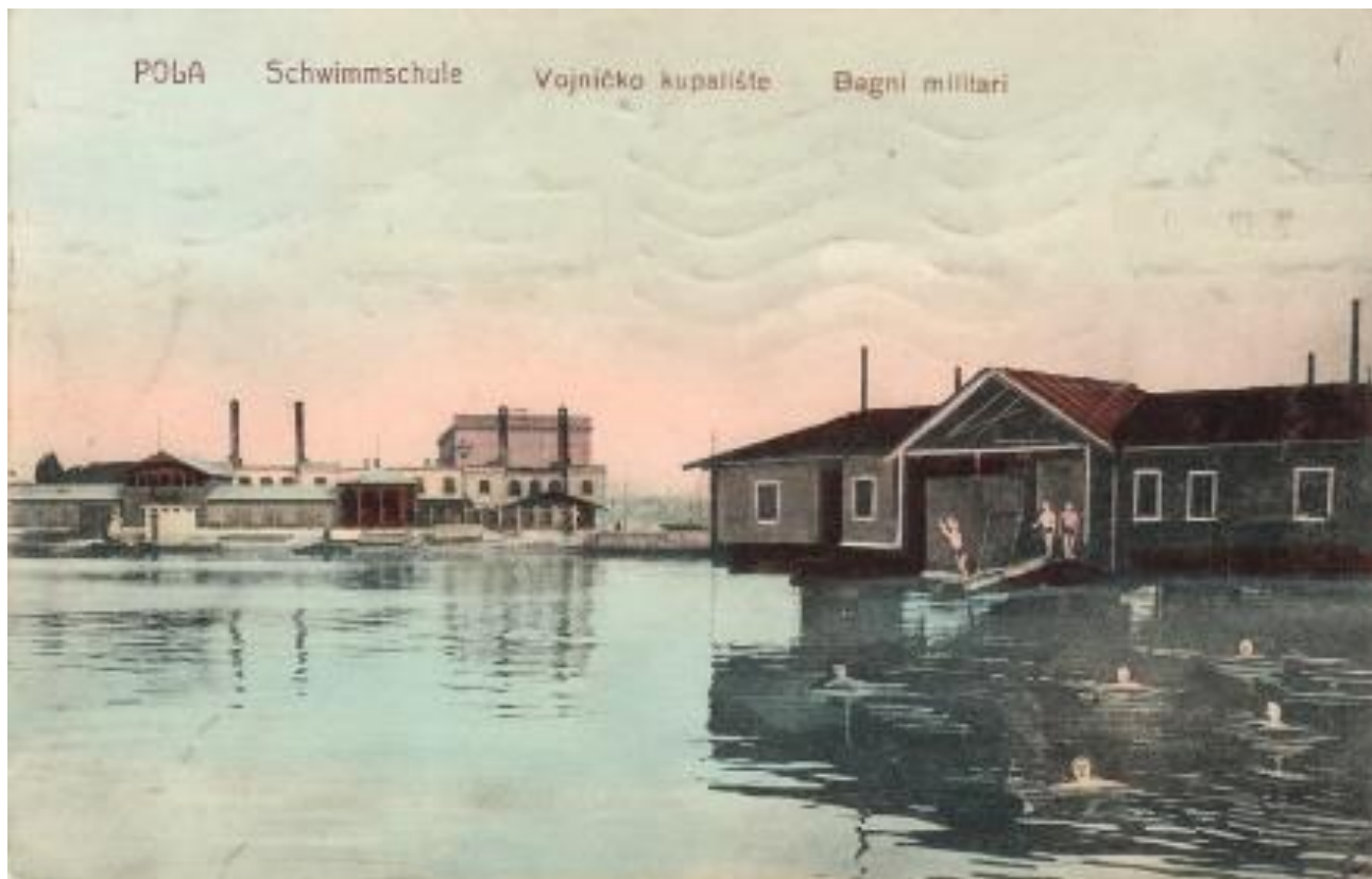
Slika 11. Vojničko kupalište.