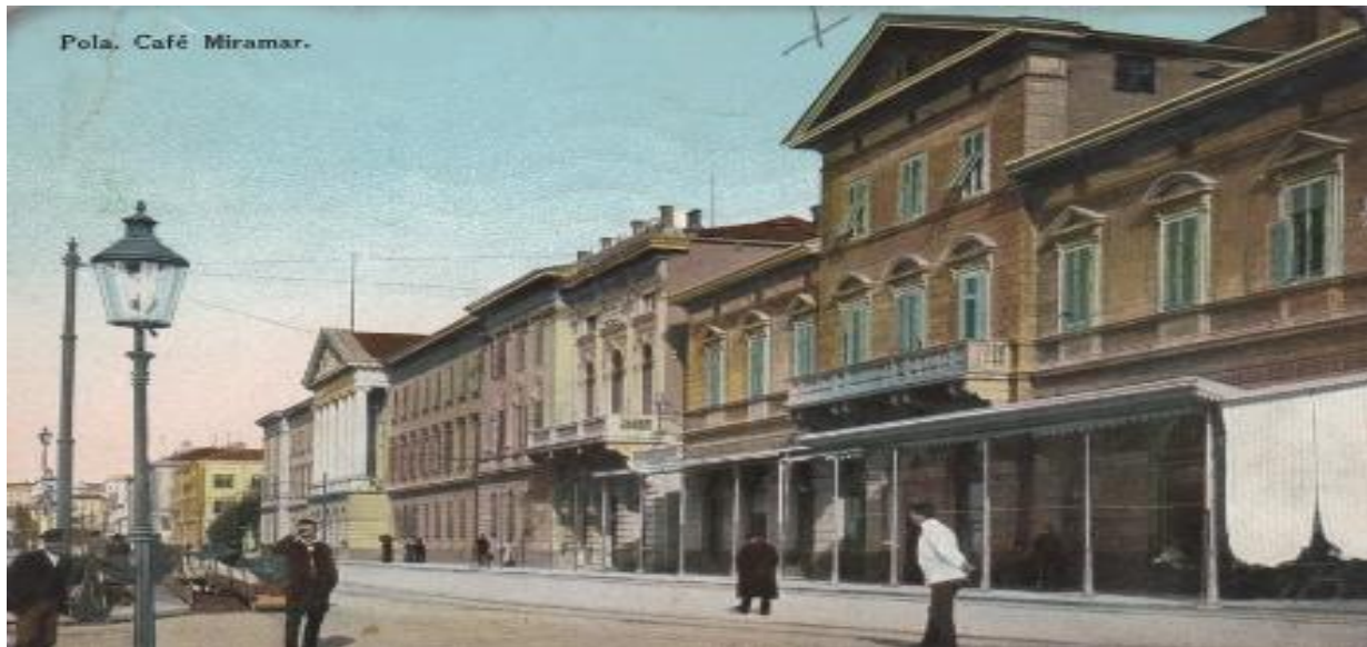
Slika 5. Kavana Miramar.

Jedna od najznačajnijih ličnosti za gradsku povijest zasigurno je poznati Lodovico Rizzi. Odvjetnik i političar, vršio je dužnost gradonačelnika Pule od 1889. do 1904. godine. Još je jednom izabran na tu dužnost u razdoblju od 1923. do 1926. godine. 159 Za vrijeme njegova prvog mandata grad je obogaćen novim sadržajima, uz strelovit ekonomski i društveni napredak. Rizzi je 1903. godine predložio novi plan financijskog razvitka, gledajući na turizam kao pokretačku snagu, u slučaju nemogućnosti razvijanja industrije i trgovine. Trebalo je privući strance, oslanjajući se na povijesno naslijeđe, novitete i ugodan smještaj. 160