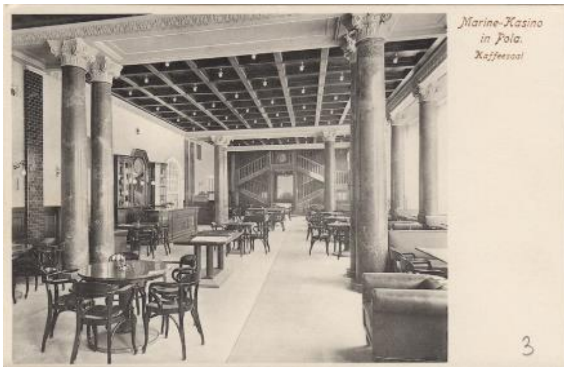
Slika 4. Kavana Mornaričkog kasina.

prekidali su se svi službeni odnosi, nije se više moralo pretpostavljenoga vojnički pozdraviti, u toj društvenosti puhao je lahor slobode mora, a moje mladalačko stajalište prema tome mogaše biti samo veoma pozitivno.“ 128 Broj članova je s vremenom rastao, te je stara zgrada postala tijesna. Stoga je srušena, a na njezinu je mjestu 1913. prema projektu austrijskog arhitekta Ludwiga Baumanna izgrađena nova. Njezina ukupna površina iznosila je 15000 m 2 , a mogla je primiti do 1000 posjetitelja. Treba naglasiti da je izgradnja zgrade financirana sredstvima članova. 129 Najveći dio desnog krila kasina, činili su kavanski prostori. Ljeti se po običaju otvarala kavana na prostranoj terasi drugog kata zgrade. 130 Velike sale služile su za bankete, plesove i koncerte, dok su neke prostorije bile rezervirane isključivo za članove, kako bi u njima mogli u miru voditi razgovore. Kasino je imao i veliku vrtnu terasu i zimski vrt. Članovima je za razonodu bila na raspolaganju kuglana, a nalazila se u suterenu. 131