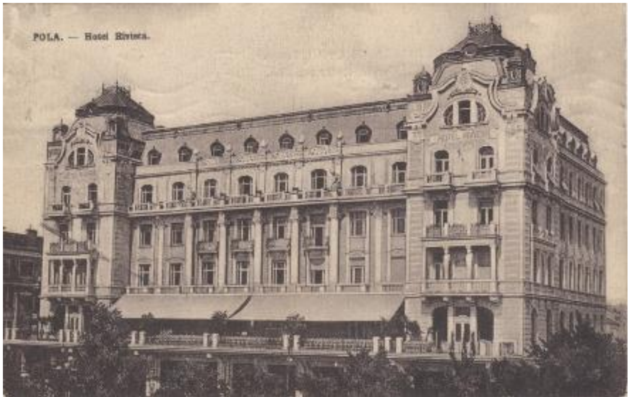
Slika 7. Palast Hotel Riviera.

violinistice Berte Schüller, te mnogi drugi. 170 Treba još navesti da je hotel Riviera ugostio i dva velika imena austrijske i njemačke književnosti, Karla Krausa i Hermanna Bahra. 171 Ovi podaci ukazuju na kvalitetu i visoku razinu usluge koja se pružala u Palast Hotel Rivieri . Često su priređivani zabavni koncerti u restoranu na katu hotela i u kavani, o čemu redovno izvješćuje dnevni tisak. 172 Godine 1913. hotel je predan poduzeću za promet, a potom je zbog rata bio zatvoren i korišten u druge svrhe. 173 Danas je hotel Riviera gotovo zaboravljen na margini centra grada, daleko od svoje sjajne prošlosti.