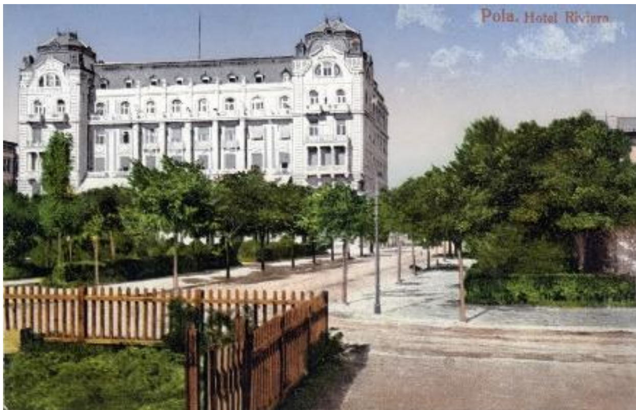
Slika 8. Razglednica koja prikazuje Hotel Rivieru.