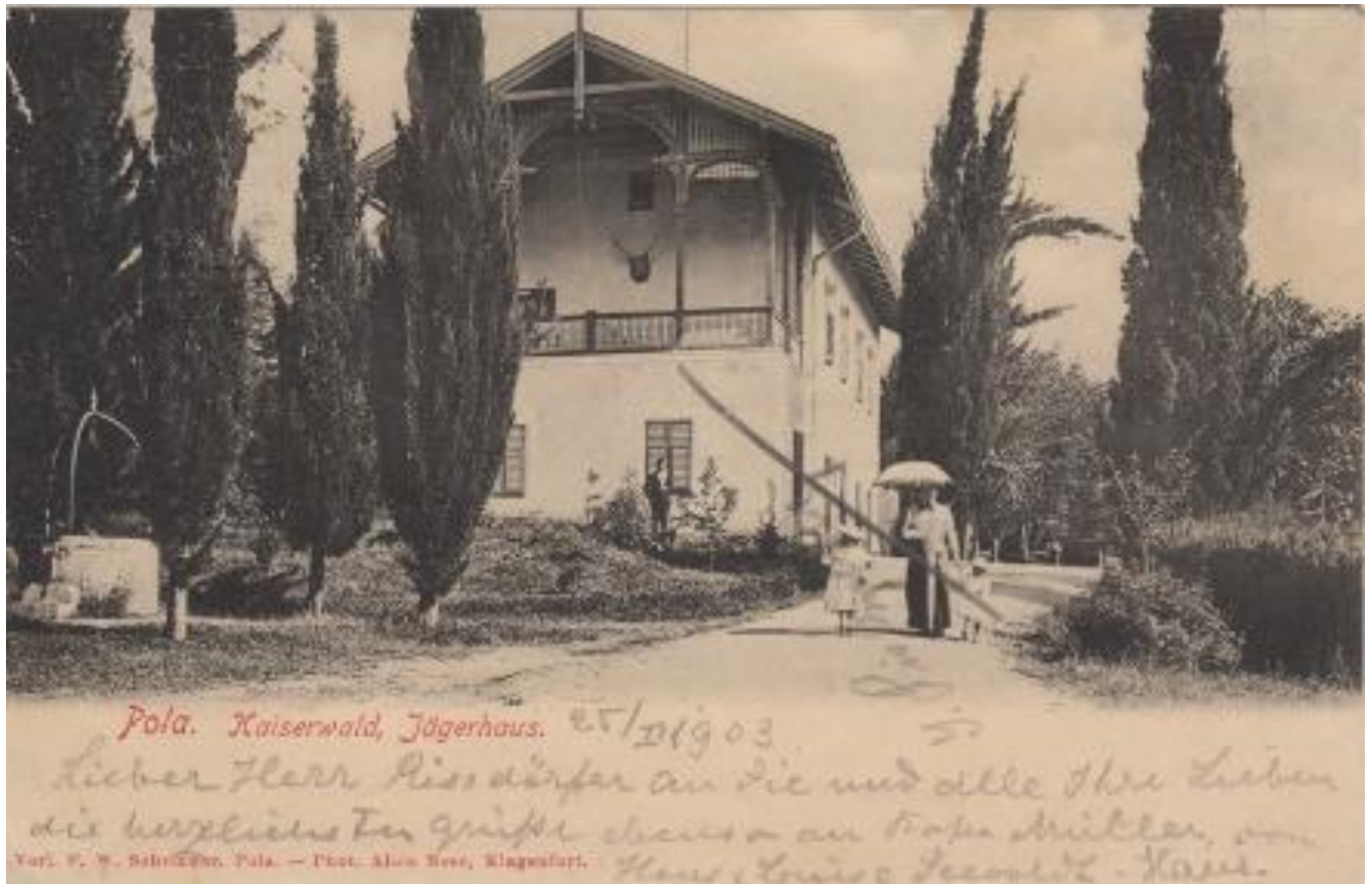
Slika 9. Lovačka kuća u Šijanskoj šumi.

čak tri glazbene skupine. 193 Svakako vrijedi navesti oglas iz 1889., koji najavljuje veliku predstavu znamenitog gospodina Giacoma Merighia. Prema najavi gospodin Merighi će svojim balonom na vrući zrak sletjeti na centralnu poljanu Šijanske šume. Uz to se navodi u tekstu, da će gospodin Merighi izvesti nevjerojatne akrobacije. Osim njega, publiku će gimnastičkim akrobacijama zabavljati obitelj Gargani. 194 Za vrijeme uskrasnih praznika organizirali su se izleti tramvajem od kavane Miramar do Šijanske šume. Kretalo se u popodnevnim satima, a cijena karte je iznosila od 40 do 60 centa po osobi. 195