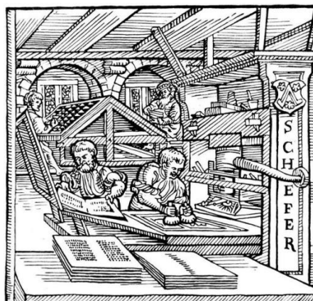
Slika 2. Tiskarstvo, tiskara u doba reformacije