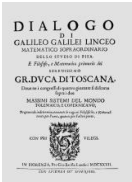
Slika 3., naslovna stranica Dialogo sopra i due massimi sistemi del mondo, ptolemaico e copernicano... , Galileo Galilei, 1632.