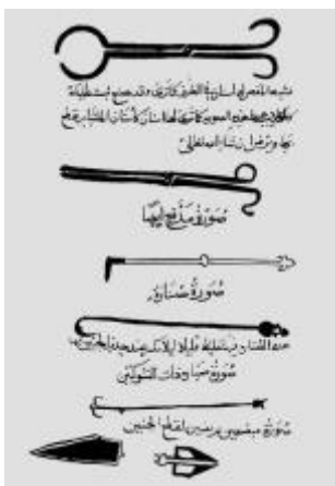
Slika 1. Arapska znanost, Abul Kasim, Al-Tašrīf, crteži medicinskih instrumenata, 11. st.

Važnost renesanse 12. stoljeća i općenito znanstvene i filozofske djelatnosti razvijenoga srednjeg vijeka je ta da su intelektualci s početka novoga vijeka došli do novih spoznaja i revolucionarnih otkrića proučavanjem, propitkivanjem i provjeravanjem zaključaka i teza srednjovjekovnih mislilaca. 27