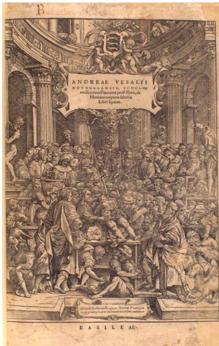
Slika 4., naslovna stranica De humani corporis fabrica , Andreas Vesalius, 1543.