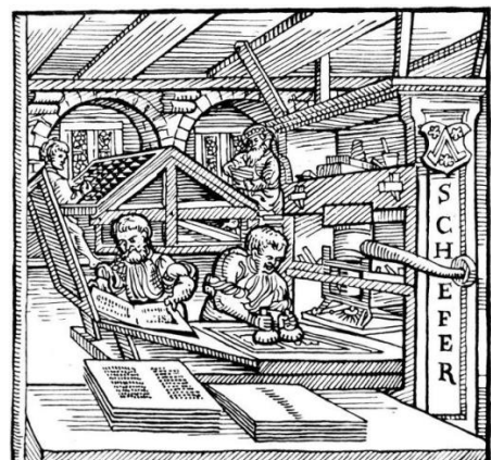
Slika 2. Tiskarstvo, tiskara u doba reformacije