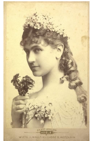
Prilog 12. Katarina Schratt

Pred kraj 1860-ih, kada je sklopljena Austro-ugarska nagodba, bilo je poznato koliko Elizabeta voli Ugarsku i mađarski jezik i kulturu. Međutim, nakon rođenja Marie Valerie, Elizabeta je izgubila sav interes za politiku te je ponovno otputovala sa svojim kćerima, ovaj puta u južni Tirol. Rudolf je ostao uz svog oca i zamjerao majci što ih je ostavila u vrijeme teške krize i vrhunca rata s Pruskom, čak joj je i pisao pisma u kojoj joj otvoreno zamjera. Nadvojvotkinja Sofija joj je također zamjerala, ali je na početku 1870-ih imala većih problema s liberalizmom i Mađarima na dvoru. U to vrijeme došlo je i do zaruka Gisele i bavarskog princa Leopolda, njezinog rođaka. Ni Sofija ni Elizabeta nisu smatrale kako je ovaj brak dobar, ali iz različitih razloga. Elizabeta je smatrala kako je Gisela još premlada, iako je bila otprilike istih godina kao i ona kada se udala za Franju Josipa. Sofija, nažalost, neće doživjeti vjenčanje svoje unuke jer je 28. svibnja 1872. umrla od prehlade koja se proširila i postala opasna. Smrt majke jako je pogodila Franju Josipa. 69