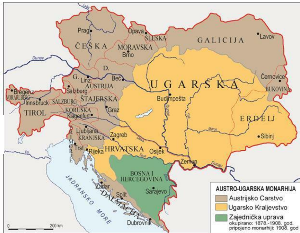
Prilog 7. Austro-Ugarska Monarhija nakon nagodbe 1867. godine

Sada, nakon sklopljene nagodbe, vlast u ovoj novoj državi dijelila se na austrijsku, ugarsku i zajedničku vladu kojom je predsjedao vladar. Zajednički poslovi rješavali su se preko zajedničke vlade ili "Ministarskog vijeća" kojom je predsjedao vladar, a u njegovoj odsutnosti ministar vanjskih poslova, kojeg je vladar imenovao predsjednikom vijeća. Ministarsko vijeće sastojalo se od ministra vanjskih poslova, ministra financija i ministra vojnih poslova. Delegacije obje vlade bi se sastajale jednom godišnje, jednu godinu u Beču, jednu u Pešti, kako bi odredile proračun za Ministarsko vijeće. Ministar vanjskih poslova imao je mogućnost predlaganja ministra financija, međutim prema nepisanom pravilu on je morao biti iz drugog dijela monarhije. Dakle, ako je ministar vanjskih poslova bio iz Austrije, ministar financija morao je biti iz Ugarske. Posljednji član Ministarskog vijeća, ministar vojnih poslova, nije podlagao ovom pravilu s obzirom na to da je sam vladar bio vrhovni zapovjednik vojske te ministar vojnih poslova nije bio neophodan. 37