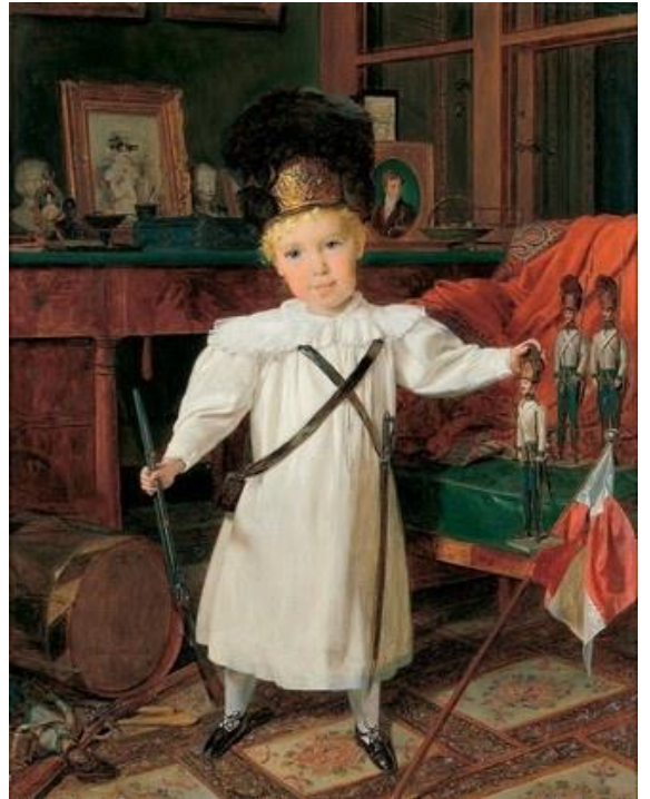
Prilog 3. Franjo Josip, tri godine