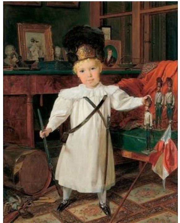
Prilog 3. Franjo Josip, tri godine

Od šeste godine života Franjo Josip je bio pod budnim okom pomno izabranih tutora. Do trinaeste godine života imao je trideset i dva sata poduke tjedno, a od trinaeste je imao pedeset sati tjedno. Sofija i Metternich 5 su odredili grofa Heinricha Bombellesa kao glavnu osobu u obrazovanju Franje Josipa, još su pridonijeli i grof Johann Coronini, s kojim je Franjo Josip imao blizak odnos zbog Coroninijeve časničke službe, zatim zapovjednik Franz von Hauslab koji je provodio njegovu vojnu obuku. Osim osnovnih