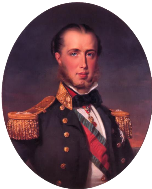
Prilog 9. Princ Ferdinand Maximilian, mlađi brat Franje Josipa

Sljedeća vanjskopolitička kriza Franje Josipa zahvatila je sjevernu Italiju, točnije područja Lombardije i Venecije koja su bila pod austrijskom vlašću. Franjo Josip je za namjesnika u ovom području imenovao svog mlađeg brata Ferdinanda Maximiliana, koji se pokazao sposobnijim i liberalnijim. Maximilian je predlagao da se stanovništvu Lombardije i Venecije daju ustupci zbog njihovih žalbi na visoke poreze, ali Franjo Josip nije želio popustiti i s time je okrenuo raspoloženje u navedenim pokrajinama protiv sebe. Kako nije dolazilo do dogovora Napoleon III. je iskoristio svoju priliku kako bi izgurao Habsburgovce iz Italije. 52 General Radetzky umro je 1857., a na njegovo mjesto stavljen je general Gyulay, koji ga nije dobio zbog svojih sposobnosti već zbog