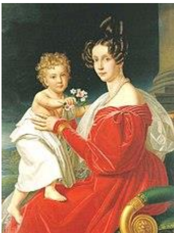
Prilog 2. Joseph Stieler: Nadvojvotkinja Sofija i dvogodišnji Franjo Josip, ulje na platnu, 1832.

Sofija i Franjo Karlo u prvim godinama braka nisu imali djece, Sofija je imala i dva pobačaja, ali napokon 1830. trudnoća je, pod budnim okom doktora, bila uspješna i 18. kolovoza rodio se dječak. Ime Franjo Josip nije slučajno izabrano. Franjo je u čast