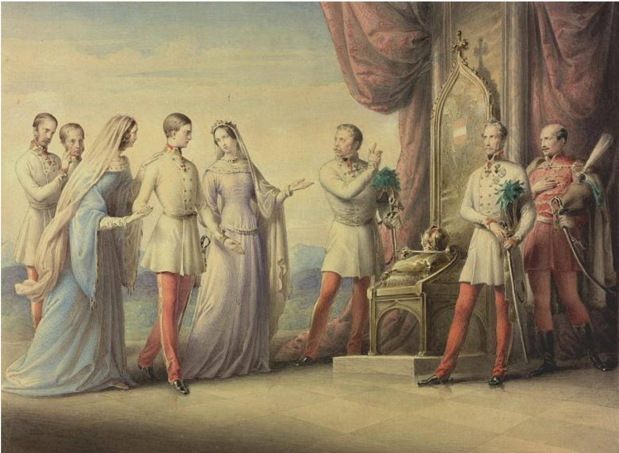
Prilog 4.. Leopold Kupelwieser: Nadvojvotkinja Sofija vodi svog sina Franju Josipa do prijestolja, akvarel, 1848.

transilvanijske i banatske elite protiv Ugarske. Međutim, ipak je u kolovozu 1849. bila potrebna intervencija ruske vojske kako bi se situacija u Ugarskoj smirila. Pred kraj revolucionarnih zbivanja i s novim carem na čelu Monarhije bilo je očito da se carstvo ne može vratiti na prijašnji poredak, ali narodi carstva su bili sumnjičavi u vezi budućnosti. 11