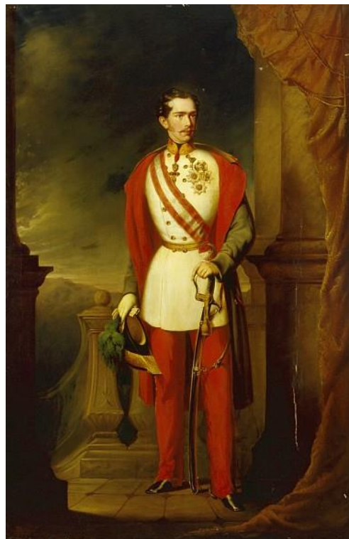
Prilog 10. Mladi Franjo Josip, oko 1860., ulje na platnu

Turbulentan carski život Franje Josipa proširio se i u privatnu sferu. Vrlo često opisan kao jednostavan čovjek koji voli red, rad i disciplinu, Franjo Josip u svom svakodnevnom životu nije tražio carski luksuz koji je nametala tradicija dvora u Beču. U svom životu pretrpio je mnogo tuge, mnogo smrti, ali njegova carska dužnost je uvijek ostala na prvom mjestu. Od smrti njegove majke, Sofije, koja je bila veliki uzor, preko odsustva njegove žene, Elizabete, koju je jako volio, do samoubojstva jedinog sina Rudolfa. Kroz sve ovo Franjo Josip je morao proći te i dalje upravljati carstvom kako se očekivalo od njega, često nazivanog posljednjeg Habsburgovca starog kova.