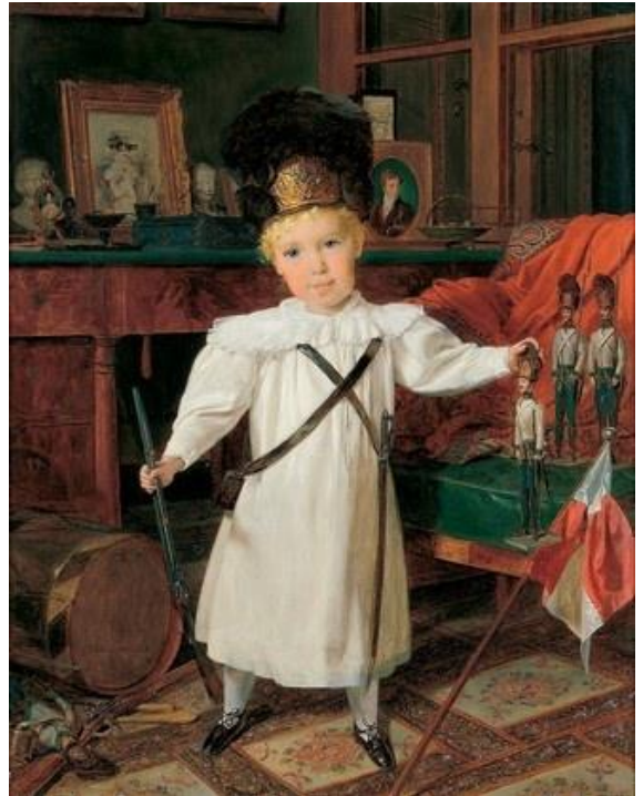
Prilog 3. Franjo Josip, tri godine