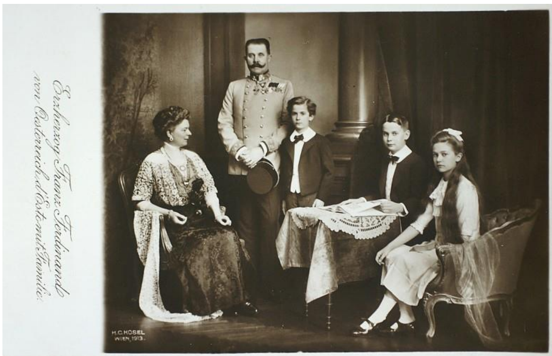
Prilog 14. Franjo Ferdinand sa svojom obitelji, razglednica 1913.

Nakon njegovog vjenčanja odnos Franje Ferdinanda i njegovog ujaka bio je još gori, međutim osobne nesuglasice su prešle i na nesuglasice u sferi upravljanja državom. Franjo Ferdinand postajao je nestrpljiv, a Franjo Josip nije bio spreman podijeliti političku moć s nikim pa niti sa svojim nasljednikom, isto je bilo i s Rudolfom. Upravo zato Franjo Josip je za svog nećaka odredio vojnu karijeru u kojoj je Franjo Ferdinand brzo napredovao tako da je do 1913. dobio čin generala inspektora. Franjo Josip je smatrao kako je Monarhija previše kompleksna i ranjiva da bi se mogle donositi stroge mjere, a Franjo Ferdinand je vjerovao suprotno, kako ju jedino to može spasiti. Niz nesuglasica i razlike u karakteru su sprječavale ujaka i nećaka da se često viđaju. Možda je najbolji primjer njihovih različitih karaktera pristup lovu svakog od njih. Franjo Josip je lov doživljavao kao opuštajuće iskustvo, nešto što je radio kao razbibrigu. Franjo Ferdinand je, pomalo zabrinjavajuće, postao vrlo agresivan u lovu, kao da je imao žudnju za krvoprolićem, osim toga bio je vrlo nepovjerljiv prema svojoj habsburškoj obitelji. 81