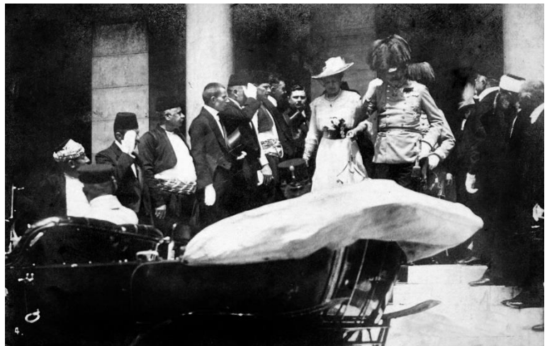
Prilog 15. Nadvojvoda Franjo Ferdinand i supruga Sophie ulaze u auto u Sarajevu, nekoliko minuta prije atentata

Za vrijeme sudbonosnog posjeta Bosni i Hercegovini, u Sarajevu prestolonasljednik Franjo Ferdinand i njegova žena Sophie poginuli su u atentatu 28. lipnja 1914. godine. Gavrilo Princip bio je mladi bosanski Srbin koji je u uroti s još petoricom izvršio atentat. Javile su se razne teorije o uroti i Austro-Ugarska je morala reagirati prema srpskim vlastima. Zahtijevala je istragu, a ultimatumom je od Srbije zatraženo da se u istragu uključe činovnici iz