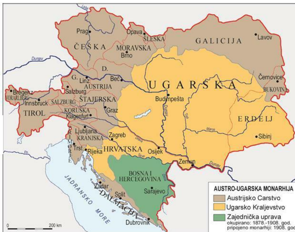
Prilog 7. Austro-Ugarska Monarhija nakon nagodbe 1867. godine

Sada, nakon sklopljene nagodbe, vlast u ovoj novoj državi dijelila se na austrijsku, ugarsku i zajedničku vladu kojom je predsjedao vladar. Zajednički poslovi rješavali su se preko zajedničke vlade ili "Ministarskog vijeća" kojem je predsjedao vladar, a u njegovoj odsutnosti ministar vanjskih poslova, kojeg je vladar imenovao predsjednikom vijeća. Ministarsko vijeće sastojalo se od ministra vanjskih poslova, ministra financija i ministra vojnih poslova. Delegacije obiju vlada bi se sastajale jednom godišnje, jednu godinu u Beču, jednu u Pešti, kako bi odredile proračun za Ministarsko vijeće. Ministar vanjskih poslova imao je mogućnost predlaganja ministra financija, međutim prema nepisanom pravilu on je morao biti iz drugog dijela monarhije. Dakle, ako je ministar vanjskih poslova bio iz Austrije, ministar financija morao je biti iz Ugarske. Posljednji član Ministarskog vijeća, ministar vojnih poslova, nije podlagao ovom pravilu s obzirom na to da je sam vladar bio vrhovni zapovjednik vojske te ministar vojnih poslova nije bio neophodan. 37