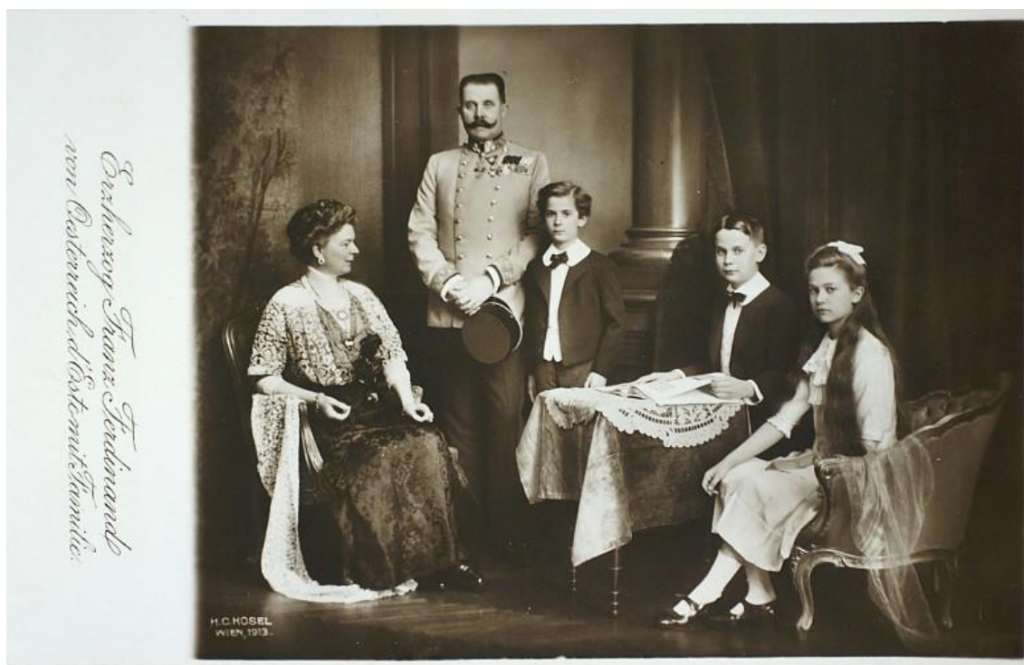
Prilog 14. Franjo Ferdinand sa svojom obitelji, razglednica 1913.

Nakon njegovog vjenčanja odnos Franje Ferdinanda i njegovog ujaka bio je još gori, međutim osobne nesuglasice su prešle i na nesuglasice u sferi upravljanja državom. Franjo Ferdinand postajao je nestrpljiv, a Franjo Josip nije bio spreman podijeliti političku moć s nikim pa niti sa svojim nasljednikom, isto je bilo i s Rudolfom. Upravo zato Franjo Josip je za svog nećaka odredio vojnu karijeru u kojoj je Franjo Ferdinand brzo napredovao tako da je do 1913. dobio čin generala inspektora. Franjo Josip je smatrao kako je Monarhija previše kompleksna i ranjiva da bi se mogle donositi stroge mjere, a Franjo Ferdinand je vjerovao suprotno, kako ju jedino to može spasiti. Niz nesuglasica i razlike u karakteru su sprječavale ujaka i nećaka da se često viđaju. Možda je najbolji primjer njihovih različitih karaktera pristup lovu svakog od njih. Franjo Josip je lov doživljavao kao opuštajuće iskustvo, nešto što je radio kao razbibrigu. Franjo Ferdinand je, pomalo zabrinjavajuće, postao vrlo agresivan u lovu, kao da je imao žudnju za krvoprolićem, osim toga bio je vrlo nepovjerljiv prema svojoj habsburškoj obitelji. 81