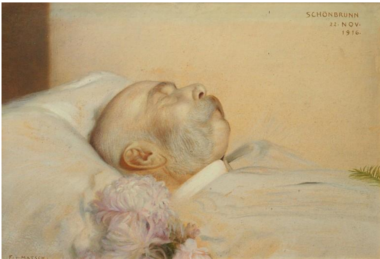
Prilog 16. Franz von Matsch: Franjo Josip na smrtnoj postelji, ulje na platnu, 1916.