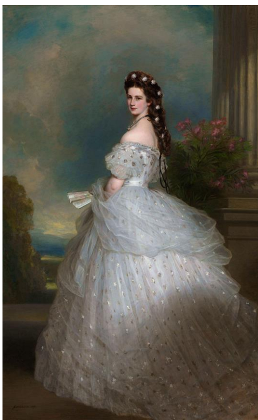
Prilog 11. Franz Xaver Winterhalter: Carica Elizabeta u večernjoj haljini s dijamantnim ukrasima u obliku zvijezda u kosi, ulje na platnu 1865.

Prvih nekoliko godina braka moglo bi se reći da je bilo sretno u usporedbi s ostatkom. Iako je Elizabeta bila nesretna, melankolična i osjetljiva, na to je najviše utjecala njezina svekrva, Sofija. Sofija je smatrala kako se Elizabeta ne zna ponašati i kako je upravo ona ta koja joj treba pokazati i pružiti joj dodatno obrazovanje. Elizabeta ovo nije tako shvaćala, već se osjećala napadnutom i neshvaćenom. Uz sve spomenuto Elizabeta je podarila Franji Josipu troje djece u ovom razdoblju. Prva kćer Sofija je rođena 1855., druga kćer Gisela 1856. i sin Rudolf je rođen 1858. godine.