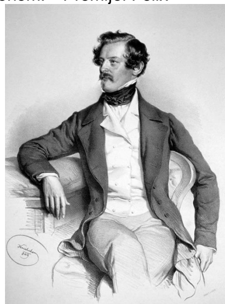
Prilog 5. Barun Alexander von Bach

S novim carem nastupalo je i novo razdoblje. Kako bi se okružio ljudima od povjerenja Franjo Josip trebao je nove ministre. Grofu Stadionu, ministru unutarnjih poslova je nakon donošenja ožujskog ustava 1849. počelo opadati mentalno zdravlje. Stadion se ovim ustavom želio boriti protiv federalizma krunskog plemstva time da je integrirao lokalnu autonomiju i samoupravu u centralnu administraciju te je primijenio koncept građanstva tako da svi građani, bez obzira iz kojeg djela Monarhije, budu jednaki pred zakonom. 12 Premijer Felix Schwarzenberg imenovao je Alexandera Bacha za ministra unutarnjih poslova, baruna Karla von Brucka za ministra financija te Antona von Schmerlinga za ministra pravosuđa, međutim on 1851. daje ostavku zbog baruna Karla von Kübecka koji je izbacio sve predstavničke odredbe iz Stadionovog ustava. 13