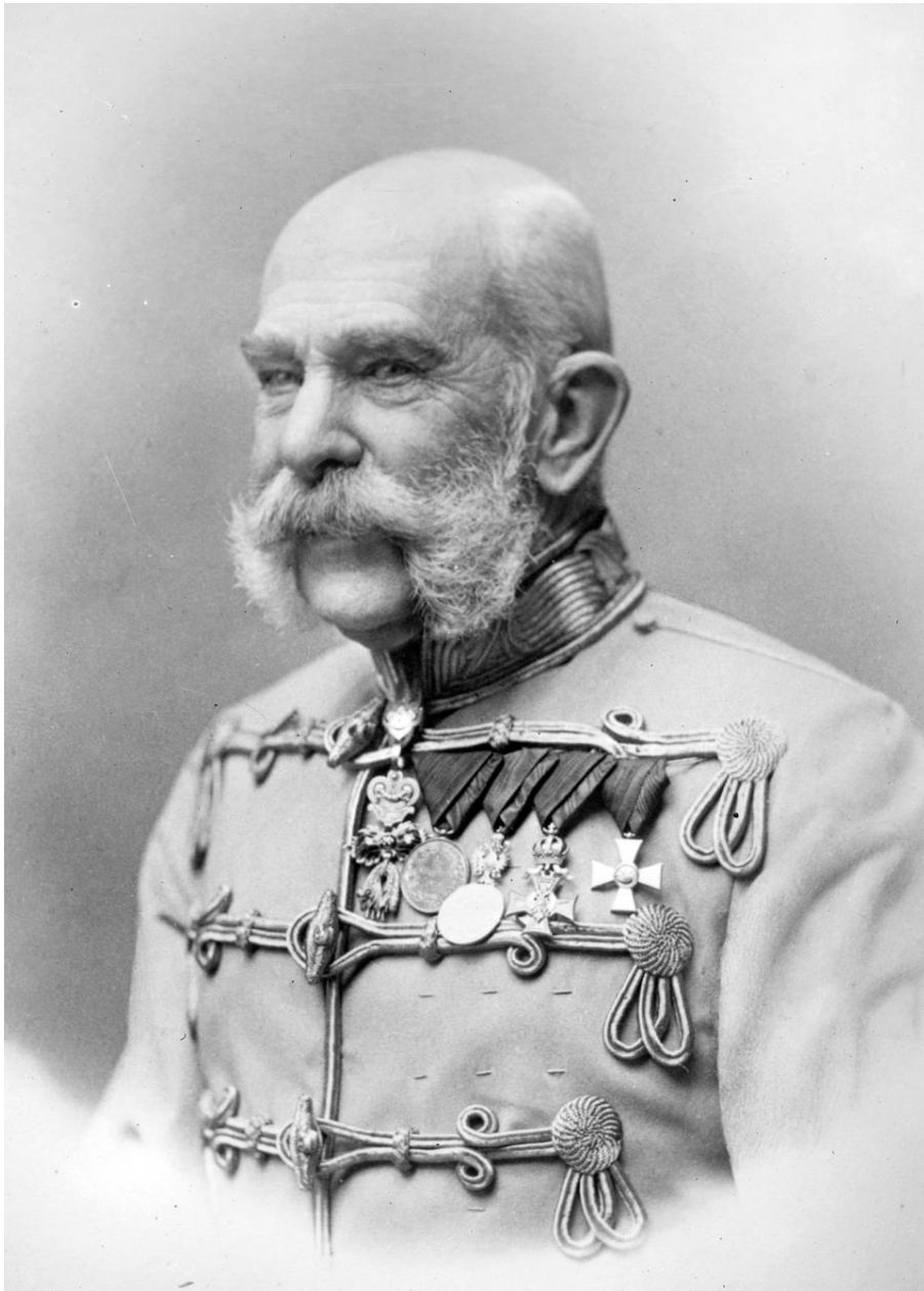
Prilog 1. Franjo Josip I.