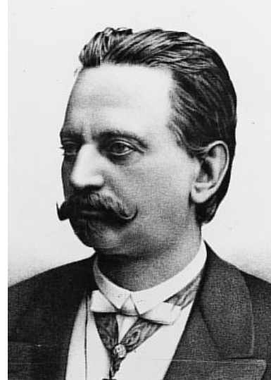
Prilog 8. Grof Eduard Taaffe

Tijekom 1870-ih politička stranka koja je dominirala u austrijskom parlamentu bili su njemački liberali. Franjo Josip se pomalo povukao iz unutrašnjih poslova, predao je više ovlasti parlamentu i ministrima. Liberali su 1879., na čelu s Eduardom Herbstom, izglasali protiv okupacije Bosne, što Franjo Josip nije mogao tolerirati. Vanjska politika je još uvijek bila itekako njegovo područje i zbog toga je grofa Eduarda Taaffe postavio na mjesto premijera, time sprječavajući liberale da ponovno imaju većinu. Taaffe je osnovao konzervativnu koaliciju s poljskim i češkim političarima, od kojih su dosta njih prije radili u birokraciji, a sada su dobivali položaje ministara. Taaffeova vlada održala se četrnaest godina, od 1879. do 1893. te preživjela mnoge promijene u austrijskom političkom krugu, kao i u samoj državi. 42