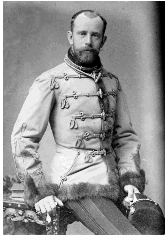
Prilog 13. Prestolonasljednik Rudolf, oko 1880.

priopćila vijest da je njihov jedini sin i njegov nasljednik počinio samoubojstvo zajedno sa svojom ljubavnicom, sedamnaestogodišnjom barunicom Marijom Vetserom, u lovačkoj kući u Mayerlingu. Iako je ovo šokiralo Franju Josipa, promijenilo mu život, bilo je i prije naznaka, znakova kako mladi princ nije u dobrom duševnom ni fizičkom stanju. Naime, Rudolf je obrazovan podosta liberalno, a nikada nije osjećao toplinu obitelji. Njegova majka je često putovala i zanemarivala ga, a njegov otac je bio previše zaokupljen svojim dužnostima. Rudolf se osjećao kao stranac na konzervativnom dvoru svoga oca i zbog toga što nije bio upućen u svakodnevne političke događaje osjećao se neuspješnim. Njegovo psihičko stanje se nije popravilo ni nakon vjenčanja s belgijskom princezom Stephanie i rođenja njihove kćeri Elisabeth 1883. te je i dalje imao ljubavnice. Na početku 1887. se zarazio spolnom bolešću, koju je prenio i na