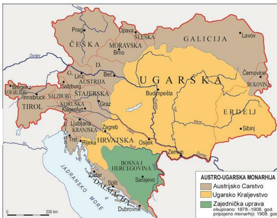
Prilog 7. Austro-Ugarska Monarhija nakon nagodbe 1867. godine

Sada, nakon sklopljene nagodbe, vlast u ovoj novoj državi dijelila se na austrijsku, ugarsku i zajedničku vladu kojom je predsjedao vladar. Zajednički poslovi rješavali su se preko zajedničke vlade ili "Ministarskog vijeća" kojom je predsjedao vladar, a u njegovoj odsutnosti ministar vanjskih poslova, kojeg je vladar imenovao predsjednikom vijeća. Ministarsko vijeće sastojalo se od ministra vanjskih poslova, ministra financija i ministra vojnih poslova. Delegacije obje vlade bi se sastajale jednom godišnje, jednu godinu u Beču, jednu u Pešti, kako bi odredile proračun za Ministarsko vijeće. Ministar vanjskih poslova imao je mogućnost predlaganja ministra financija, međutim prema nepisanom pravilu on je morao biti iz drugog dijela monarhije. Dakle, ako je ministar vanjskih poslova bio iz Austrije, ministar financija morao je biti iz Ugarske. Posljednji član Ministarskog vijeća, ministar vojnih poslova, nije podlagao ovom pravilu s obzirom na to da je sam vladar bio vrhovni zapovjednik vojske te ministar vojnih poslova nije bio neophodan. 37