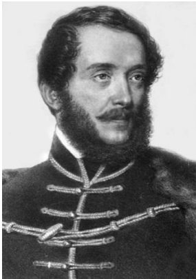
Slika 2.: Lajos Kossuth

Oktroj u Banskoj Hrvatskoj u srpnju i kolovožu. 29 Jelačić je u više navrata zamjerao novinama Slavenski Jug zbog prenošenja lažnih informacija o njegovim pohodima u Mađarskoj i zbog širenja buntovničkih ideja pod izlikom o samostalnosti i nezavisnosti Hrvatske od Mađarske. Bez obzira na to Jelačić se nije previše izjašnjavao u vezi hrvatskog tiska. 30