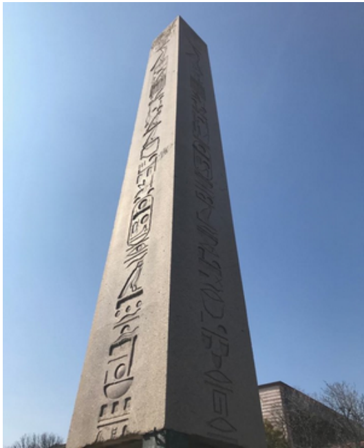
Slika 5: Obelisk u Istanbulu (Mariam Abdelghani, 9. ožujak 2018.)

Postolje ovog obeliska izrađeno je u vrijeme postavljanja na sadašnje mjesto, u dva dijela. Gornji dio postolja u reljefu prikazuje cara Teodozija s obitelji i svitom u kraljevskoj loži na hipodromu kako gledaju konjske utrke, a donji dio prikazuje postavljanje obeliska na hipodrom (slika 6).