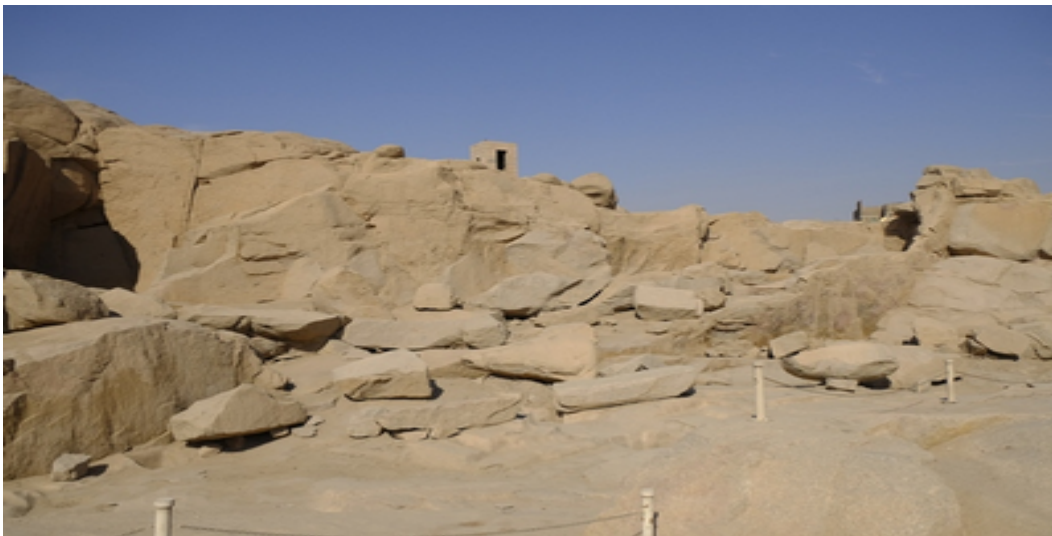
Slika 3: Kamenolom pokraj Asuana (Hassan Abdelghani, 7. ožujak 2019.)

Egipćani su cijenili veličinu monolita. Ako veliki blokovi izvađeni iz kamenoloma ne bi bili savršeni u veličini ili formi, ipak bi ih koristili za originalnu svrhu te ih oblikovali najbliže zamišljenoj formi. 18 Tako su mnogi obelisci i postolja na kraju bila nesavršena. Nedostatke su prekrivali metalnim pokrovima.