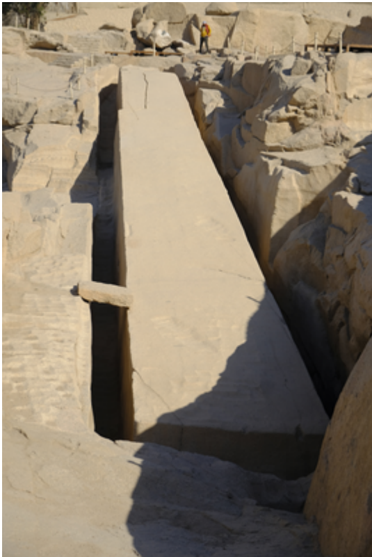
Slika 4: Nedovršeni obelisk u Asuanu (Hassan Abdelghani , 7. ožujak 2019.)

pukotina vidljiva pri vrhu, kako se do sada mislilo, nego sama dimenzija obeliska. Zbog dužine i težine preko 1000 tona bilo bi nemoguće prevesti i uspraviti toliki obelisk. Sa svih strana vidljive su valovite oznake obrade. 28 Najveći je to obelisk koji su Egipćani pokušali napraviti. Stoljećima napušten i prekriven pijeskom tek je 1922. godine u potpunosti otkriven te od tada daje znanstvenicima bolji uvid u drevne tehnike iskapanja starih Egipćana.