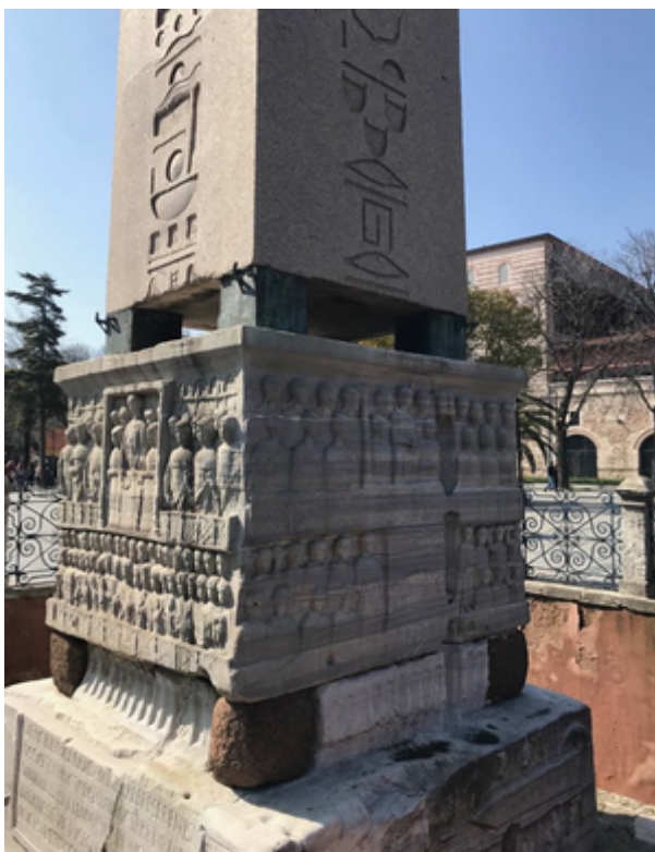
Slika 6: Postolje obeliska u Istanbulu (Mariam Abdelghani, 9. ožujak 2018.)

Postolje ovog obeliska izrađeno je u vrijeme postavljanja na sadašnje mjesto, u dva dijela. Gornji dio postolja u reljefu prikazuje cara Teodozija s obitelji i svitom u kraljevskoj loži na hipodromu kako gledaju konjske utrke, a donji dio prikazuje postavljanje obeliska na hipodrom (slika 6).