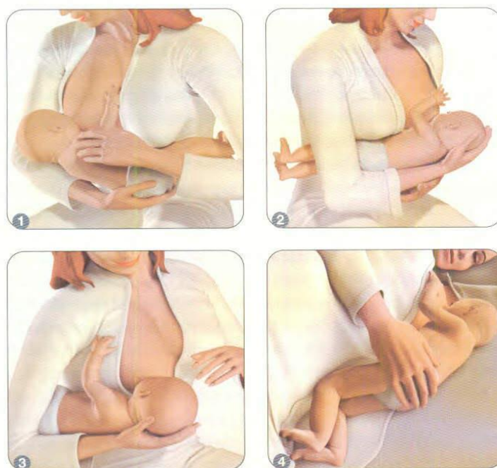
Slika 2. Pravilan položaj dojenja

Dijete koje je isključivo na majčinom mlijeku ne treba dodatno nikakvu tekućinu. Nakon buđenja gladno dijete obično počne mljackati, otvarati usta, stavljati prste u usta, okretati glavu i sl.