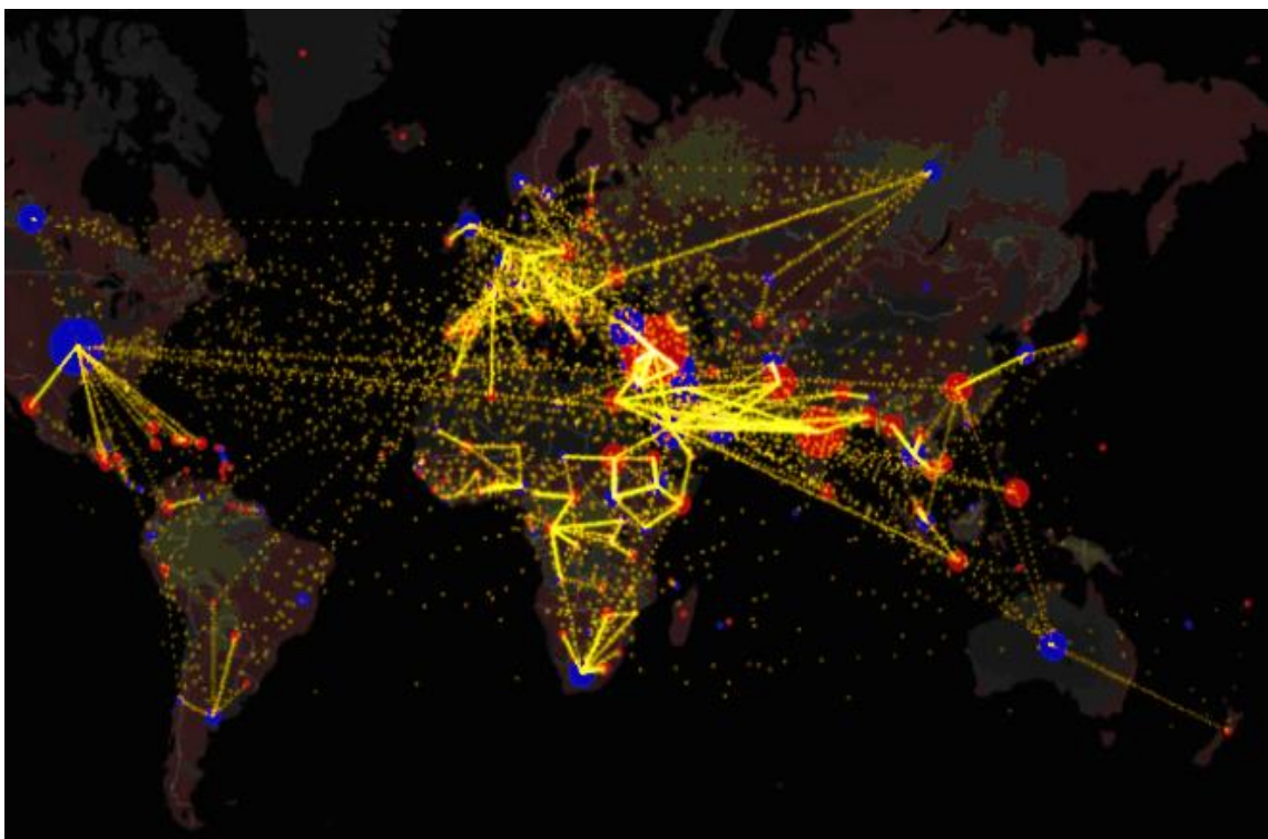
Slika 1.: Procjena neto migracija po porijeklu i destinaciji između 2010. i 2015. godine

Izvor: Svjetske migracije – na jednoj mapi , 2017., dostupno na: http://unijauprs.org/svjetske-migracije-na-jednoj-mapi/ (29.11.2018.)