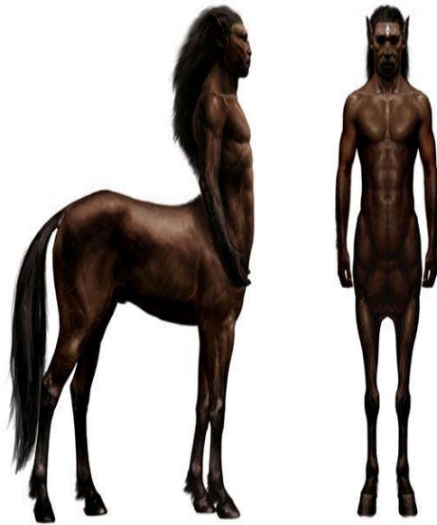
Slika 7. Kentaur (Centaur)

https://www.pottermore.com/features/behind-the-scenes-centaurs