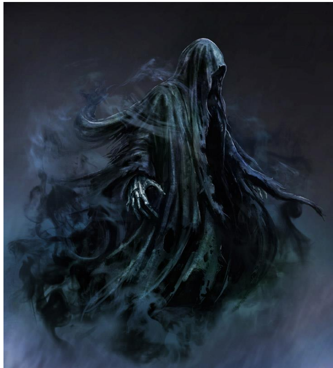
Slika 4. Dementor

https://harrypotter.fandom.com/wiki/Dementor