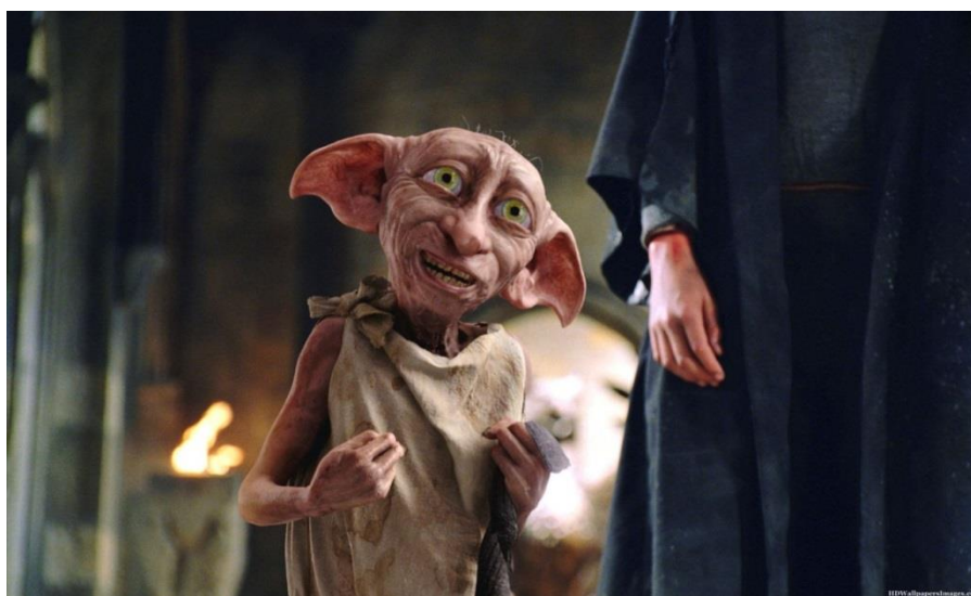
Slika 9. Vilenjak Dobby

https://harrypotter.fandom.com/wiki/Dobby