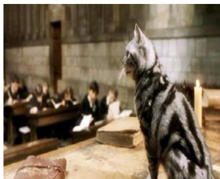
Slika 2. Minerva McGonagall- Animagus

https://harrypotter.fandom.com/wiki/Animagus