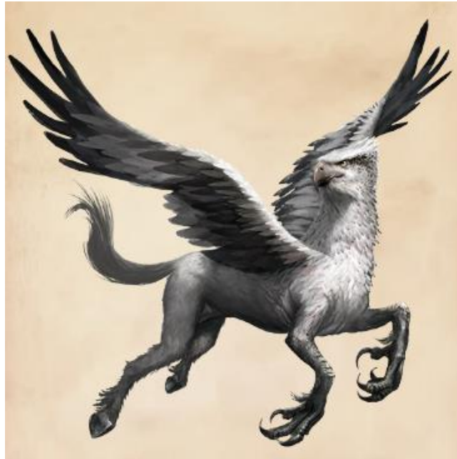
Slika 6. Hipogrif

https://harrypotter.fandom.com/wiki/Hippogriff