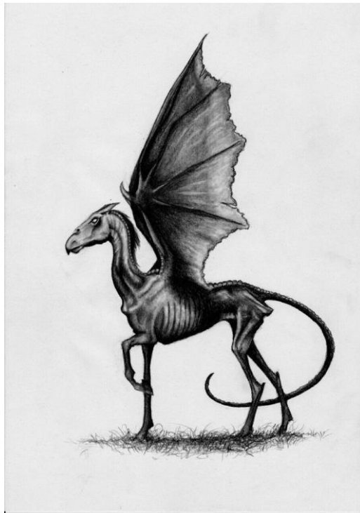
Slika 8. Testral (Thestrals)

https://harrypotter.fandom.com/wiki/Thestral