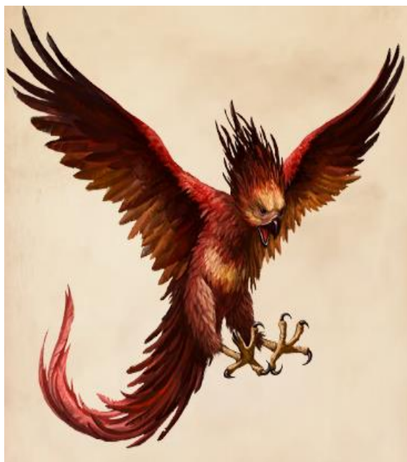
Slika 5. Feniks (Phoenix)

https://harrypotter.fandom.com/wiki/Phoenix