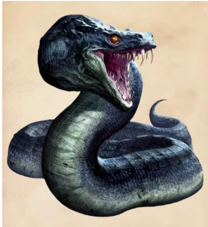
Slika 3. Bazilisk (Basilisk)

https://harrypotter.fandom.com/wiki/Basilisk