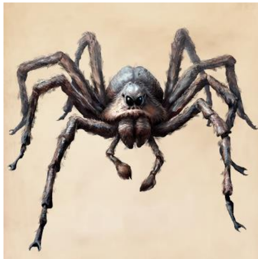
Slika 1. Akromantula https://harrypotter.fandom.com/wiki/Acromantula