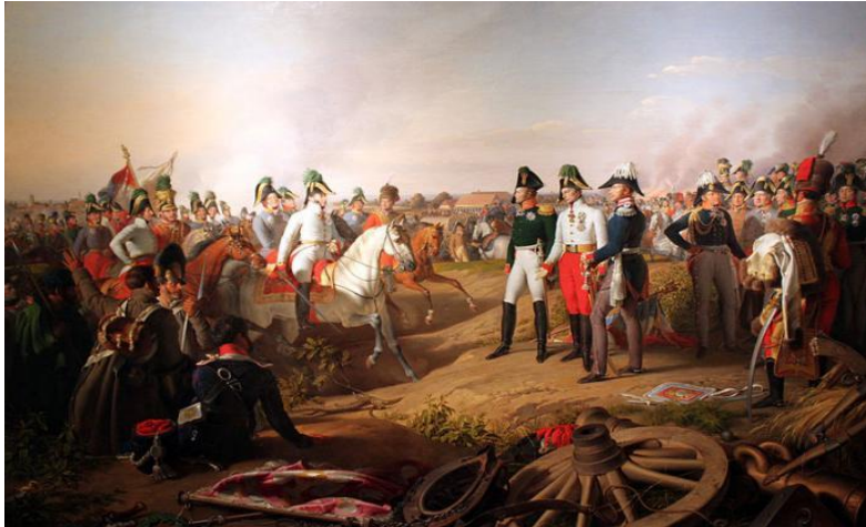
Slika 3. Prikaz Bitke naroda kod Leipziga 1813. Napoleona Bonapartea