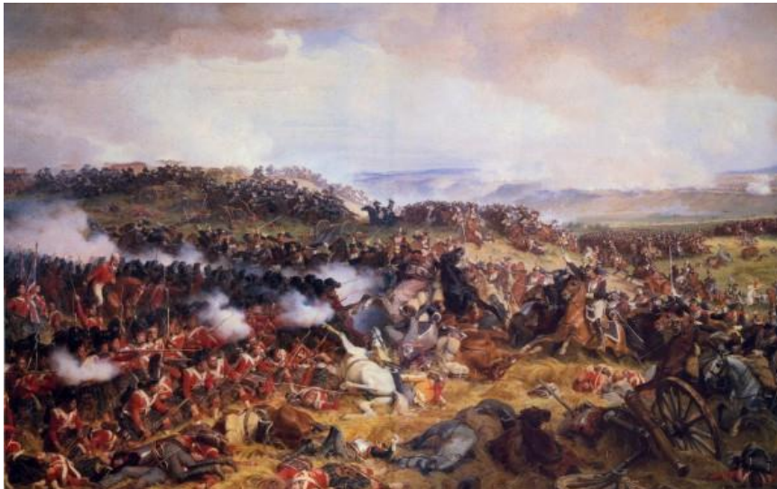
Slika 4. Prikaz bitke kod Waterlooa