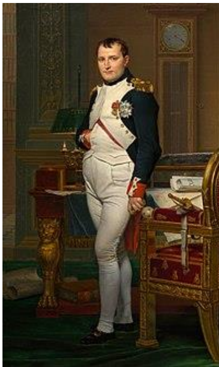
Slika 2. Portret