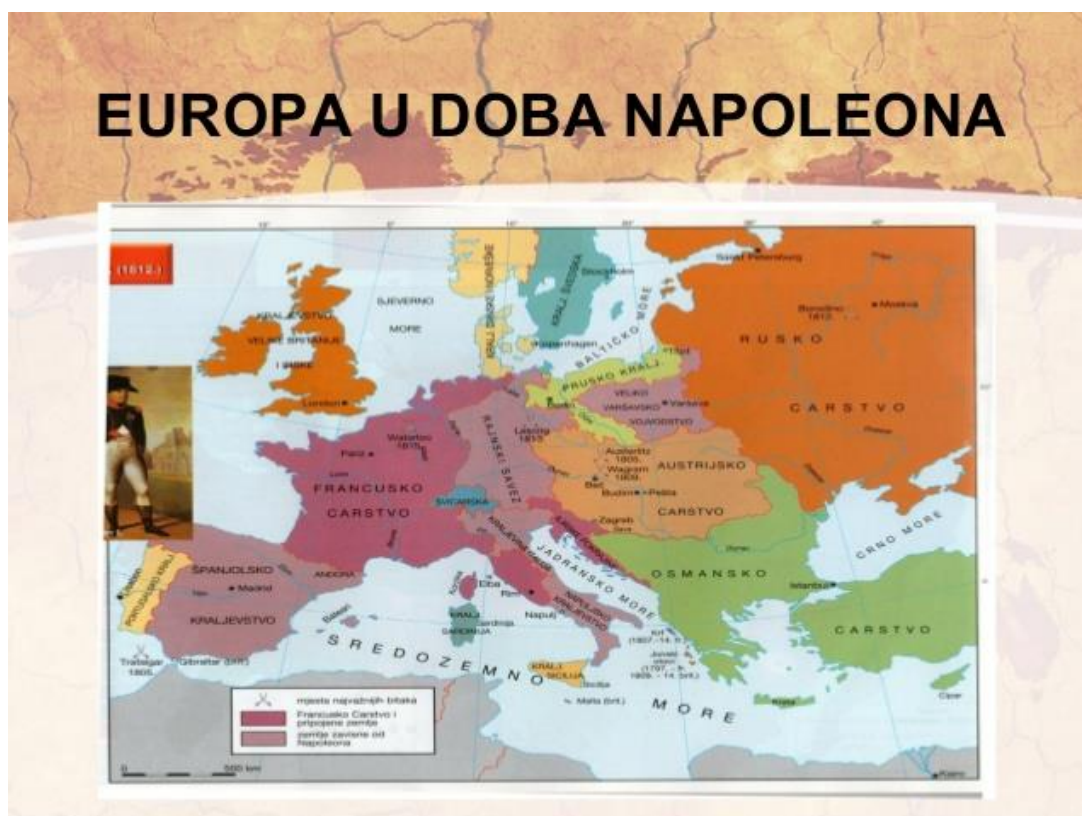
Slika 5. Prikaz karte Europe i Napoleonovih osvojenih teritorija, 1812.