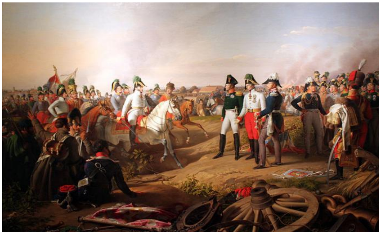
Slika 3. Prikaz Bitke naroda kod Leipziga 1813. Napoleona Bonapartea