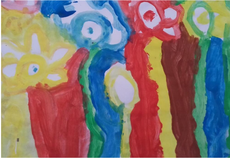
Slika 5. Tempere

„Teta sviđa li ti se? Nacrtała sam veliko cvijeće i sunce, moja najdraža boja je žuta.“ djevojčica ( 4,10 god)