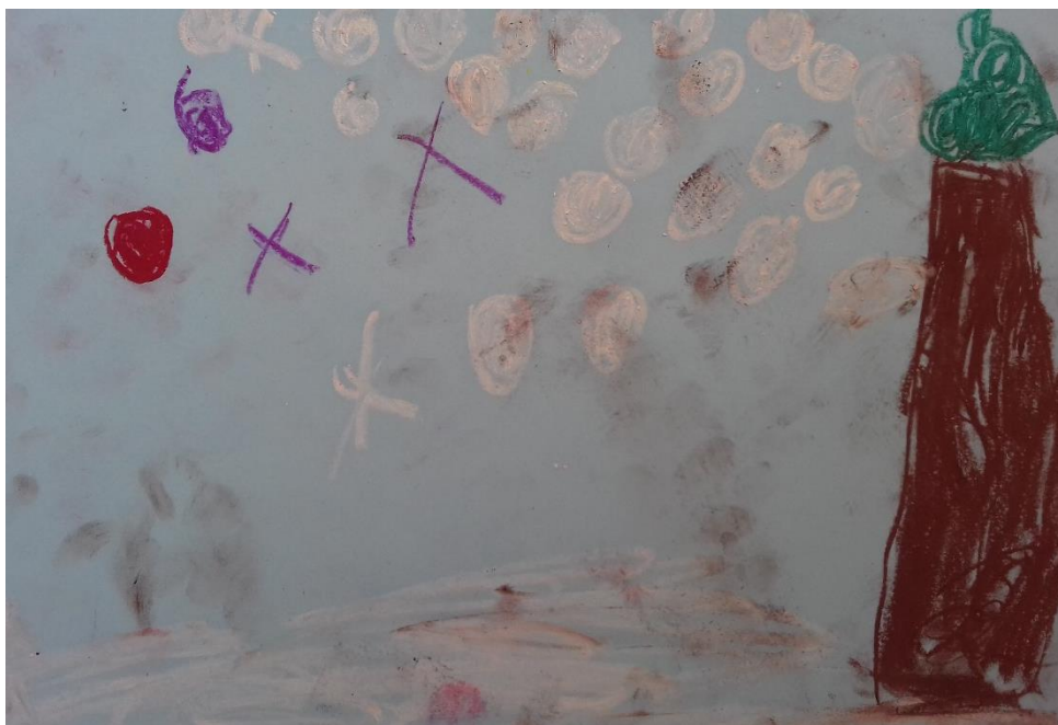
Slika 16. Pastela

„Nacrtala sam snijeg, kišu, pahuljice.“ djevojčica (4,2 god)