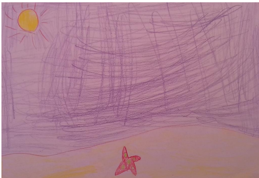
Slika 7. Drvene bojice „Nacrtao sam zvijezdu u moru i more.“ dječak (6,2 god)