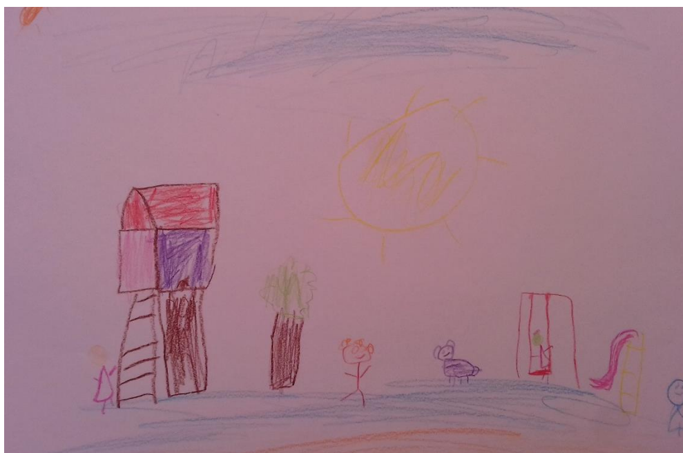
Slika 8. Drvene bojice „Ovdje sam ja i moje prijateljice na plaži, tu je i tobogan i ostala djeca, na plaži je i pas, tu je i sunce i oblak.“ djevojčica (5,5 god)