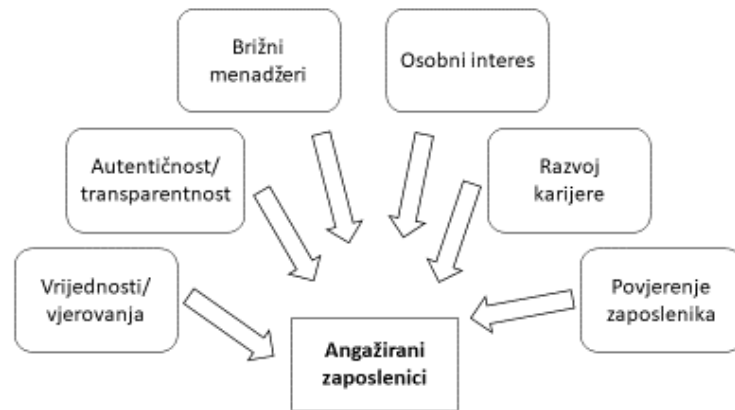
Slika 2.: Ezzelovi pokretači angažiranosti