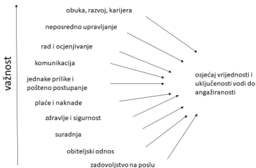
Slika 1: IES-ov model angažiranosti