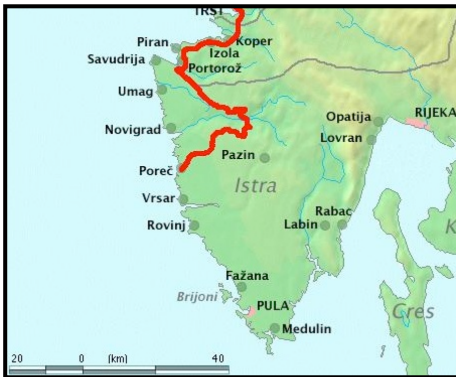
Foto 2. Il percorso della Porenzana ( https://it.wikipedia.org/wiki/Ferrovia_Parenzana )

La Porenzana era la ferrovia che collegava Trieste con Parenzo con varie fermate. Era in funzione dal 1902 al 1935. Il percorso principale andava da Trieste a Buie (59 km) e da Buie a Parenzo (64 km). Oggi parte del percorso della vecchia ferrovia è