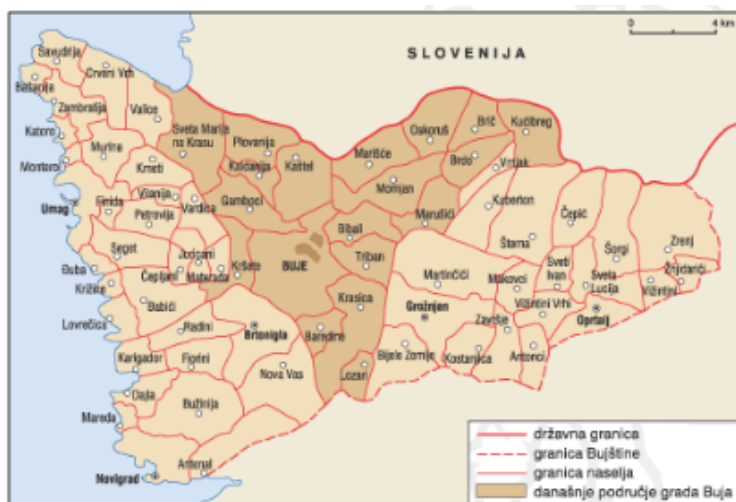
Foto 1. Carta geografica del Buiese (Enciclopedia Istriana, 2005, Zagreb, Leksikografski zavod Miroslav Krleža, urednici: Miroslav Bertoša i Robert Matijašić), consultato in data 01 Novembre 2019, http://istra.lzmk.hr/