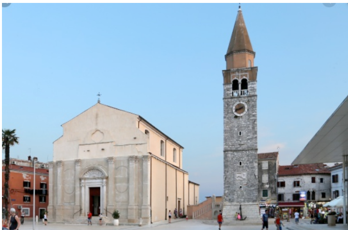
Foto 5. – Il duomo di Umago e il campanile ( https://bs.wikipedia.org/wiki/Datoteka:Umago,_chiesa_di_santa_maria_maggiore,_01.jpg )

Tra gli edifici più importanti di Umago vanno menzionate: la chiesa di San Rocco, le mura cittadine, il Duomo dedicato all'Assunzione di Maria e la chiesa di San Pellegrino, protettore della città, la diga che chiude il porto di Umago, lunga 404 metri.