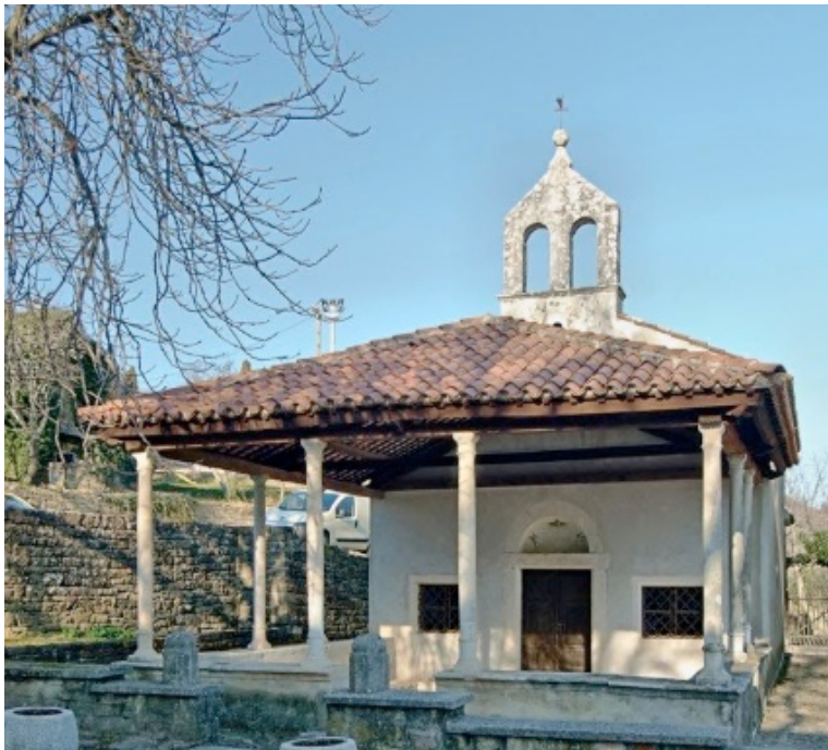
Foto 4. Cappella di SS. Cosma e Damiano con la loggia

Dei monumenti importanti per Grisignana bisogna menzionare la loggia che risale al periodo rinascimentale (1587), il Palazzo Spinotti che fa parte dell'architettura barocca, Il duomo di S. Vito, Modesto e Crescenza che venne costruito nel 1600 e ristrutturato nel 1770, la cappella dei santi Cosma e Damiano con la loggia risalente al 1554.