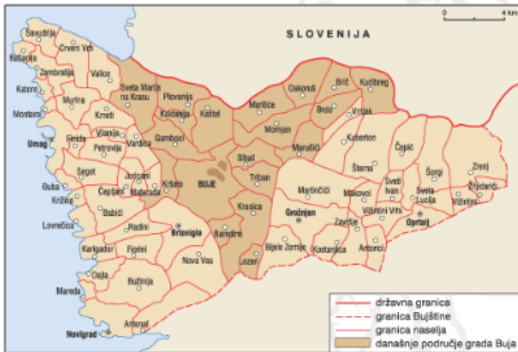
Foto 1. Carta geografica del Buiese (Enciclopedia Istriana, 2005, Zagreb, Leksikografski zavod Miroslav Krleža, urednici: Miroslav Bertoša i Robert Matijašić), consultato in data 01 Novembre 2019, http://istra.lzmk.hr/