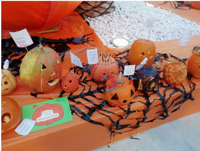
Foto 10: La mostra delle zucche di Halloween organizzata dalla comunità degli italiani di Umago, ottobre 2019 (foto scattata personalmente durante il festeggiamento della festa di Halloween)

piatti a base di zucca come le frittelle, la minestra di zucca, il risotto con la zucca e altro.