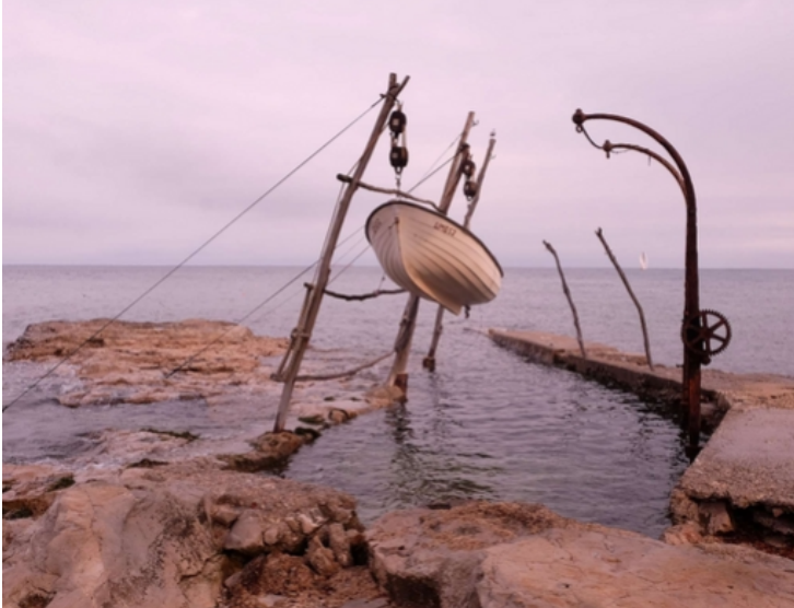
Foto 11: Le grue di Salvore

Le grue, come la battana e il faro di Salvore sono il segno di riconoscimento di questa zona che affascina i turisti. Un paio di grue ci sono anche a Umago nella zona di Moela.