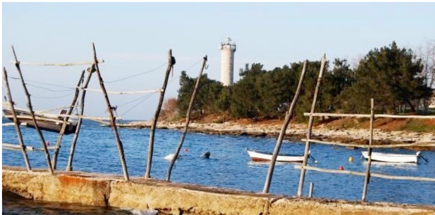
Foto 6: Le gru di Salvore e il faro ( https://www.arcipelagoadriatico.it/salvore-si-alla-tutela-della-batana-e-delle-gru/ )

Un altro segno che contraddistingue Salvore sono le gru per le barche. Queste gru sono un „ancoraggio“ per mettere in salvo le piccole barche in caso di maltempo. Con queste gru le barche vengono alzate o per meglio dire „appese“ sopra la superficie del mare. Per alzare le barche si usa un sistema con le corde che girano su delle carrucole. In origine i pali di sostegno erano di legno. Il legno usato era l'acacia, ma oggi si usano anche i pali di ferro (Fakin, 2002: 50) .