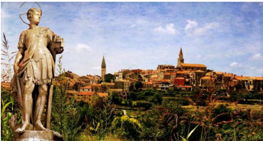
Foto 9: Buie e il suo patrono

Per San Servolo, sin dai tempi passati si mangiano i piselli (bisi), i carciofi e i “busolai”, tipico pane dolce. Da sempre le feste e le tradizioni popolari e religiose fanno parte del ricco patrimonio culturale popolare di Buie.