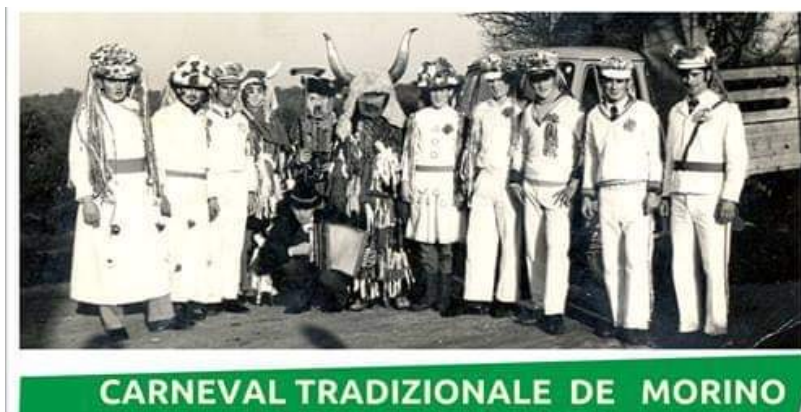
Foto 8: Carnevale tradizionale de Morino

Al Carnevale si legano molti proverbi e uno dei proverbi antichi me l'ha detto la signora Giovanna Zonta di Buie: