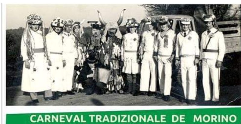
Foto 8: Carnevale tradizionale de Morino

Al Carnevale si legano molti proverbi e uno dei proverbi antichi me l'ha detto la signora Giovanna Zonta di Buie: