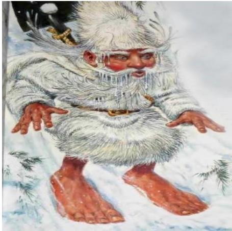
Slika 1. Patuljak Barbegazi