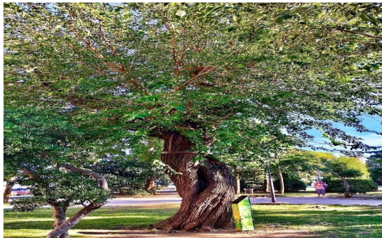
Slika 17. „Malikovo stablo“

(Izvor: https://www.holiday-link.com/hr/hrvatska/kvarner/crikvenica/parkovi-vrtovi )