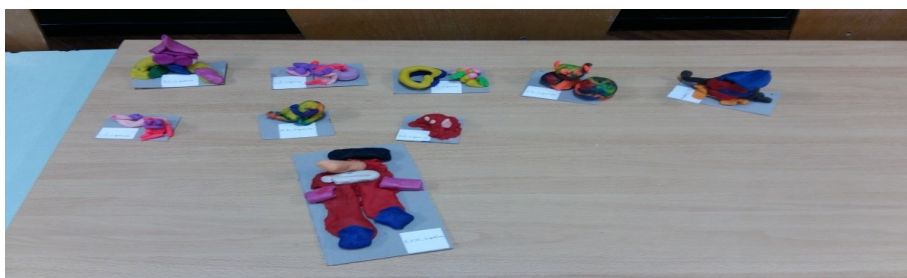
Slika 20. Dječja izrada patuljka Malika