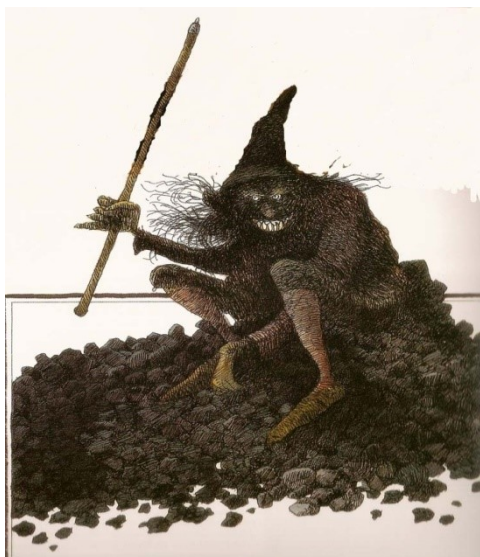
Slika 8. Patuljak Wichtlein

Patuljak Wichtlein dolazi iz Njemačke i sličan je „kučačima“. Za njega se vjeruje kako s tri jasna udarca predskazuje smrt rudara (Allen 2005: 24).