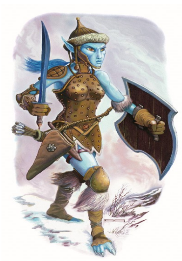
Slika 2. Patuljak Uldra