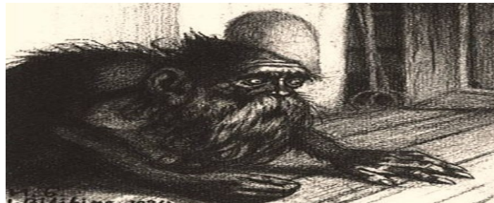
Slika 6. Patuljak Domovoy

Domovoy je patuljak iz Rusije i nastao je od riječi „dom“. Vjeruje se da izgleda kao mali dlakavi starac koji ponekad ima rep ili rogove, a živi iza ognjišta i zadužen je za blagostanje ukućana. Sličnog je ponašanja kao i patuljak Kobold. Predano radi za svoje kućanstvo sve dok ga nitko ne uznemirava (Allen 2005: 20).