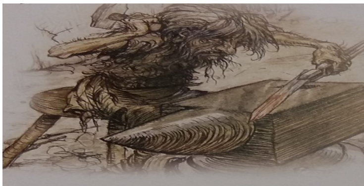
Slika 3. Patuljak Kucač ili udarač

U bivšim rudnicima kositra u Cornwallu, ugljenokopima Walesa i svim postojećim rudnicima sjeverne Europe patuljci se nazivaju „kucačima“ ili „udaračima“ jer s ljudima komuniciraju upravo kuckajući ili udarajući o zidove rudnika. Kada po istom mjestu kucaju više puta ukazuju na postojanje bogate žile, a bučnim kopanjem ili udaranjem upozoravaju ljude na opasnost od mogućih poplava ili urušavanja tunela (Allen 2005: 24).