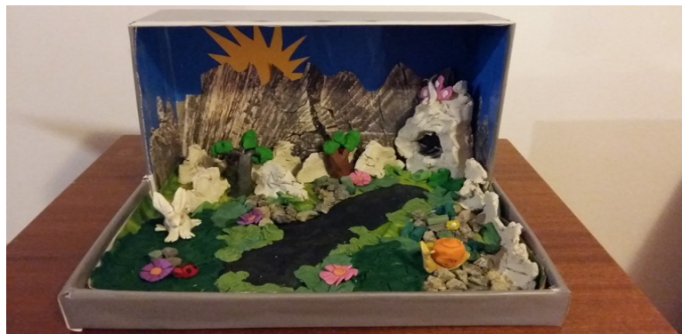
Slika 19. Špilja izrađena od plastelina u kojoj živi Malik

Legenda o Maliku zahvalna je za korištenje u različitim aktivnostima s djecom. U sklopu stručne prakse u vrtiću provela sam s djecom aktivnost u sklopu koje su se upoznali s likom Malika. Praktični dio povezan je s likovnom kulturom i cilj je bio da djeca savladaju oblikovanje pomoću plastelina na način da naprave patuljka Malika onako kako ga oni zamišljaju, i to nakon što im ispričam priču o njemu. I sama sam od plastelina izradila špilju u kojoj živi Malik i sve što se oko nje nalazi kako bi djeci što bolje dočarala priču. Djeca su bila oduševljena, a njihov doživljaj Malika bio je veoma maštovit. Tako je Malik čak završio i u svemiru, neki su ga ipak zamislili kao jako velikog, a neki su se pobrinuli i za to da Malik ne bude sam pa su oko njega napravili i neke životinje.