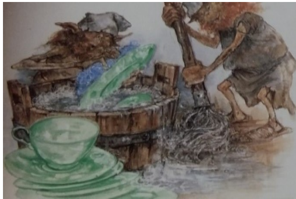
Slika 5. Patuljak Kobold