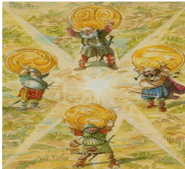
Slika 9. Patuljci Nordri, Sudri, Austri i Vestri