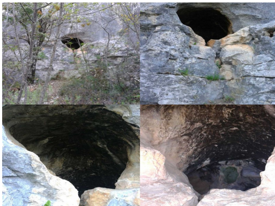
Slika 18. „Malikova školja“ koja se nalazi u šumi iznad moje kuće