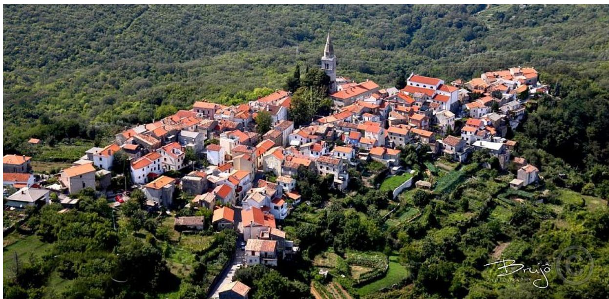
Slika 1: Pogled na Dobrinj 20