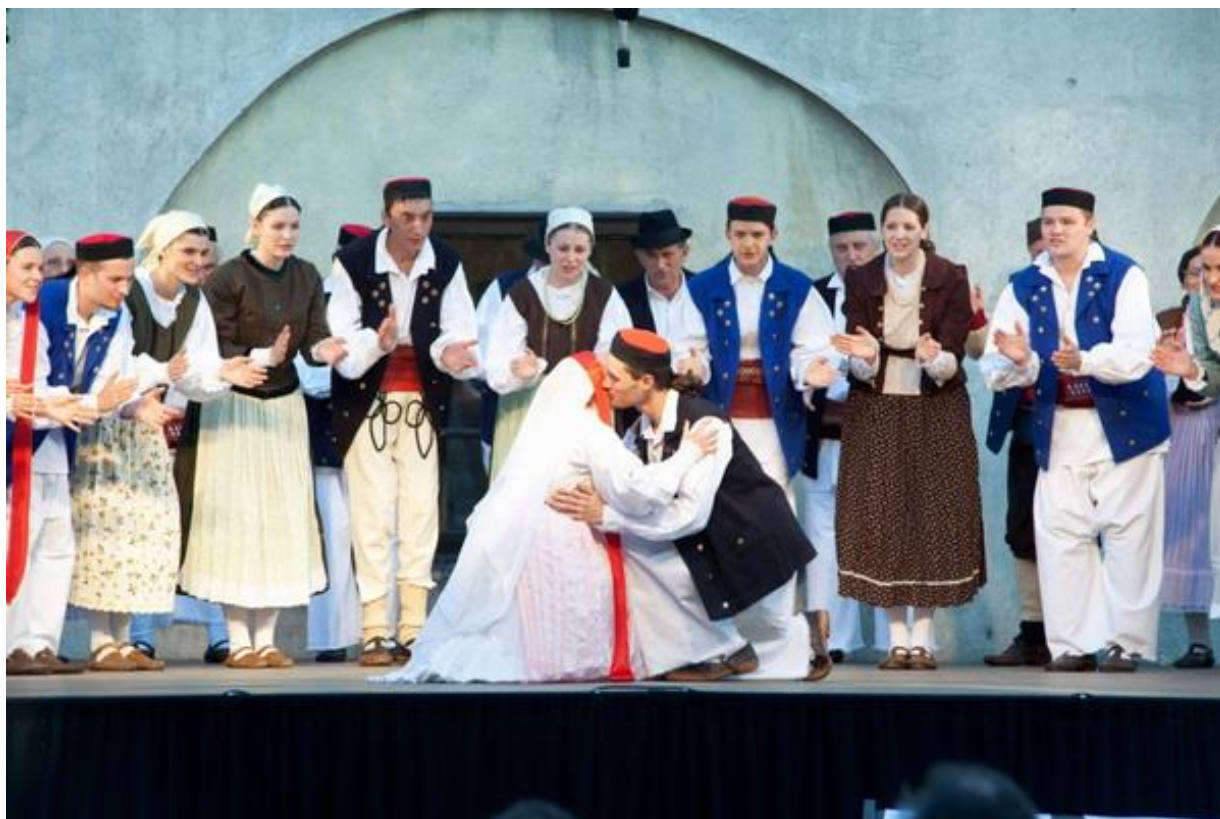
Slika 17. Nastup folklornog ansambla KUD-a Klek

Društvo poseban naglasak stavlja na duhovne pjesme pa KUD „Klek“ svake godine održava Božićni koncert na kojem izvodi preko 60 božićnih pjesama iz različitih krajeva Hrvatske (Službene stranice grada Ogulina, 2020). Jedan je od takvih nastupa zabilježen je na Slici 17 .