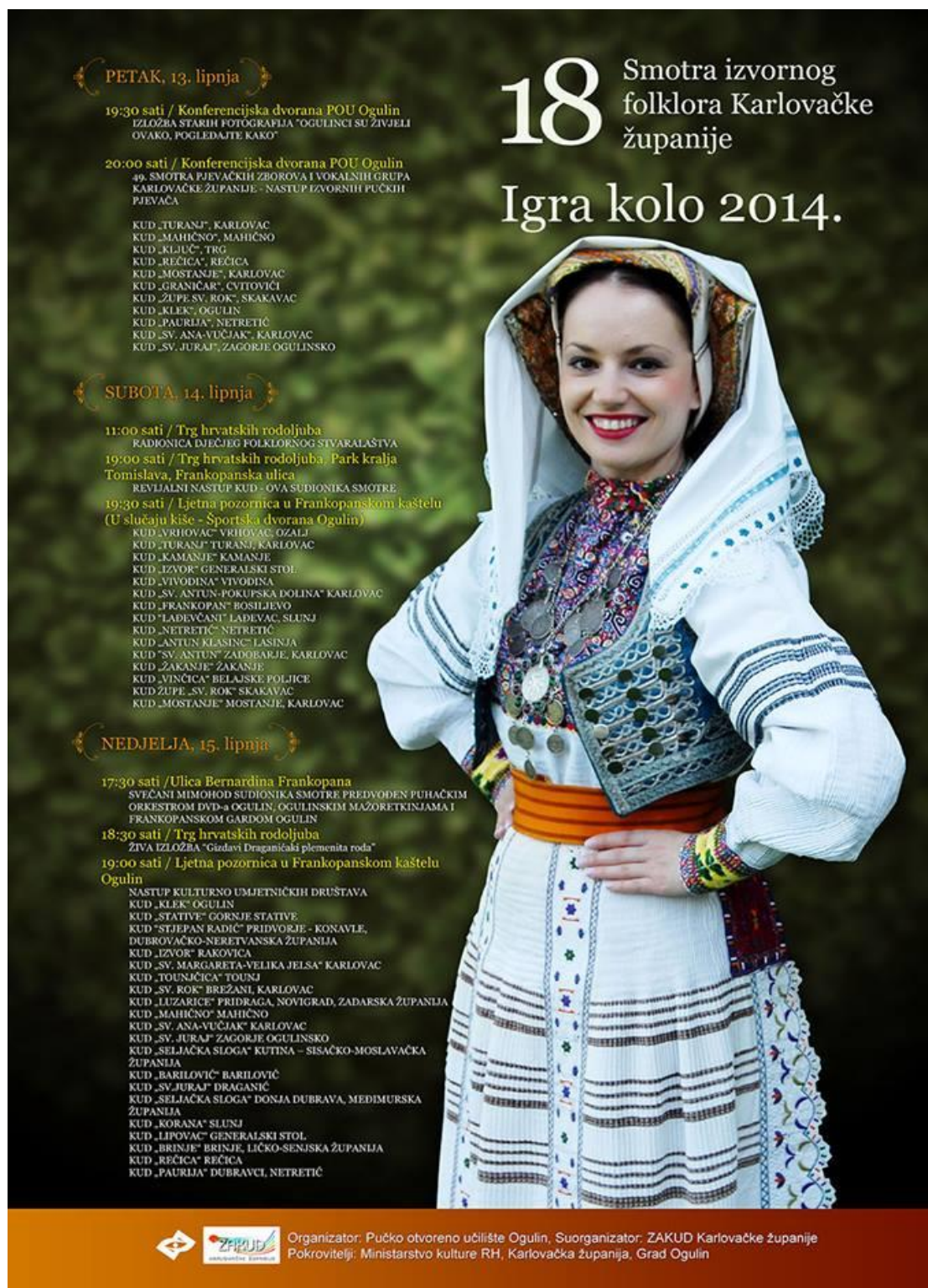
Slika 18. Plakat za Smotru izvornog folklor Karlovačke županije

su zaigrati stare pučke igre. Subota i nedjelja bile su rezervirane za svečani mimohod svih sudionika i njihov nastup (Ogportal, 2020).