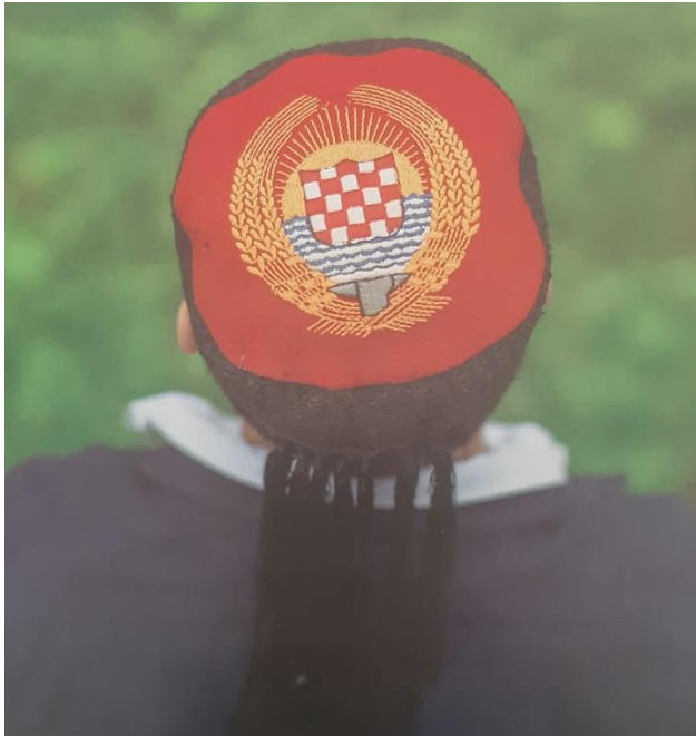
Slika 8. Crvenkapa (lička kapa)