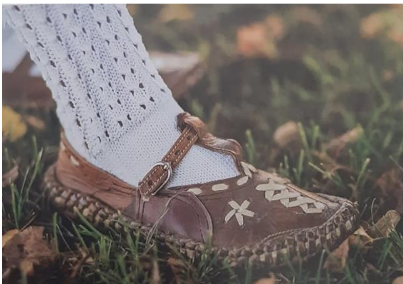
Slika 10. Ženska obuća