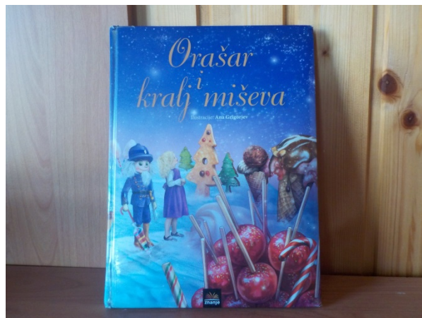
Slika 36. Slikovnica Orašar i kralj miševa