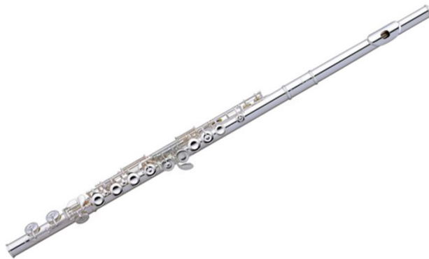
Slika 15. Fotografije instrumenata - flauta