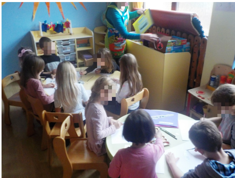
Slika 20. Likovno stvaralaštvo 1