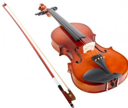
Slika 16. Fotografije instrumenata - violina