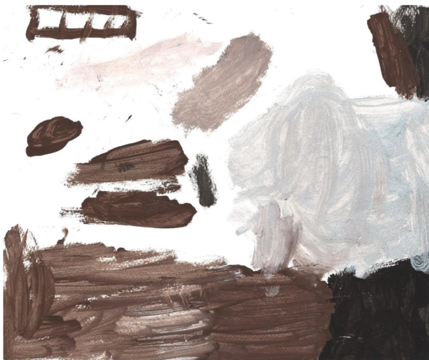
Slika 24. (K. K.)