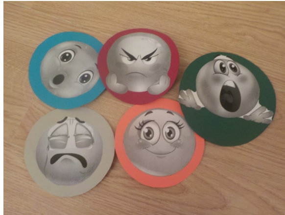
Slika 2. Emotikoni

zvuče jer on nije rodom iz Hrvatske već Rusije gdje su imena nešto drugačija od naših. Uslijedila je najava prvog slušanja skladbe. Prije početka slušanja, djeci sam podijelila kartone s tužnim, sretnim, ljutim, prestrašenim i iznenađenim emotikonima.