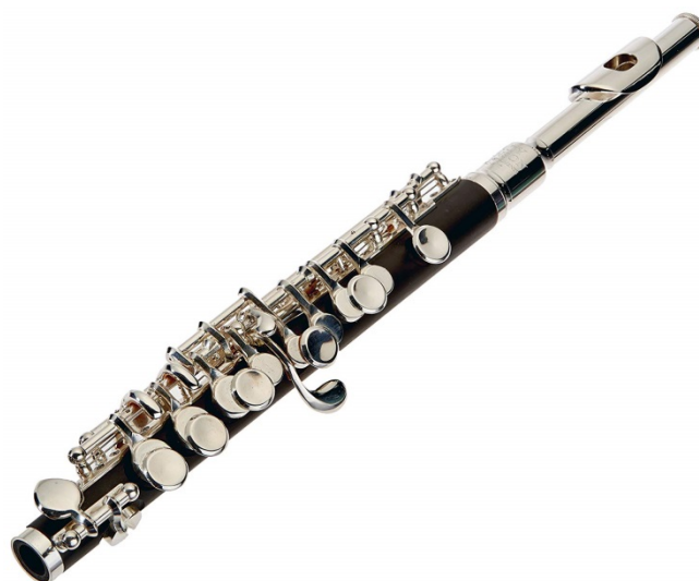
Slika 18. Fotografije instrumenata – piccolo

Ovaj način slušanja omogućio je povezivanje zvuka s izgledom instrumenta te smo se tako podsjetili flaute, violine i zvončića i upoznali s fagotom i piccolom. Za svaki od navedenih instrumenata pitala sam djecu zvuče li tonovi koje on svira visoko ili duboko što je poslužilo kao odličan uvod u igru iz sljedećeg dijela aktivnosti. A. A. je prepoznao violončelo, O. O. je, ugledavši i čuvši fagot, izjavio: „To je neka drugačija truba“, a A. A. „Puše i zrak ide gore i proizvodi zvukove. Svira duboke tonove“. M. M. je prepoznao flautu i visok zvuk njezinih tonova. T. T. je prepoznao violinu, a Š. Š. je ispod fotografije koju sam im pokazala pročitala piccolo. I. I., koji