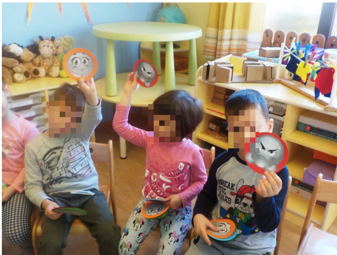
Slika 5. Glazbeni ugođaj 3

Smatram da bi prilikom sljedeće takve aktivnosti bilo dobro izbjeći opisani način izražavanja glazbenog ugođaja i zamijeniti ga verbalnim izražavanjem na kraju slušanja jer se korištenje emotikona pokazalo ometajućim za slušanje same skladbe. Po završetku slušanja potaknula sam djecu na verbalno izražavanje osjećaja koje je u njima pobudila skladba. Đ. Đ. je rekao da je njemu ova skladba zvučala tužno, Ć. Ć. se tijekom slušanja osjećala sretno, a K. K. je glazbu opisala kao strašnu, brzu i laganu. Ostala su djeca skladbu opisala kao povremeno sretnu i povremeno tužnu. Upitala sam zatim djecu što misle, za koji je dio priče Čajkovski namijenio ovu skladbu. Zaredali su se odgovori poput „Za priču o princezi Pirlipat“ i „Kada Marija tješi Orašara“. Tada sam im predstavila ime skladbe uz napomenu da je nju autor namijenio za ples cvijeća u Zemlji slatkiša. Djeci se svidjela ta interpretacija.