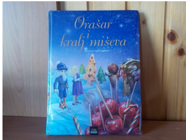
Slika 1. Slikovnica Orašar i kralj miševa

Provedbi aktivnosti Valcer cvijeća prethodilo je čitanje prepričane verzije priče Orašar i kralj miševa E. T. A. Hoffmanna u obliku slikovnice Gordane Maletić.