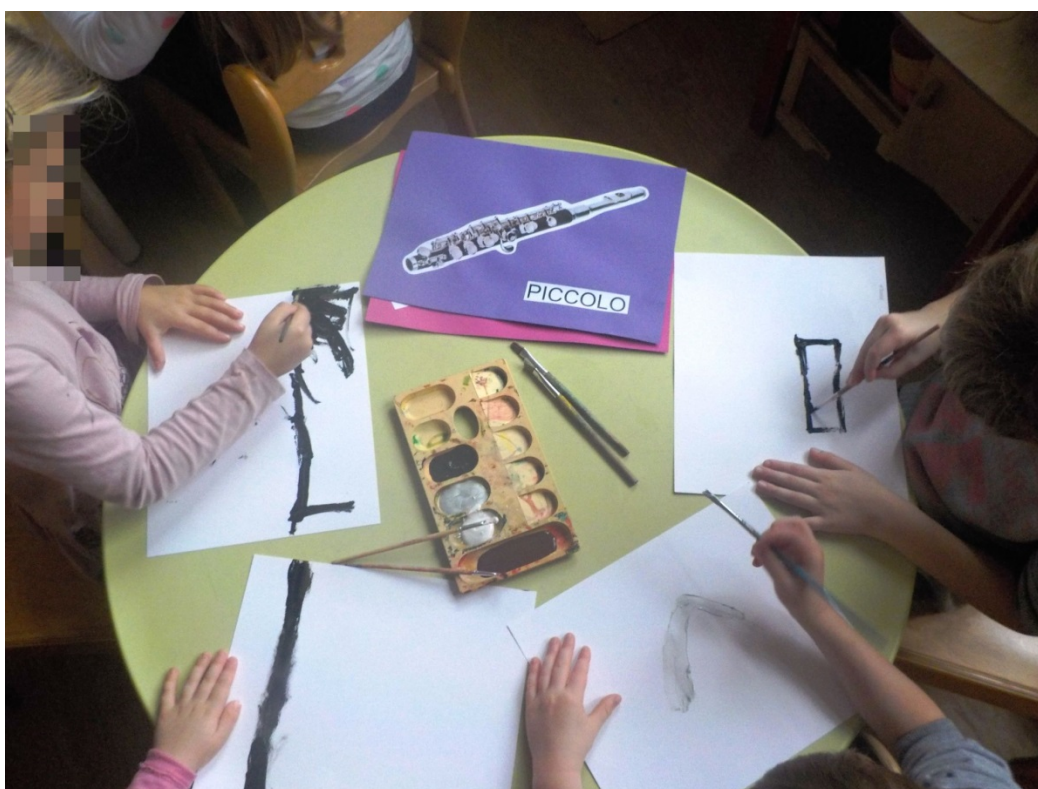
Slika 21. Likovno stvaralaštvo 2