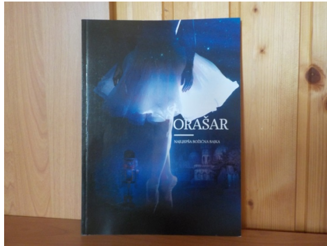
Slika 35. Monografija Orašar – najljepša božićna bajka