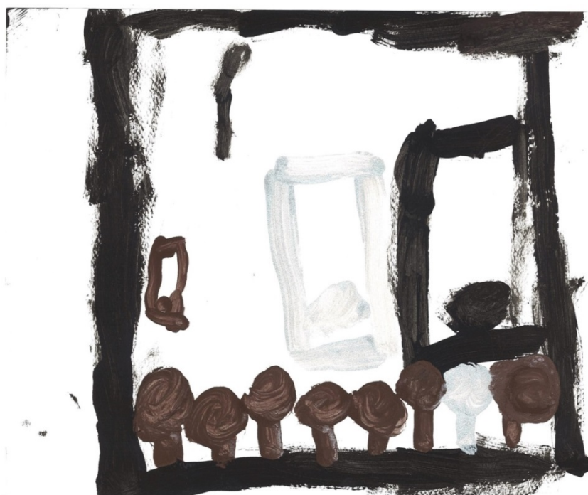
Slika 33. Zvončiči/ono što se lupa sa palicama (C. C.)