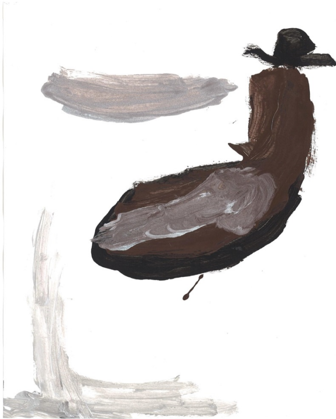
Slika 28. Violončelo (B. B.)