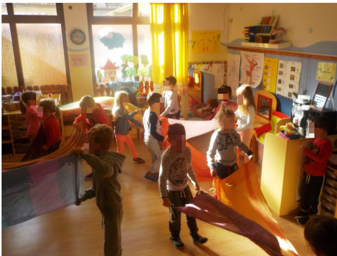
Slika 10. Plesno stvaralaštvo 1

Svakom paru dodijelila sam jedan šal te sam potaknula djecu na održavanje kontakta s parom pomoću šala, pritom i dalje plešući valcer na skladbu. Šalovi su u djeci potaknuli veću kreativnost i slobodu u pokretu. Radosno su plesala zaboravivši na vrijeme i trajanje aktivnosti. Pustila sam skladbu da svira dokle god je među djecom postojao interes za plesom. Č. Č. je tijekom plesa šal omotala oko sebe kao kod njegove prave upotrebe dok je Š. Š. iskoristila šal za samostalni okret prolaskom ispod rastegnutog šala.