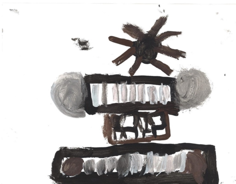
Slika 23. Sintisajzer/ klavir (Š. Š.)

Ponuđenom crnom, bijelom i smeđom temperom djeca su slikala instrumente na bijelom papiru. Kako bih im olakšala prisjećanje izgleda instrumenata, na stol sam im ponudila i fotografije instrumenata. Ovo su nastali radovi: