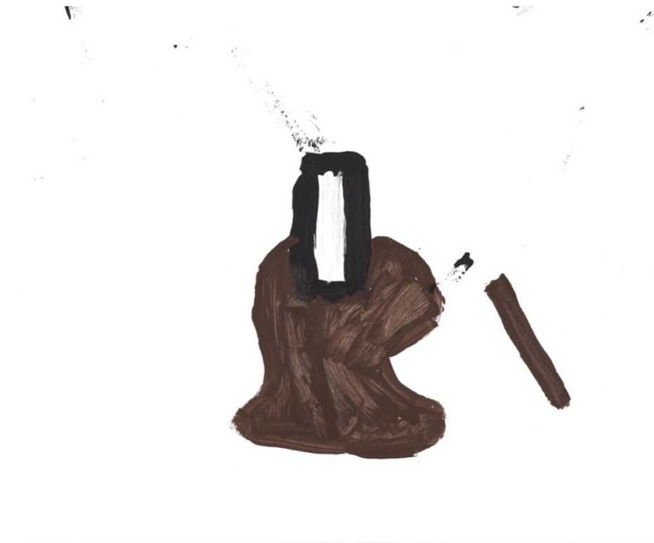
Slika 30. Violina (S. S.)