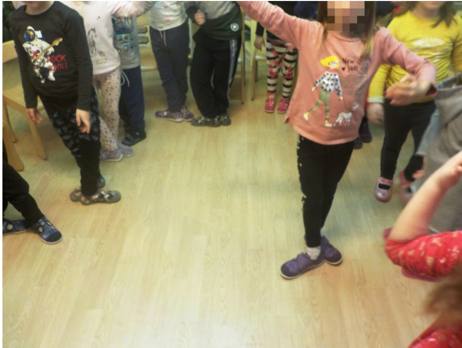
Slika 13. Baletne pozicije

baletnih pozicija stopala, a nakon što su negativno odgovorila na pitanje ponudila sam im da ih zajedno naučimo. Radnosno su ustala i započeli smo s isprobavanjem pozicija. Već nakon prve pozicije Š. Š. se prisjetila ostalih četiri te je demonstraciju dalje nastavila ona. Ostala su je djeca pratila u izvedbi, a ona je na kraju izjavila: „To nije uopće teško“. Tijekom cijelog uvodnog dijela aktivnosti djeca su svjesno i pažljivo pratila i aktivno sudjelovala.