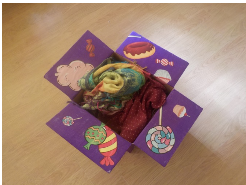
Slika 9. Kutija iz Zemlje slatkiša

Za završni dio plesa, u sredinu prostorije postavila sam kutiju iz Zemlje slatkiša prepunu šarenih šalova.