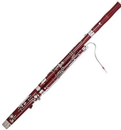
Slika 14. Fotografije instrumenata - fagot