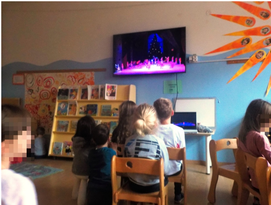
Slika 19. Gledanje baleta

Na samom kraju, djeci sam ponudila mogućnost likovnog izražavanja slikanjem instrumenata iz skladbe ili nastavka gledanja i slušanja baletne izvedbe „Orašar“ Boljšoj teatra. Djeci koja više nisu bila zainteresirana za sudjelovanje u aktivnosti, dozvolila sam slobodnu igru u jednom dijelu sobe dnevnog boravka. Isprva je veći broj djece sudjelovao u gledanju baleta, no, s vremenom se grupica počela smanjivati. Poseban interes za baletom pokazali su dječaci A. A. i T. T.. Mlađeg dječaka T. T. je izrazito radovalo prepoznavanje lika Orašara tijekom gledanja baleta.