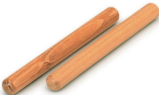
Slika 6. Štapici