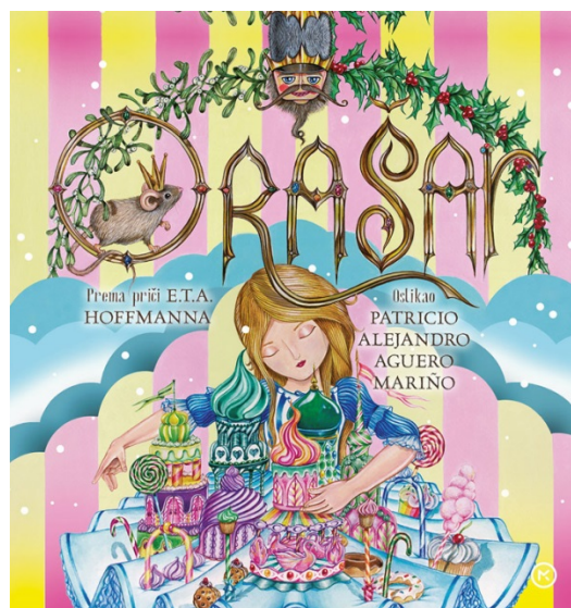
Slika 37. Slikovnica Orašar