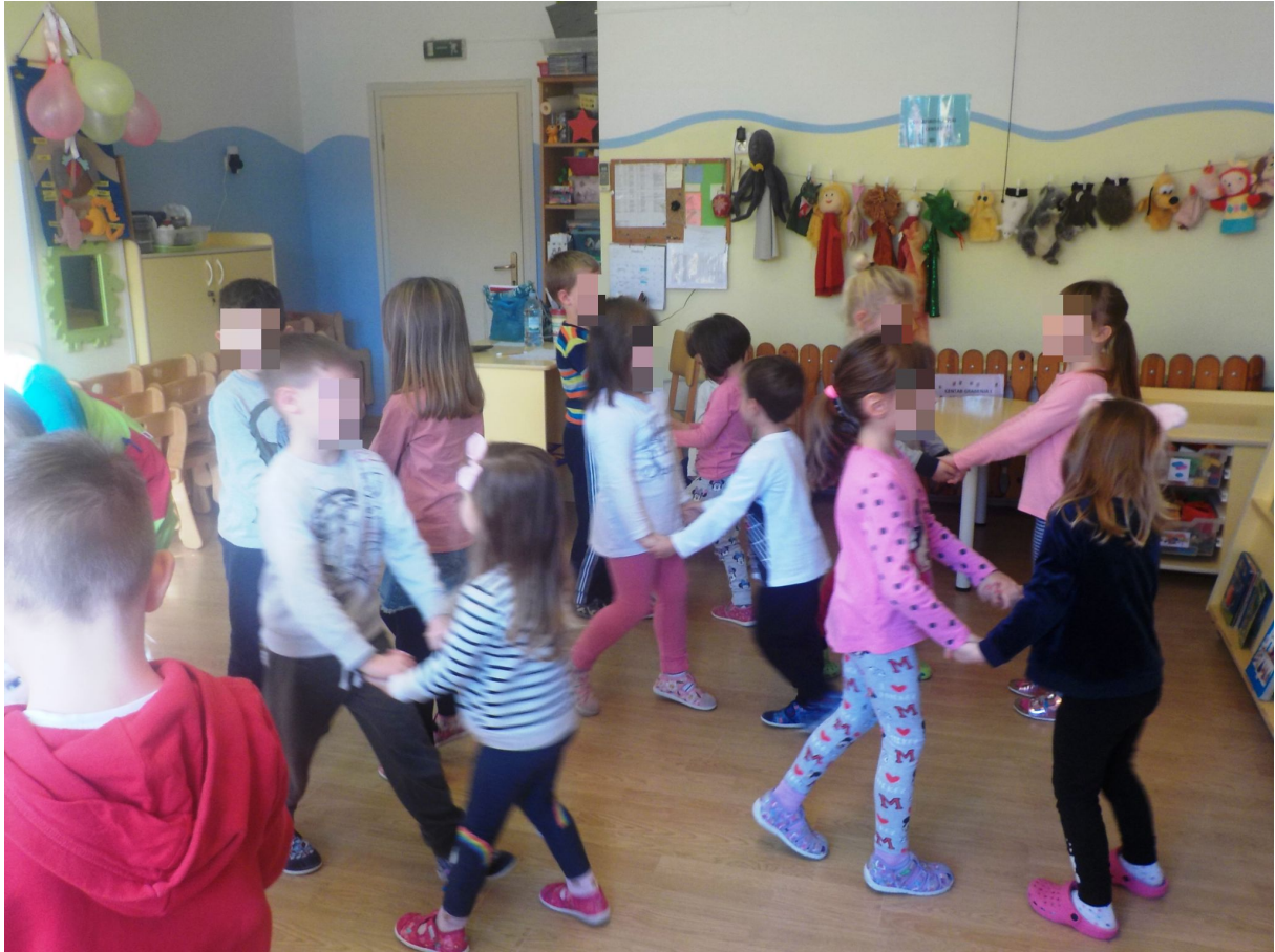
Slika 7. Bečki valcer 1