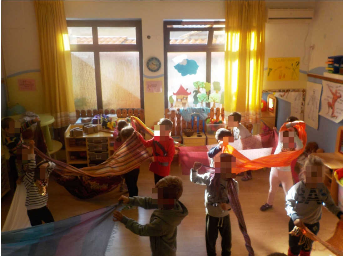
Slika 11. Plesno stvaralaštvo 2

Po završetku plesa, sva su djeca vratila šalove u kutiju, a zatim smo svi zajedno sjeli na pod i pogledali izvedbu Valcera cvijeća Boljšoj teatra. Djeca su s uzbuđenjem gledala balet, nastavljajući s gledanjem i dulje od trajanja obrađene skladbe. Tijekom gledanja, Š. Š. je objašnjavala A. A. koje od izvedenih pokreta i ona može izvesti, a O. O., Đ. Đ. i I. I. su međusobno komentirali zahtjevnost viđenih pokreta pitajući se na glas tko su muški likovi koji se pojavljuju u baletu. Djevojčice Š. Š., P. P., J. J., K. K., Č. Č., LJ. LJ. i S. S. su vrlo budno pratile ples, a V. V. se posebno istaknula prativši svaki pokret plesača gotovo bez treptaja. Kada je gledanju došao kraj, V. V. i A. A. su izrazili želju za nastavkom gledanja baleta prije popodnevnog odmora umjesto priče za lakši san.