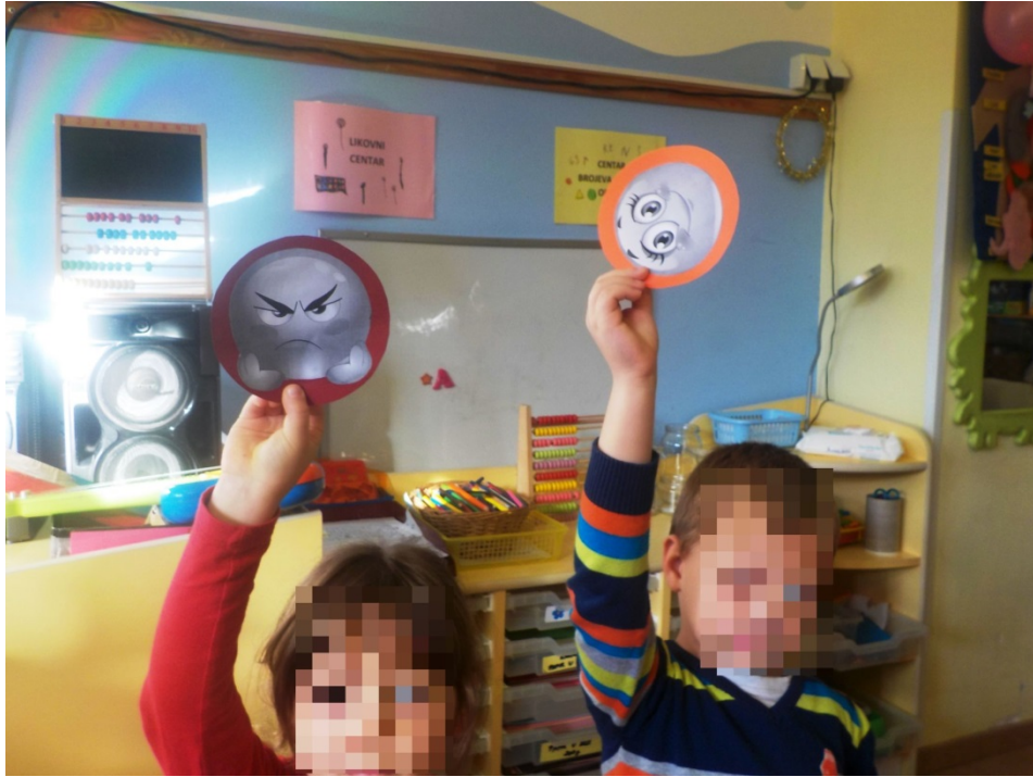
Slika 3. Glazbeni ugođaj 1