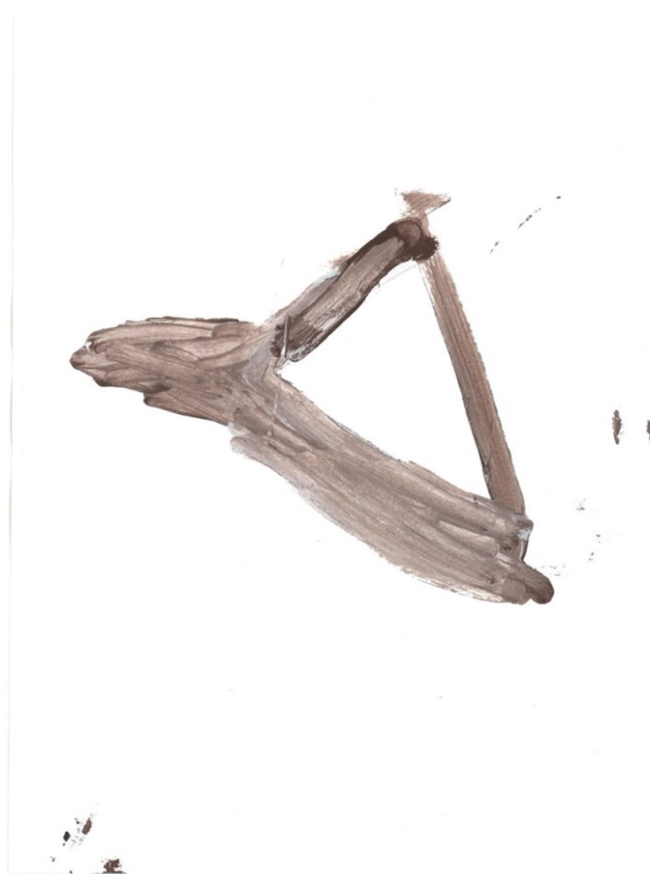
Slika 29. Triangl (I. I.)