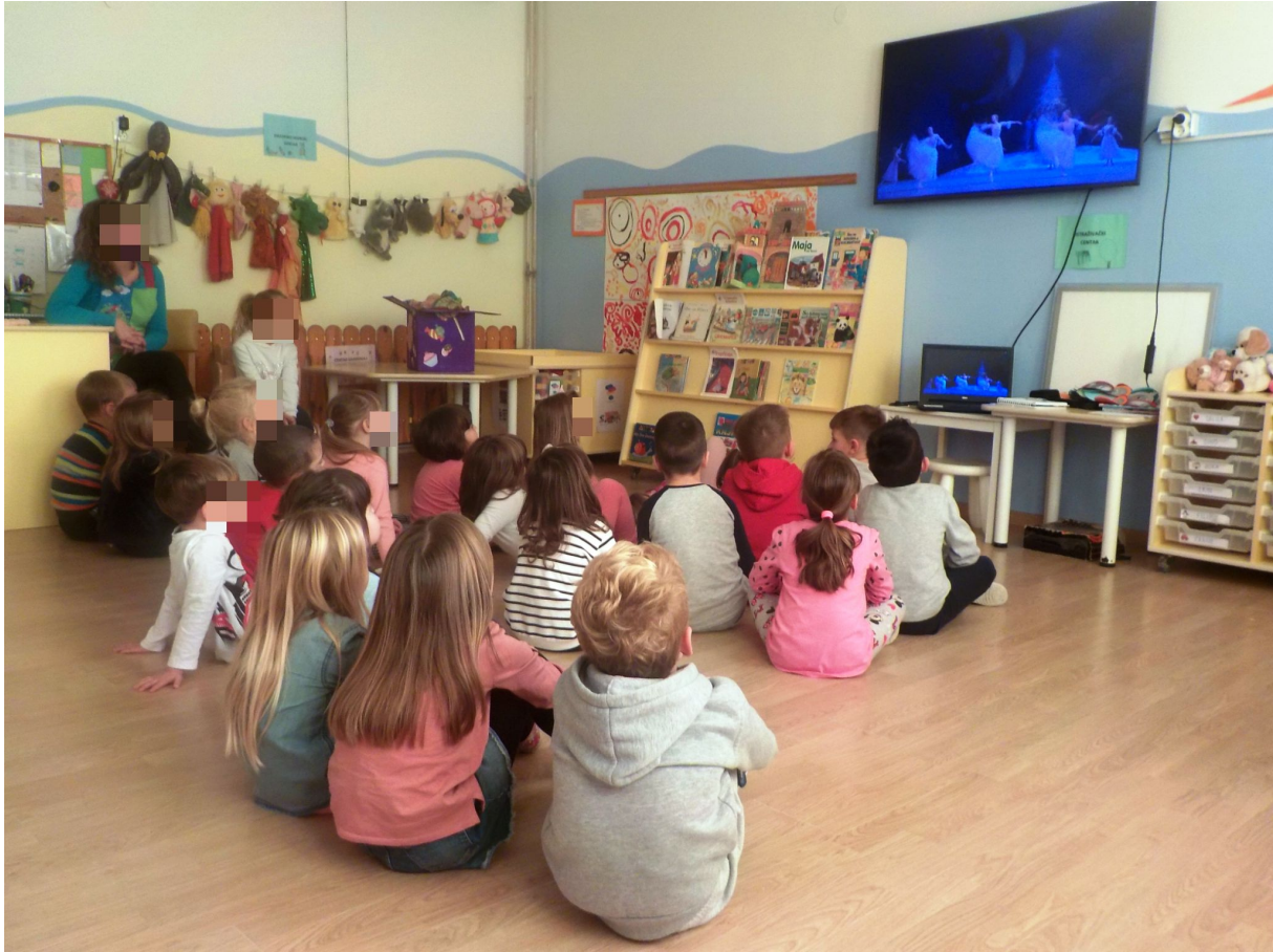
Slika 12. Gledanje Valcera cvijeća