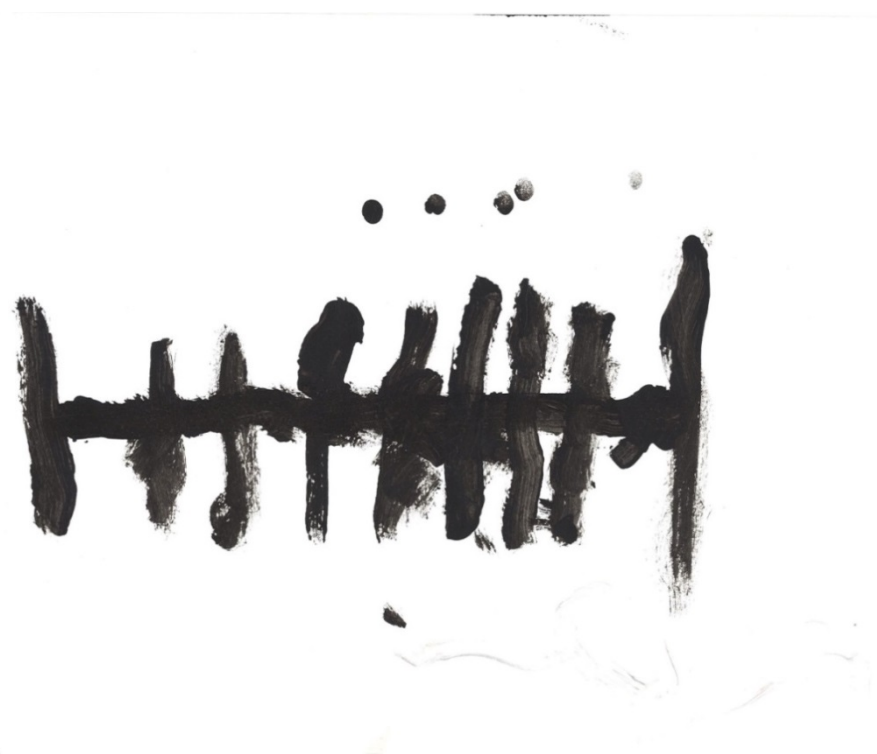
Slika 25. Zvončići (H. H.)