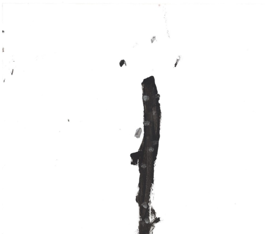
Slika 27. Piccolo (Č. Č.)