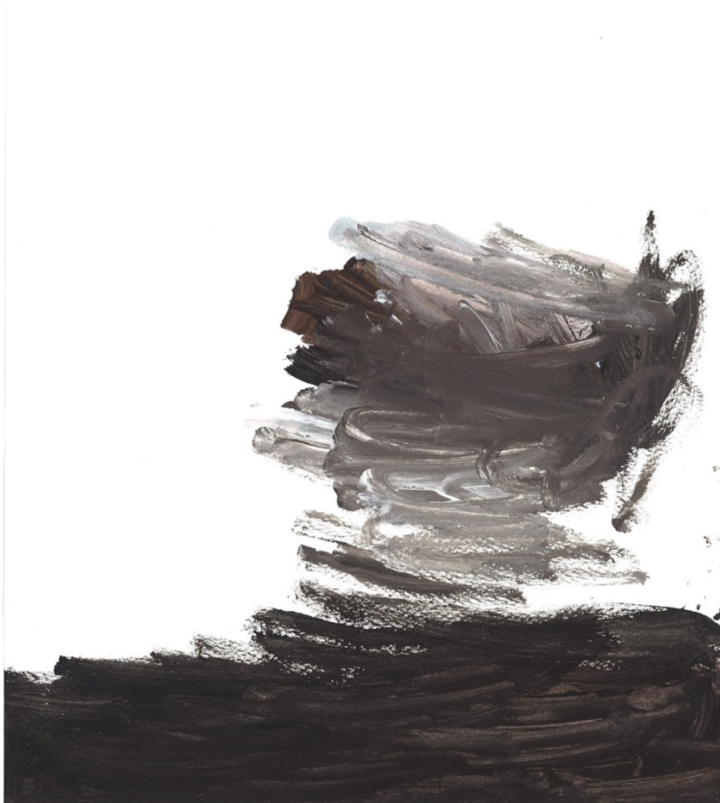
Slika 34. (N. N.)