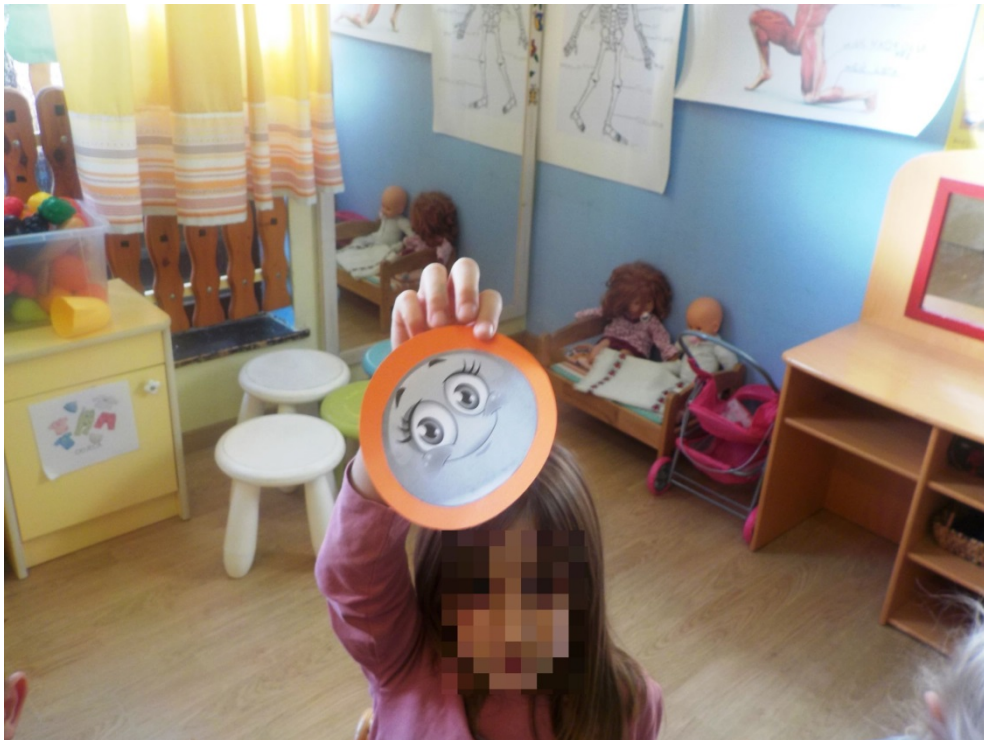
Slika 4. Glazbeni ugođaj 2