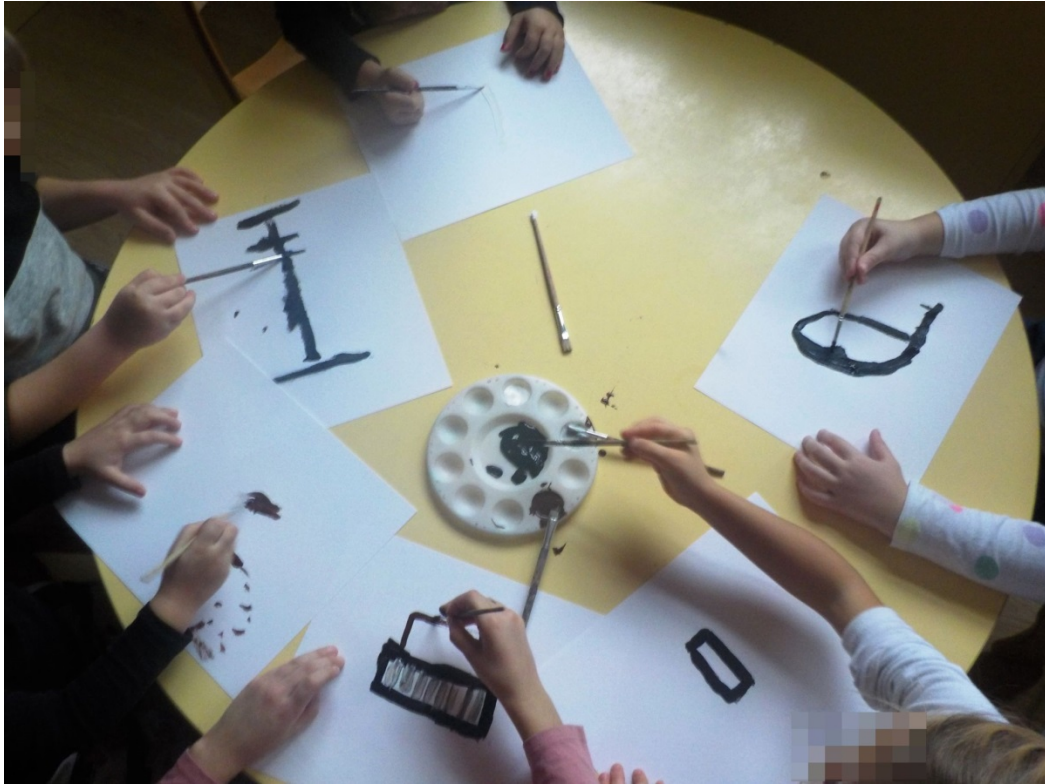
Slika 22. Likovno stvaralaštvo 3

Ponuđenom crnom, bijelom i smeđom temperom djeca su slikala instrumente na bijelom papiru. Kako bih im olakšala prisjećanje izgleda instrumenata, na stol sam im ponudila i fotografije instrumenata. Ovo su nastali radovi: