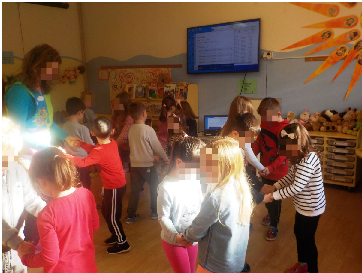
Slika 8. Bečki valcer 2

Za završni dio plesa, u sredinu prostorije postavila sam kutiju iz Zemlje slatkiša prepunu šarenih šalova.