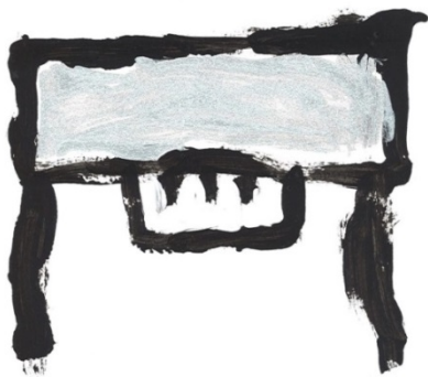
Slika 26. Klavir (F. F.)