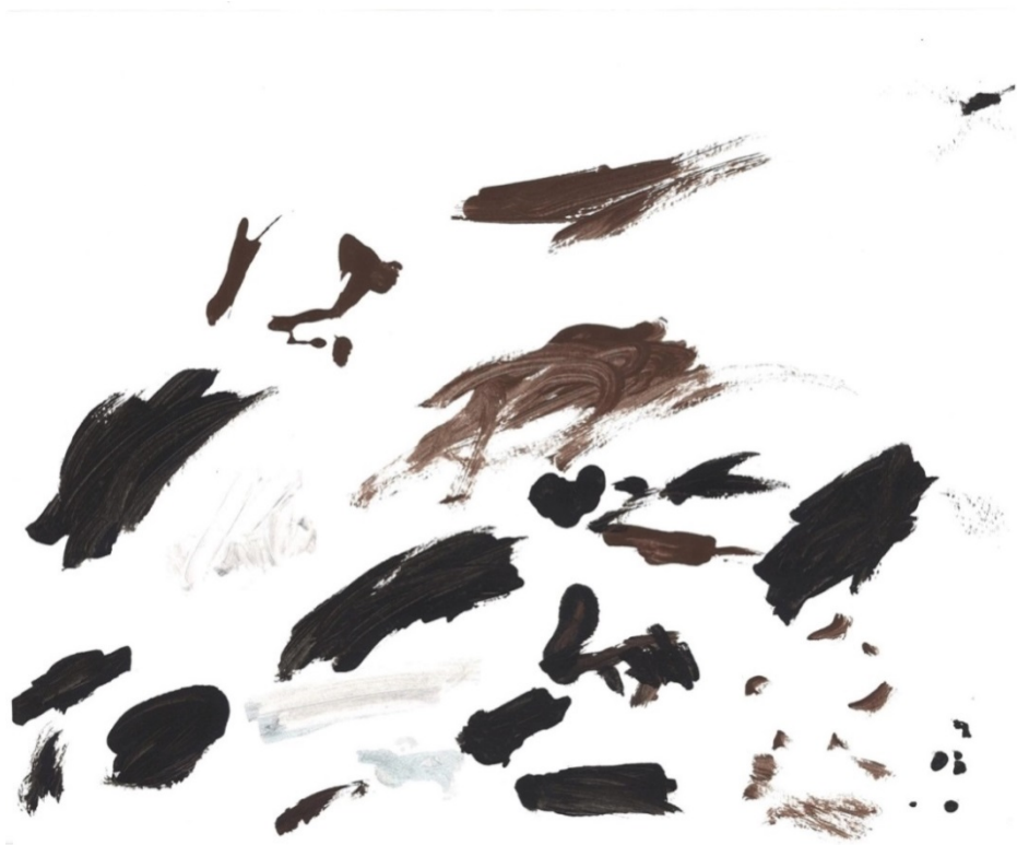
Slika 31. Violina (G. G.)