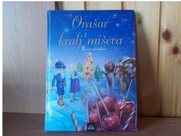
Slika 1. Slikovnica Orašar i kralj miševa

Provedbi aktivnosti Valcer cvijeća prethodilo je čitanje prepričane verzije priče Orašar i kralj miševa E. T. A. Hoffmanna u obliku slikovnice Gordane Maletić.