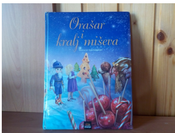
Slika 36. Slikovnica Orašar i kralj miševa