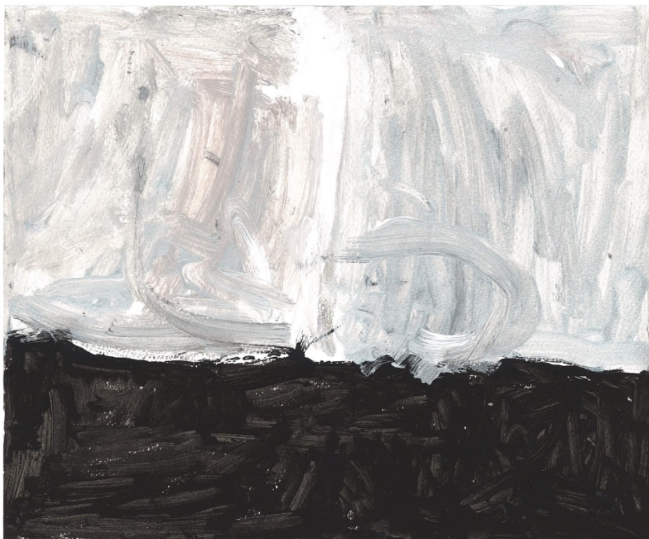
Slika 32. (E. E.)