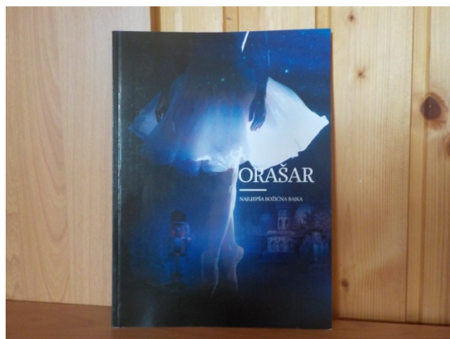
Slika 35. Monografija Orašar – najljepša božićna bajka