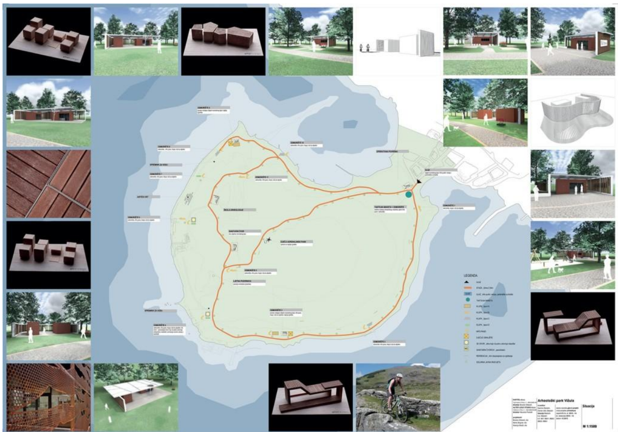
Slika 4. Projekt „Arheološki park Vižula“