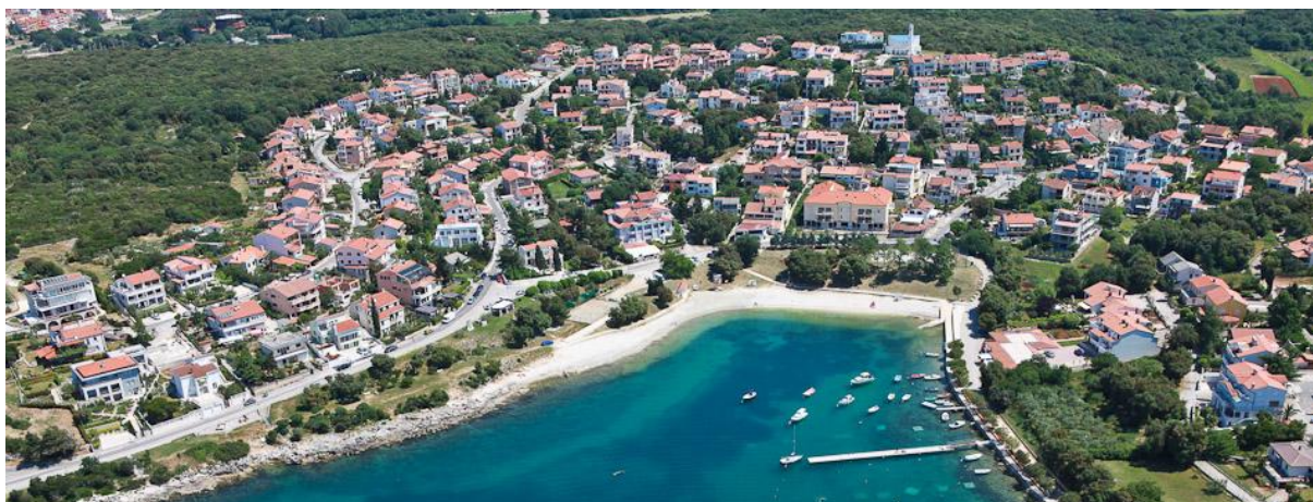
Slika 2. Narušavanje reljefa Pješćane uvale