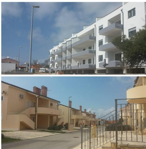
Slika 8. Naselje Pošesi danas