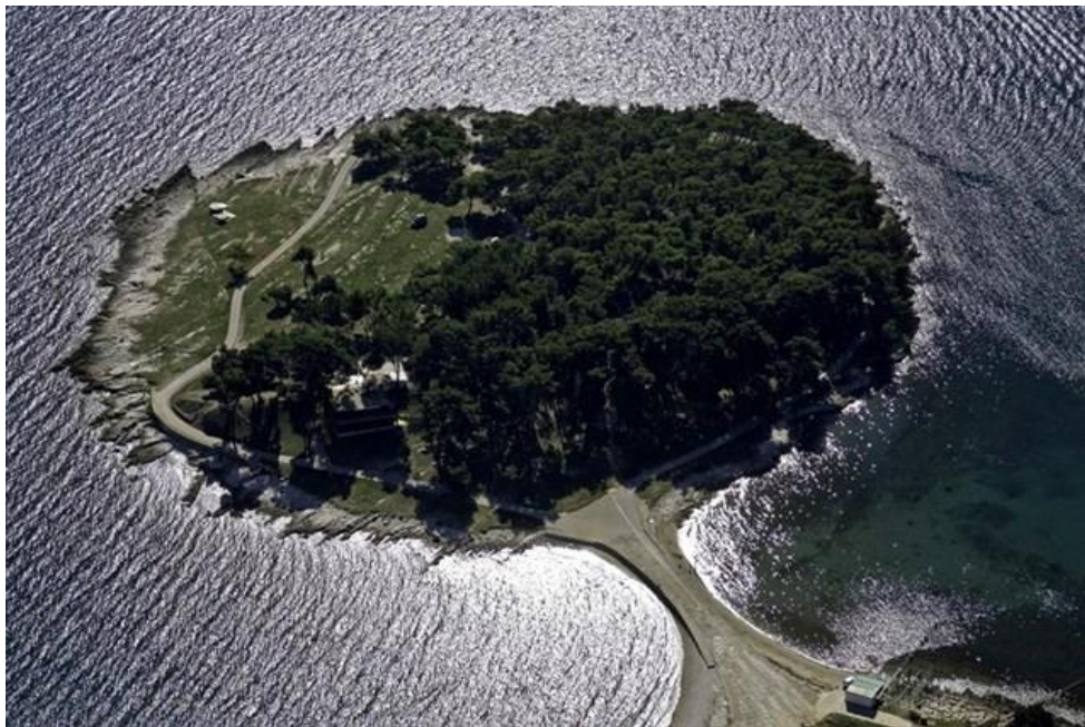
Slika 3. Park-šuma Kašteja