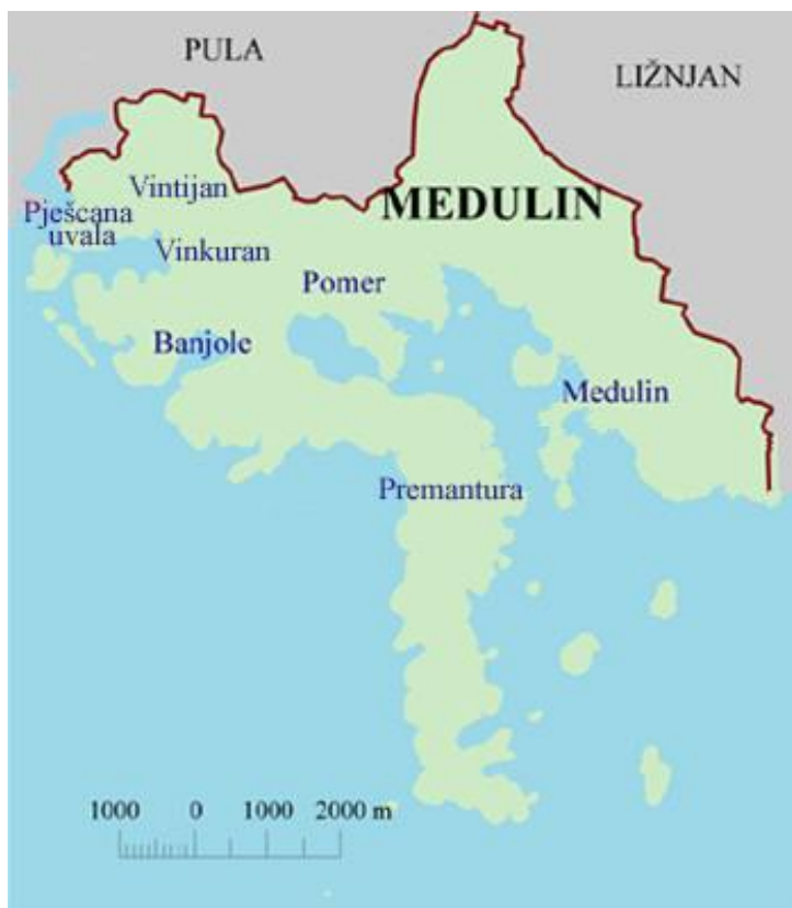
Slika 1. Naselja Općine Medulin