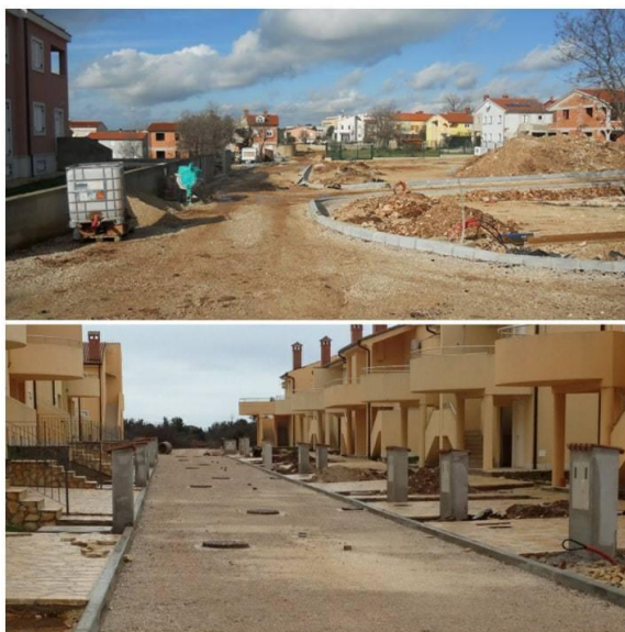
Slika 7. Naselje Pošesi prije uređenja