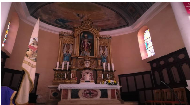
Slika 14. Glavni oltar u župnoj crkvi sv. Martina b.