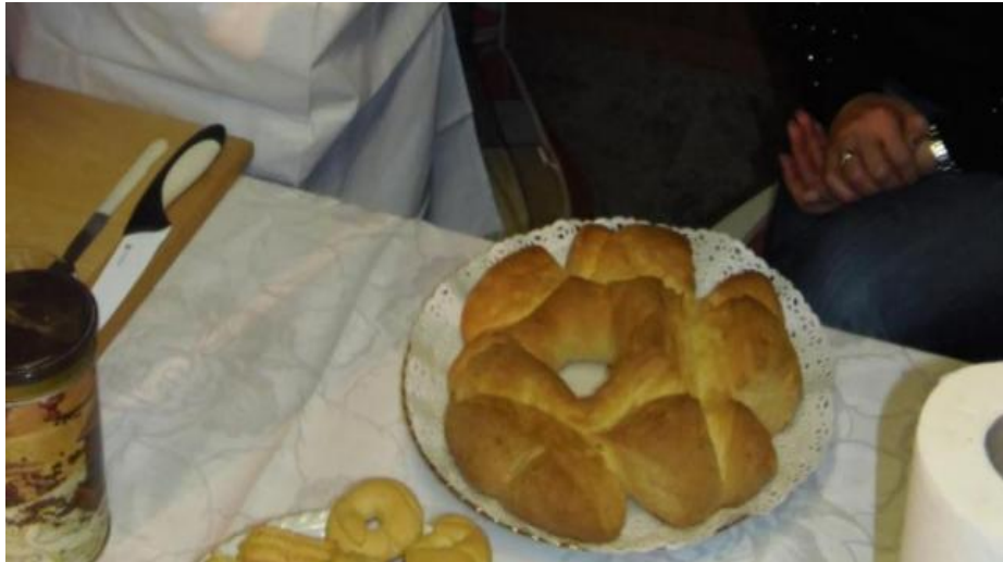
Slika 6. Ližnjanski martinjski „kolač“

U Ližnjanu se za Martinju spravlja „kolač“ koji je zapravo posebna vrsta kruha koji se pravi samo za Martinju ili za svadbu (sl. 6). Posebnost kolača je njegov kružni oblik i ukrašavanje gornje strane. S ključem se urezuju spojeni krajevi jedan preko drugoga. Kolač se ne reže nožem već se lomi rukama.