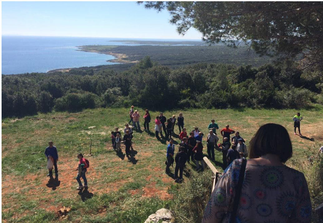
Slika 12. Pogled s osmatračnice