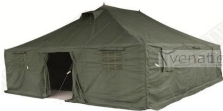
Slika 24. Vojni šator