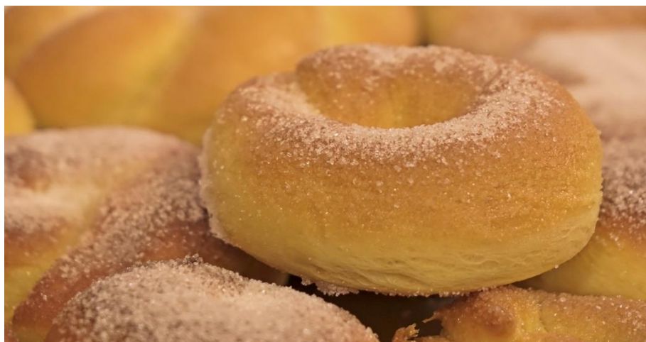
Slika 7. Šišanski busoladini

U Šišanu kao posebnost izdvajaju busoladine (sl. 7), kolačiće od krušnog slatkog tijesta koji neodoljivo podsjećaju na bucolaje tipične za područje Istre, no razlikuju se po tome što se ne peku u pećnici već u vrućem ulju.