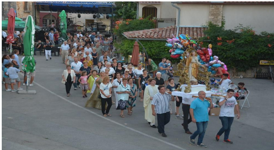
Slika 4. Procesija u Šišanu

Procesija povodom proslave blagdana Velike Gospe 15. kolovoza dugi niz godina održava se u Šišanu. Kreće iz župne crkve sv. Feliksa i Fortunata u sklopu svečane sv. Mise. Kip Gospe nosi se na postolju te se ide kružno ulicama oko crkve (sl. 4).