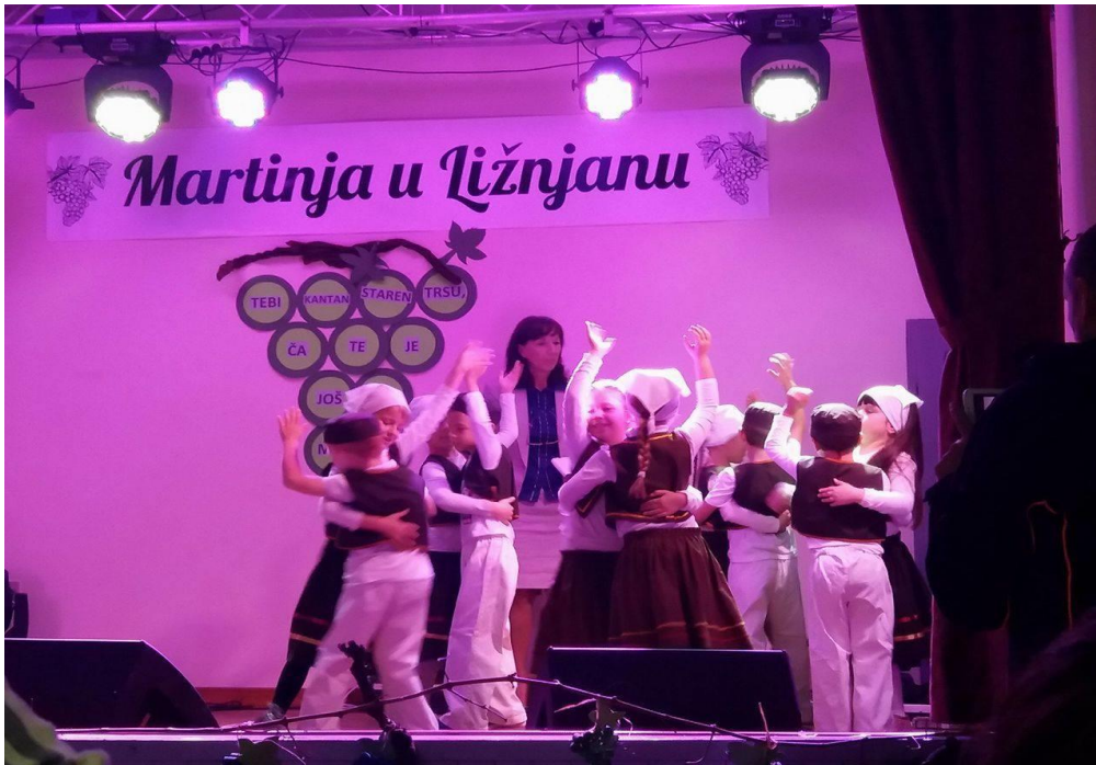
Slika 1. Nastup vrtičke skupine u sklopu programa Martinja u Ližnjanu

(izvor: arhiva Turističke zajednice Općine Ližnjan, 19. veljače 2020.)