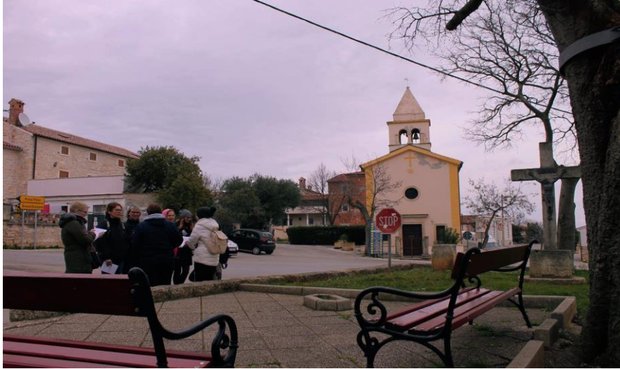
Slika 17. Crkva Majke Božje od Milosti na Muntu

Crkva se nalazi na glavnom raskršću sela (sl. 17). Sagrađena je početkom 18. stoljeća.