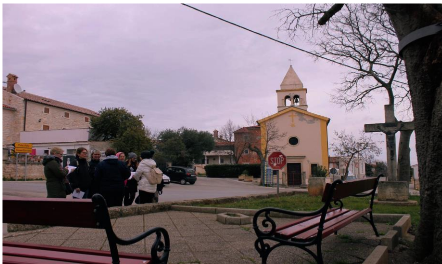
Slika 17. Crkva Majke Božje od Milosti na Muntu

Crkva se nalazi na glavnom raskršću sela (sl. 17). Sagrađena je početkom 18. stoljeća.