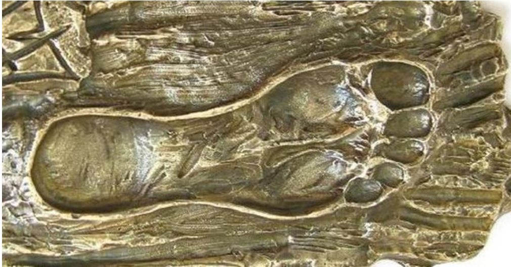
Slika 25. Stopa sv. Martina

Ližnjan je upisan na kartu kulturnog itinerara „Sveti Martin Europljanin, simbol dijeljenja, zajednička vrijednost“ 2015. simboličnim postavljanjem stope koja označava kretanje, dijeljenje i zajedništvo, a rad je kipara Michela Audiarda (sl. 25).