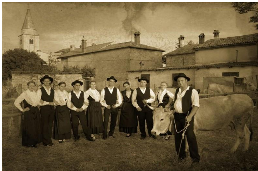
Slika 5. Folklorna sekcija zajednice Talijana Šišan u narodnoj nošnji

Istriotski autohtoni predmletački romanski jezik jugozapadne Istre nalazi se na popisu 24 najugroženija europska jezika. Jezični otok južne Istre čine Rovinj, Vodnjan, Bale, Fažana, Galižana i Šišan. Jako je ugrožen i može se reći da je pred izumiranjem jer se njime služe uglavnom stariji govornici. Mlađe talijansko stanovništvo ga uglavnom razumije no ne koristi se njime te je Zajednica Talijana Šišan sa svojom aktivnom sekcijom folkloru poduzela mnoge aktivne korake u svrhu očuvanja jezika (sl. 5).