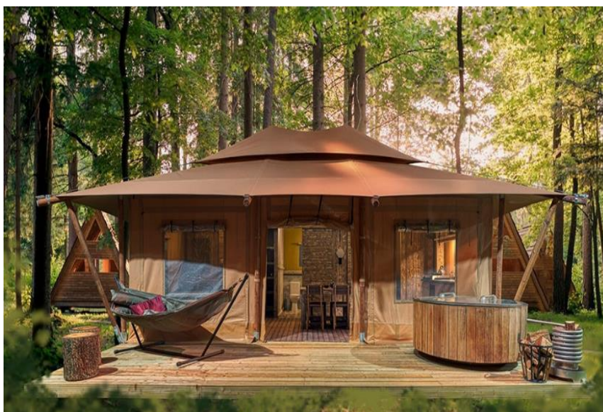
Slika 23. „Glamping“ šator

Monte Madonna i okolno područje koje osim fortifikacije uključuje pripadajuće objekte zgrada s uredskim prostorima, spavaonicama, sanitarnim čvorom i kuhinjom te hangar i zelena površina idealni su za valorizaciju u turističke svrhe. Zelena površina omogućava postavljanje kampa. Zbog velike površine kamp bi mogao biti tematski podijeljen, jedan dio kampa mogao bi biti glamping (sl. 23).