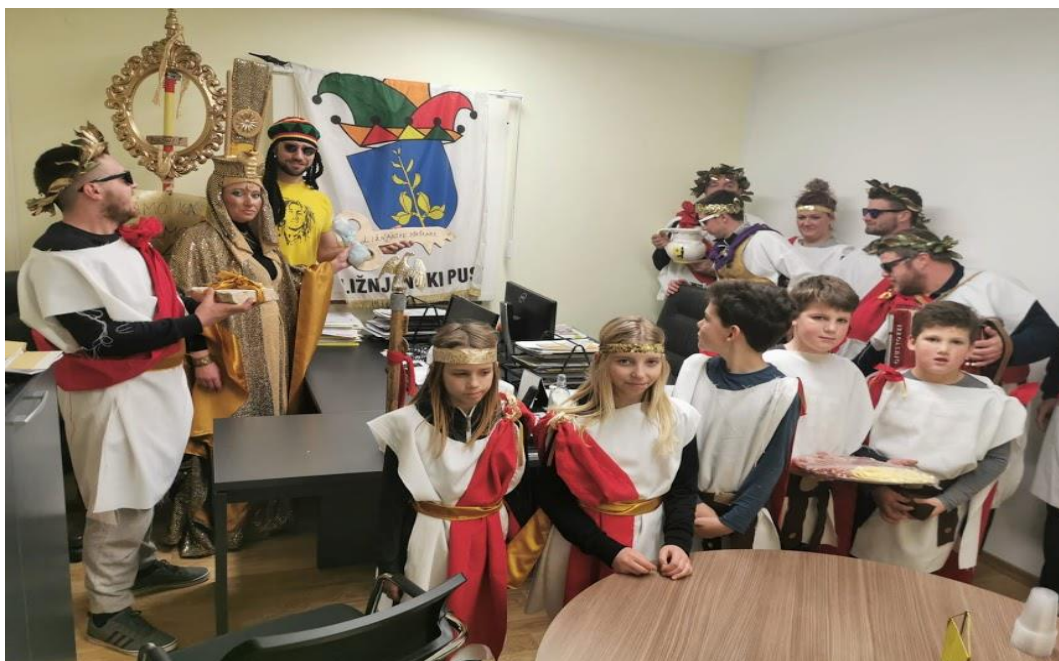
Slika 3. Preuzimanje općinskog ključa u uredu načelnika

Današnji običaji započinju preuzimanjem općinske vlasti od strane maškarane skupine. Načelnik općine predaje „ključ“ od općine i na taj način simbolično započinje vladavina maškara (sl. 3).