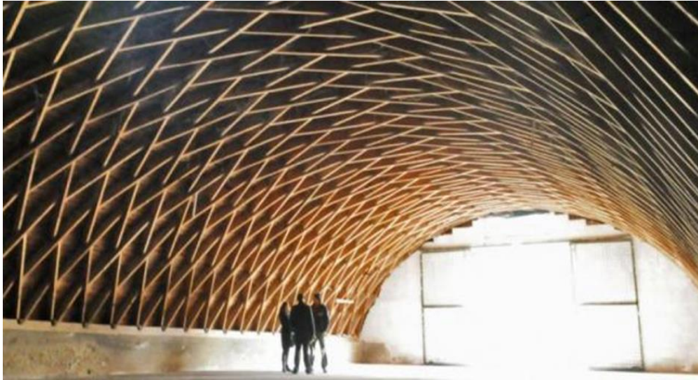
Slika 13. Hangar na Svetici