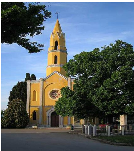
Slika 21. Crkva sv. Ivana Apostola u Valturi

U Valturi se nalazi crkva Sv. Ivana Apostola iz 19. stoljeća (sl. 21). „Crkva ima vrlo vrijedan inventar svetište, sakristiju, tri mramorna oltara, krstionicu od bakra i vrijednu staru ispovjedaonicu. 28 metara visok zvonik karakterističnog je osmerokutnog oblika“ 36 .