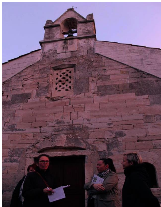
Slika 19. Crkva sv. Trojstva, Šišan

Izgrađena je 1450. Na vanjskim zidovima crkve nalaze se uklesani križevi (sl. 19). „Na pročelju crkve je preslica. Na posvetnom križu nalaze se glagoljski grafiti.“ 35