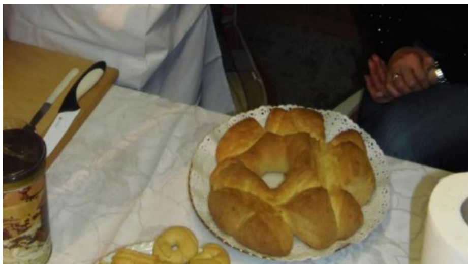
Slika 6. Ližnjanski martinjski „kolač“

U Ližnjanu se za Martinju spravlja „kolač“ koji je zapravo posebna vrsta kruha koji se pravi samo za Martinju ili za svadbu (sl. 6). Posebnost kolača je njegov kružni oblik i ukrašavanje gornje strane. S ključem se urezuju spojeni krajevi jedan preko drugoga. Kolač se ne reže nožem već se lomi rukama.