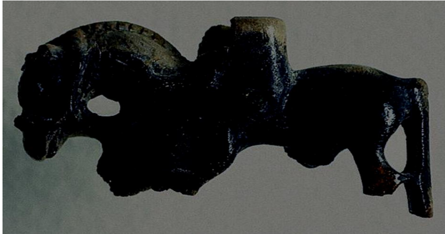
Slika 9. Koštani konjić s jahačem, Nezakcij