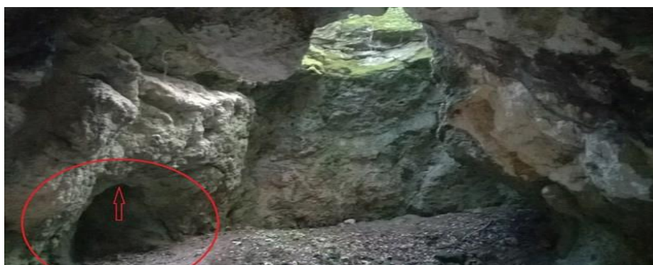
Slika 8. Spilja Šandalja

„Krška uzvisina San Daniele (u narodu poznata pod nazivom Šandalja) smještena je 4 kilometra sjeveroistočno od centra Pule. U podnožju samog brda, prilikom miniranja u kamenolomu, u svibnju 1961., pronađen je sustav pećina pod nazivom Šandalja koji obuhvaća više fosilnih pećina i šupljina (Šandalja I i Šandalja II). Jedan od najznačajnijih paleolitskih nalaza, pronađenih u Šandalji, svakako je tzv. sjekač koji je izrađen iz potočne valutice (kremena) i mogao bi biti istovremen s najstarijim alatkama različitih europskih nalazišta te predstavlja najstariji trag ljudske djelatnosti na tlu Hrvatske.“ 29