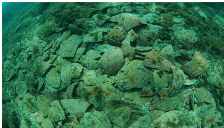
Slika 10. Ostaci brodoloma kraj rta Uljeva

U registru kulturnih dobara uz arheološki park Nezakcij nalazi se i hidro arheološki lokalitet Ostaci tri brodoloma kraj rta Uljeva (sl. 10). To su jedina dva kulturna dobra upisana u registar kulturnih dobara. „Najuočljiviji brodolom je Uljeva A jer su na njemu sačuvani vrlo brojni ostatci trbuha masivnih ranorimskih amfora. Gotovo dvjestotinjak metara od njega nalazi se brodolom Uljeva B koji se površinski prepoznaje samo po manjim ulomcima crvenih amfora i keramike u škrapama. Novovjekovni brodolom Uljeva C prepoznaje se po brojnim opekama rasutim na dnu, dok se na Uljevi D, smještenom tristotinjak metara dalje, na morskom dnu uočavaju brojne tegule“. 31