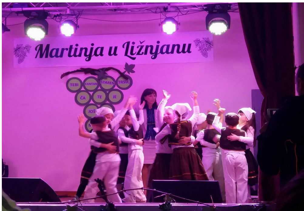
Slika 1. Nastup vrtičke skupine u sklopu programa Martinja u Ližnjanu