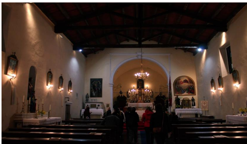
Slika 18. Unutrašnjost crkve sv. Feliksa i Fortunata