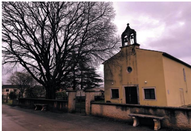
Slika 20. Crkva sv. Jeronima, Muntić

U selu Muntiću stoji crkva sv. Jeronima iz razdoblja 14. – 15. stoljeća, a možda je i starija no nije se detaljno istraživala (sl. 20).