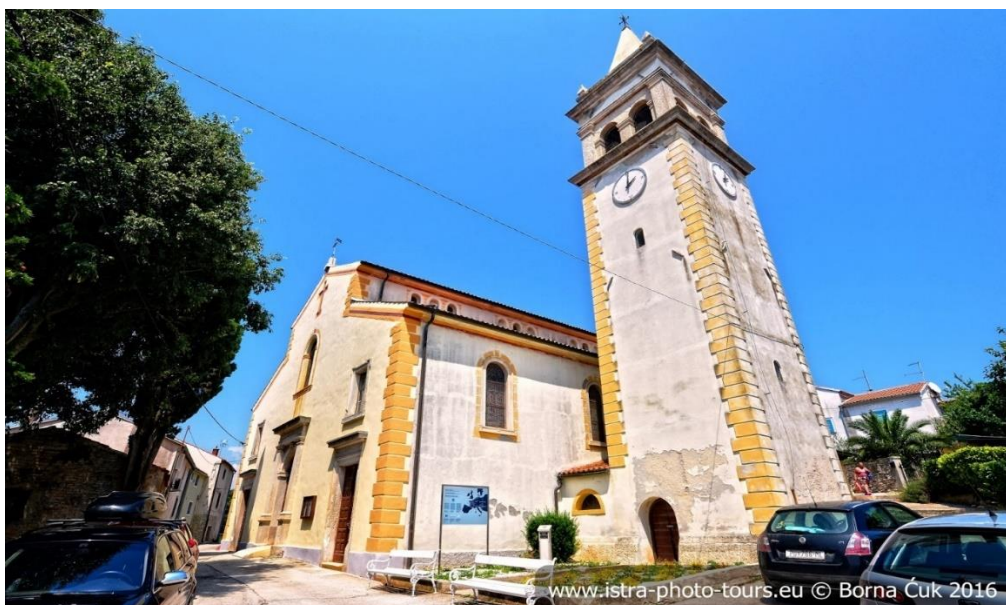
Slika 2. Župna crkva sv. Martina u Ližnjanu

Nakon programa vrtičara, školaraca i KUD-a u Župnoj crkvi sv. Martina b. u Ližnjanu (sl. 2) održava se kulturno umjetnički program „U čast sv. Martinu“, u sklopu kojega nastupaju zborovi, nakon čega se program nastavlja u općinskoj sali gastro ponudom slasnih pijata šuga od divljači i žbruvade koju pripremaju Udruga Ližnjanske maškare i DVD Ližnjan.