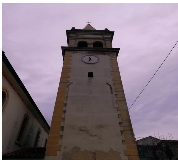
Slika 15. Zvonik župne crkve sv. Martina b.

Uz glavni oltar postoji još četiri oltara, svi su kameni i imaju povišeno svetište. Zvonik crkve je visok 30 metara (sl. 14) .