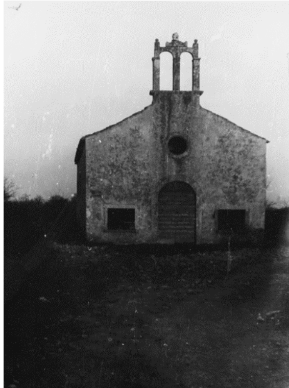
Slika 22. Crkva sv. Marije, Kostanjica

Srednjovjekovna crkva (sl. 22), nalazi se u blizini Valture, smještena pored lokve među poljima.