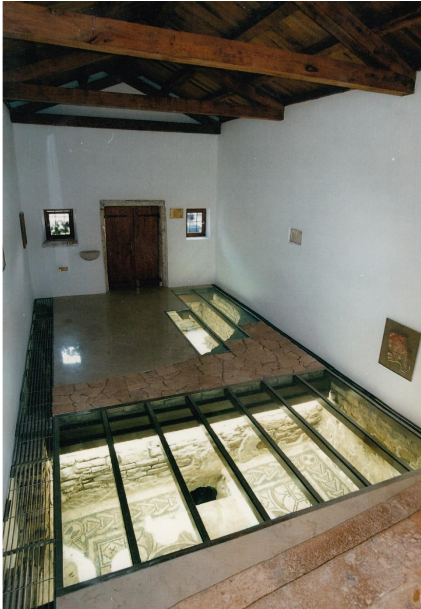
Slika 16. Podni mozaik

i graditeljski spomenik u užoj okolici Ližnjana. 32 U crkvi Majke Božje od Kuj ugrađen je stakleni pod koji prekriva mozaik iz kasnoantičke vile rustice (sl. 16).